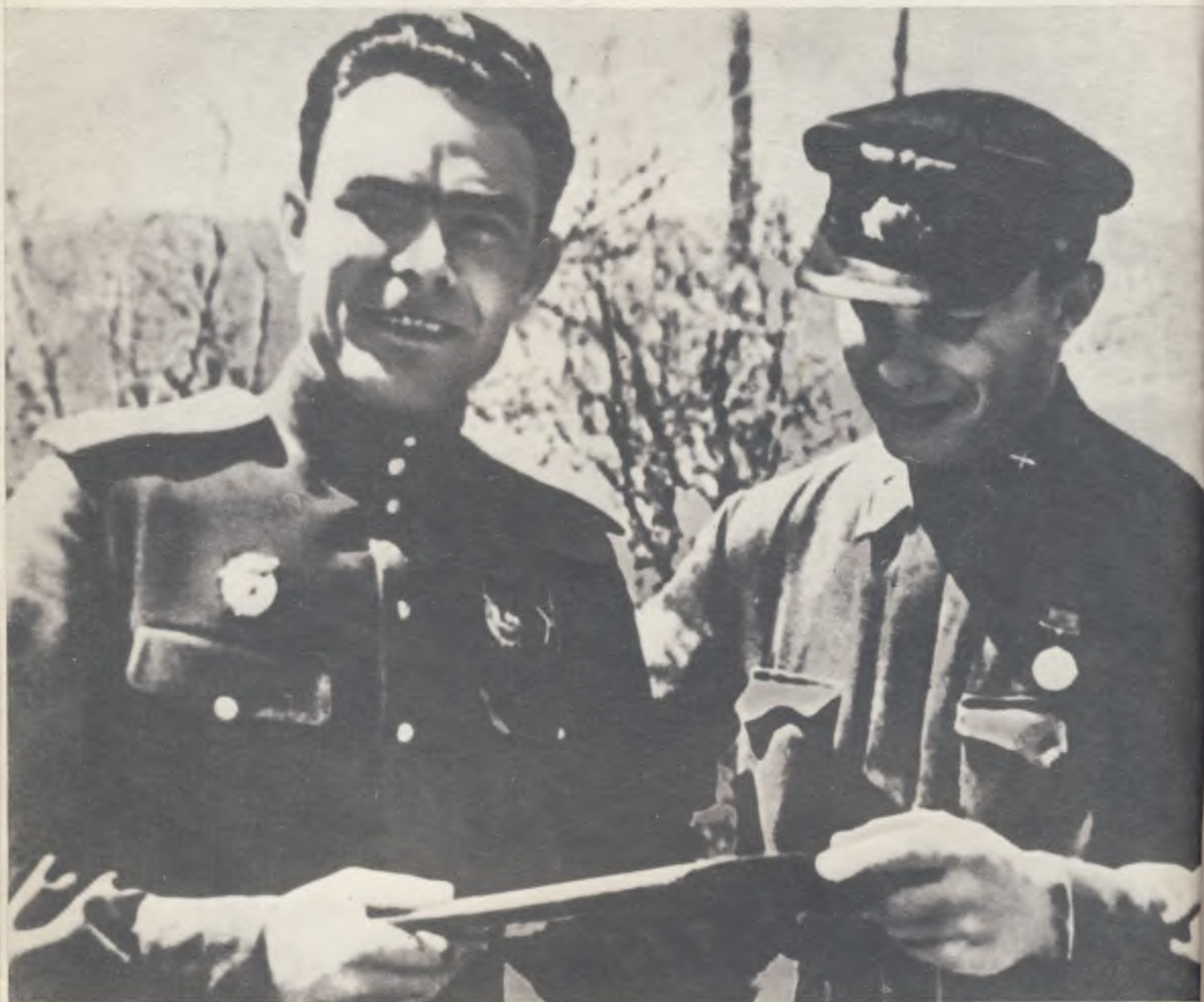
Малая земля, 1943 год. Начальник политотдела 18-й армии Л. И. Брежнев с боевым товарищем.