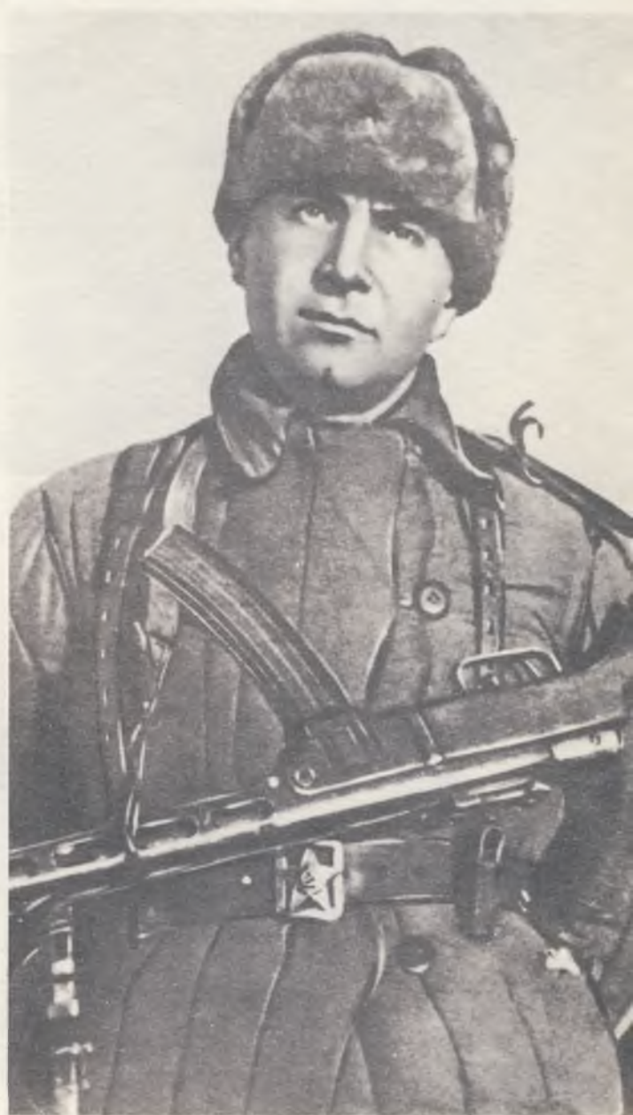
Герой Советского Союза Ц. Л. Куников в дни боёв под Новороссийском (1943 год).