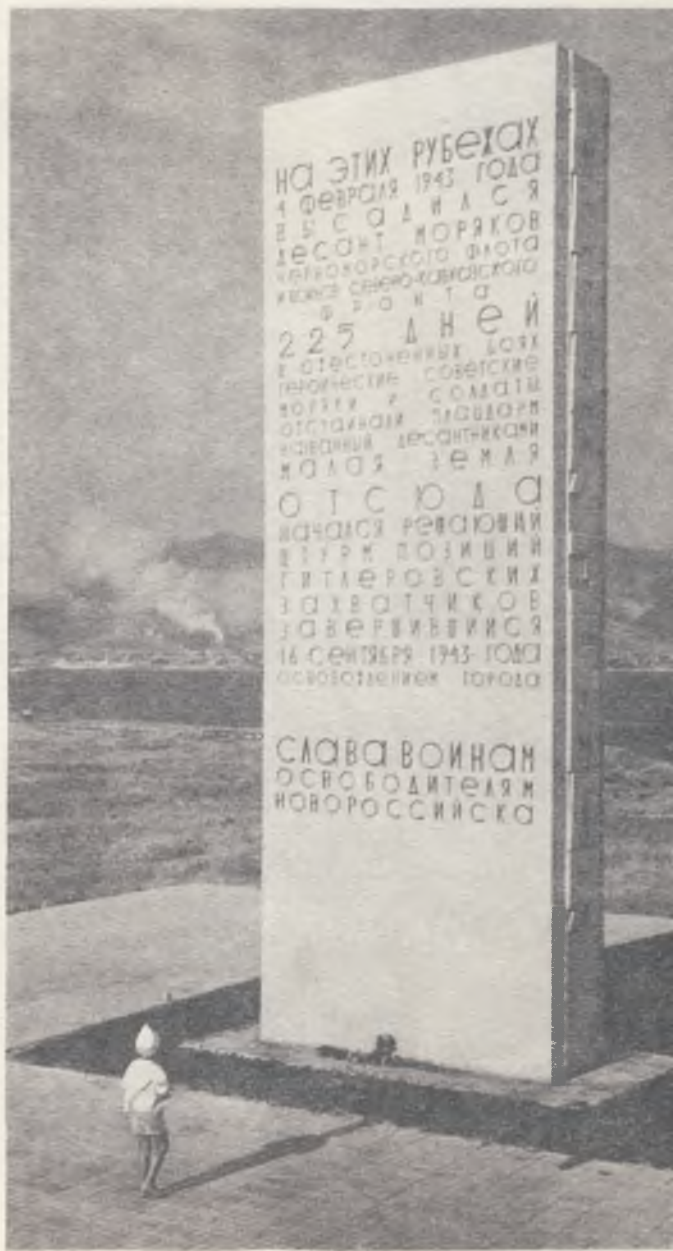
Новороссийск. Малая земля. Памятник на месте высадки морского десанта 4 февраля 1943 года.

Вся площадь Героев всколыхнулась, зааплодировала, наполнилась радостными голосами тружеников, ветеранов войны и тех, кто теперь несёт воинскую службу.