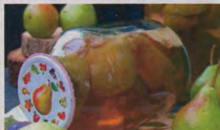
Анжелика МОСТОВАЯ, г. Кременчуг.

Груши мою, разрезаю пополам и удаляю черенки. Выкладываю в стерилизованные банки, заливаю кипятком и оставляю на 20 мин., прикрыв крышкой. Воду сливаю, кипячу и опять заливаю груши, но на 10 мин. Перед третьей заливкой в воду добавляю сахар, лимонную кислоту, корицу и мяту. Горячий сироп вливаю в банку. Сразу закатываю прокипяченными крышками. Переворачиваю и укутываю до полного остывания.