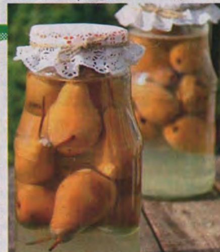
Вероника КРАМАРЬ, пос. Первомайское Ленинградской обл.

Вымытые груши целыми выкладываю в стерилизованные банки. Заливаю до верха кипятком, прикрываю прокипяченными крышками и оставляю на 15-20 мин. Воду сливаю, кипячу. В каждую банку всыпаю по 200 г сахара, заливаю кипятком до верха, прикрываю крышками. Стерилизую 25 мин. и закатываю. Переворачиваю и укутываю до остывания. Храню не более года.