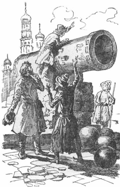
Сенька взобрался на Царь-пушку...