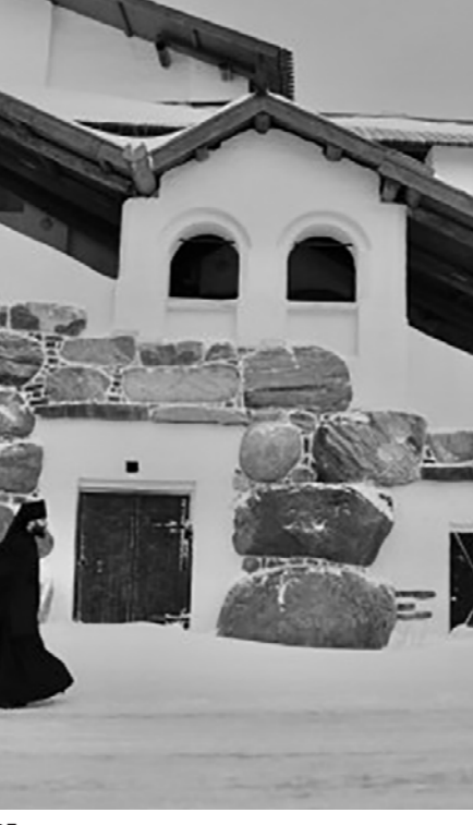
Кадр из фильма «Святой архипелаг»

За молитвенный труд тут отвечают постановочно посаженные за ночную молитву монахи и немного заснятых богослужений. Причём крупных портретов на этих богослужениях тоже нет. Есть сцена