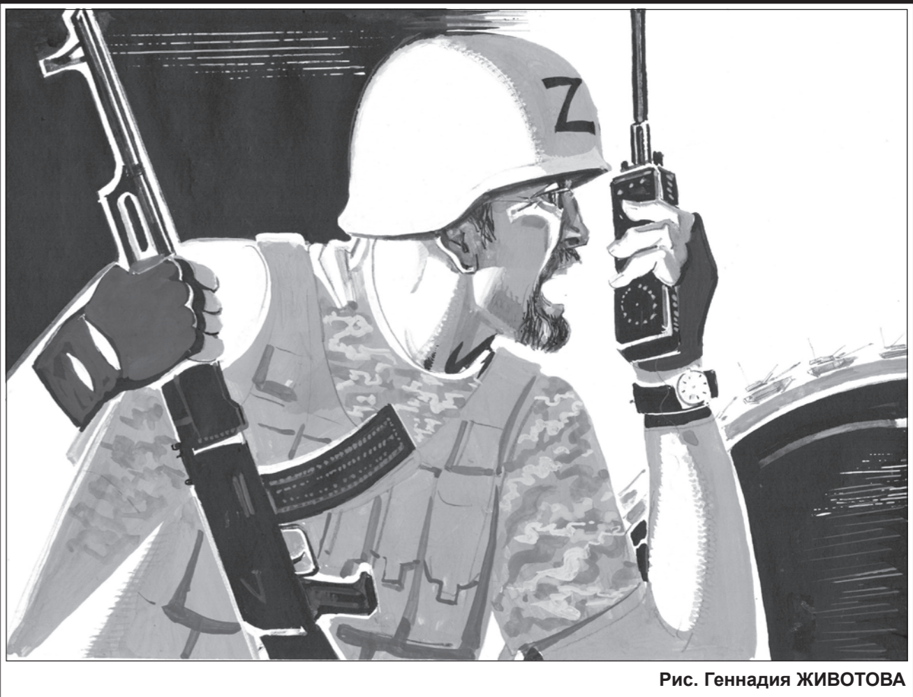
Рис. Геннадия ЖИВОТОВА

Подписывайтесь на газету "Завтра", делитесь этой информацией с людьми, близкими вам по духу!