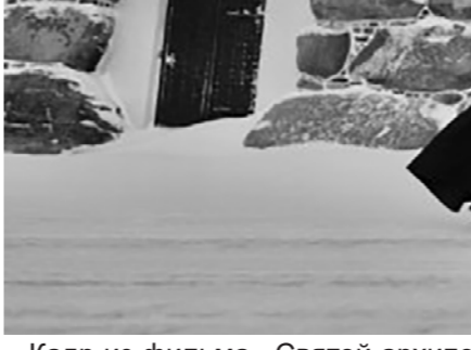
Кадр из фильма «Святой архипелаг»

В фильме отсутствует драматургия. Нет её: ни явной, ни каких-либо "подводных течений" — просто ничего. Хотя монастырь — это место, где невидимо ведётся постоянная борьба, и пространства для драматургии тут хоть отбавляй. А задача