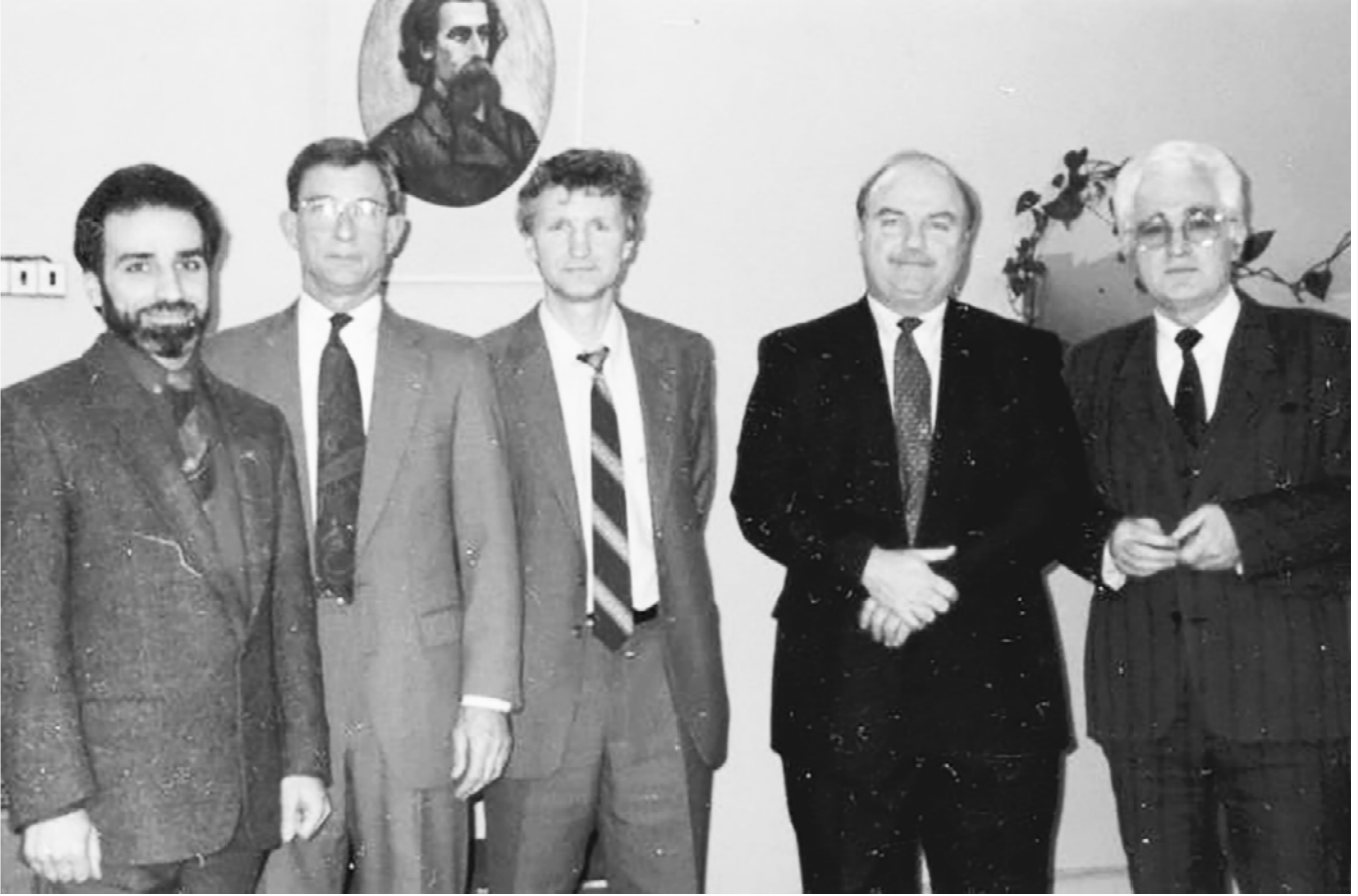
СПАСИТЕЛИ МИРА ОТ "РОССИЙСКОГО ЛЕВИАФАНА"