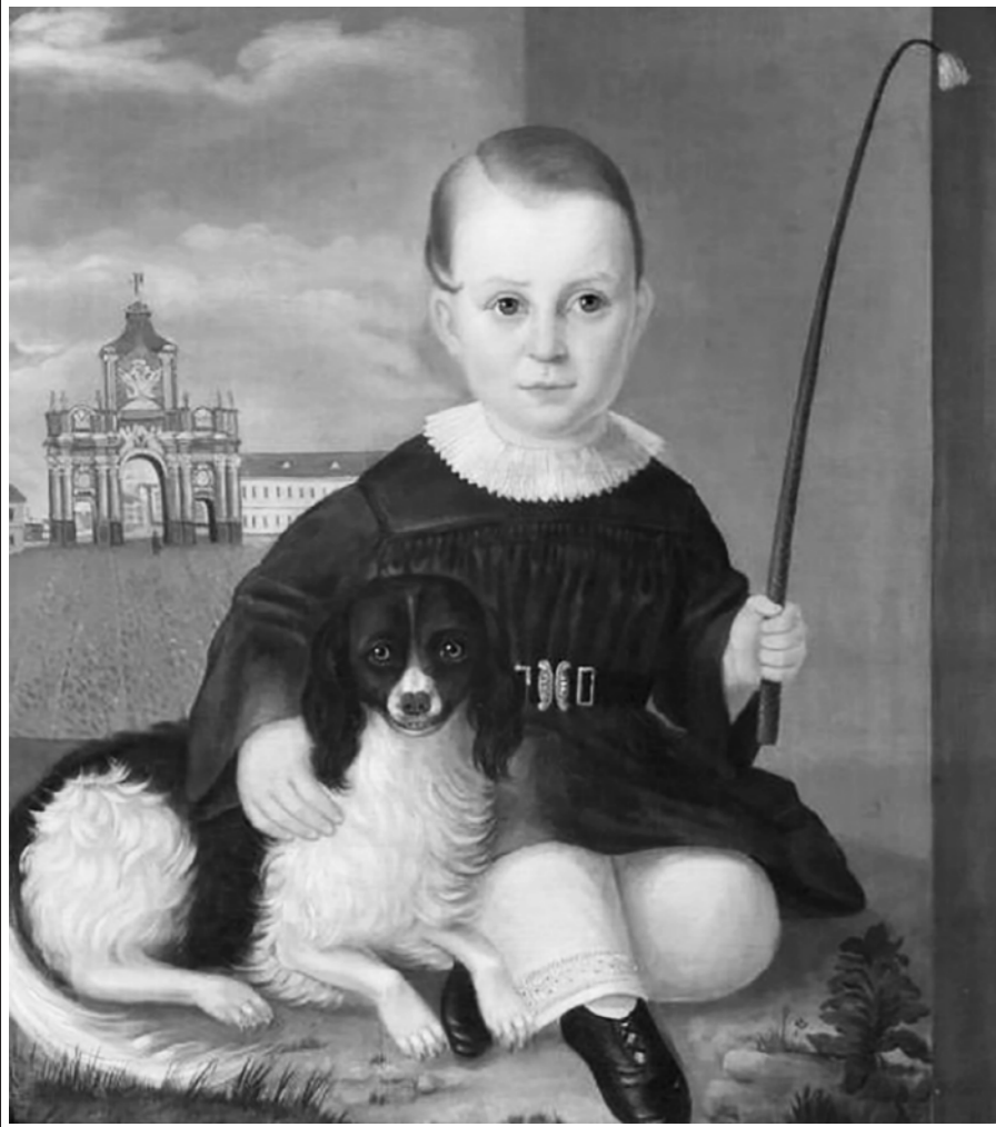
"Я как раз посерединке Жизни собственной стояла, — На Полянке, на Ордынке Тихо музыка играла!" Юнна Мориц

* Запрещённая в РФ террористическая организация