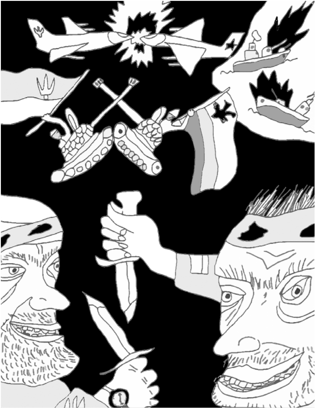
Сначала били самоходки, Потом мы шли на этажи. Сходясь, зубами рвали глотки. Исход решали штык-ножи.

Уважаемые участники! На мероприятиях можно приобрести книги авторов. Если вы хотели бы гарантированно приобрести книги из нашего ассортимента, просим вас заранее оформить заказ на сайте день-магазин.рф. Мы с радостью доставим вас заказ на встречу! Внимание! Видеосъёмка на мероприятиях запрещена.