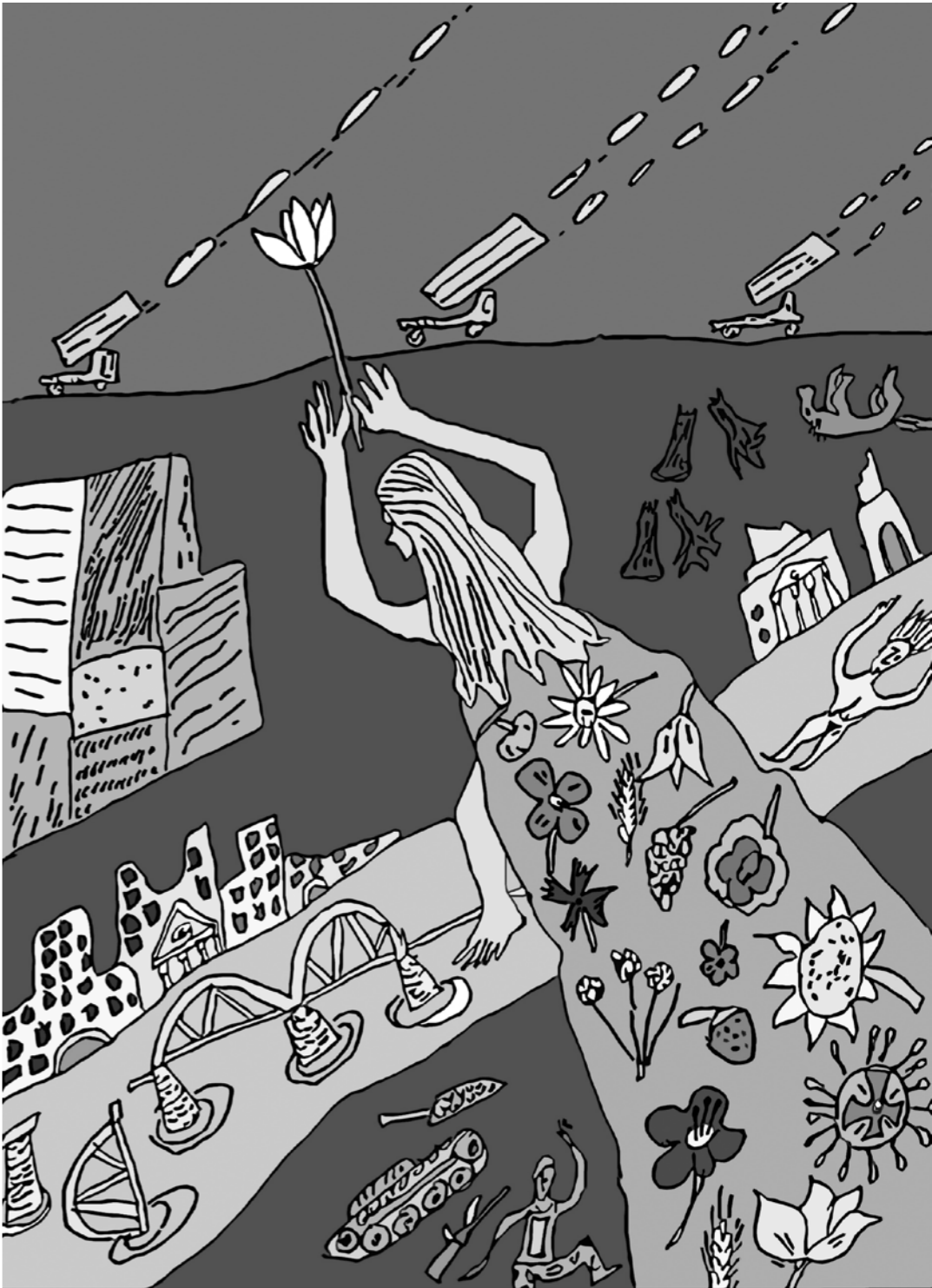
Весенняя, намокшая от слёз, Над Родиной, изрезанной фронтами, Победа, ты летишь в венке из роз, Обмотана кровавыми бинтами.

Слепая раскалённая сила швырнула Лощинина. Он взбегал скачками среди грохота гранат и автоматного треска. Квартира с номером 20. Сегодня дверь раскрыта. Бородач-ополченец шарается от стены к стене. В квартире грохот, сыпется люстра, летят щепки шкафа. Выше, выше. "Бог даст!.."