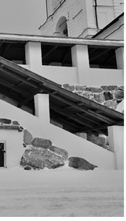
Кадр из фильма «Святой архипелаг»

"Святой архипелаг" похож на работу возрастного ученика киношколы, который ещё не научился до конца пользоваться выразительными средствами кино. Но мы-то на международном кинофестивале, самом престижном в стране и одним из крупнейших в мире, и призы здесь выдаются не за тему, а за то, как сделано кино, за мастерство и профессионализм. И если видовое кино средней руки получает высшую награду, то тогда не очень понятно, зачем это лет развивался киноязык, зачем старались и местами даже рисковали жизнью остальные участники конкурса, зачем