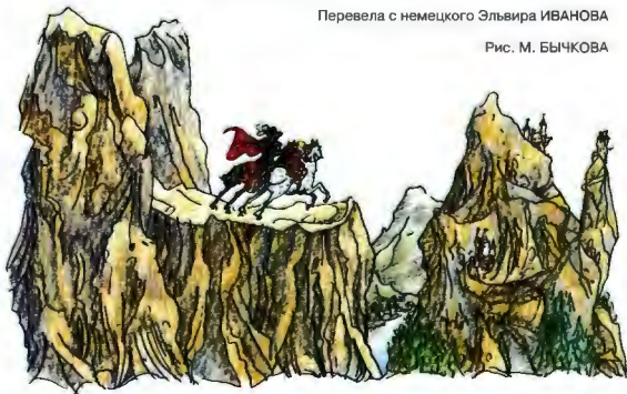
Рис. М. БЫЧКОВА