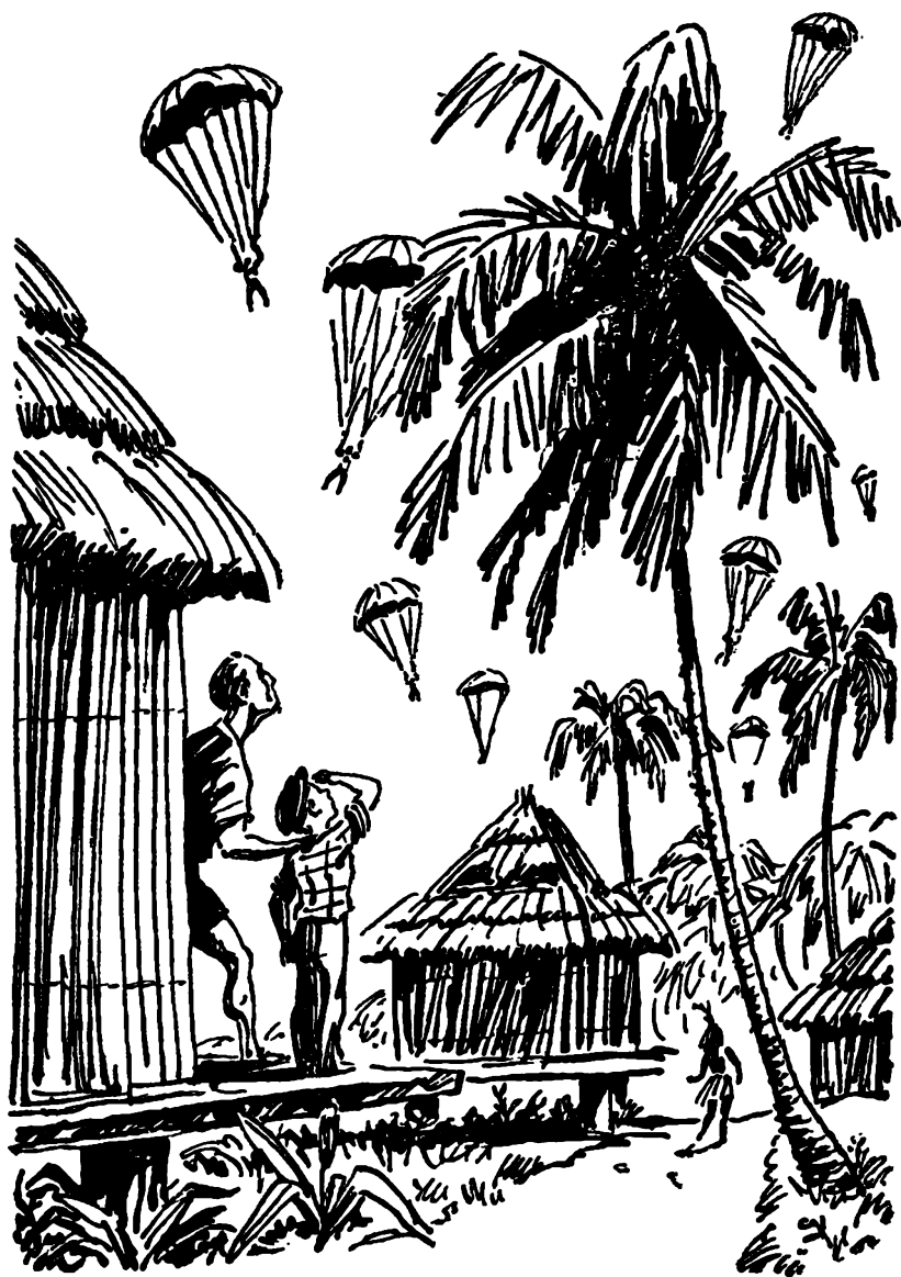
Противник высаживал воздушный десант.