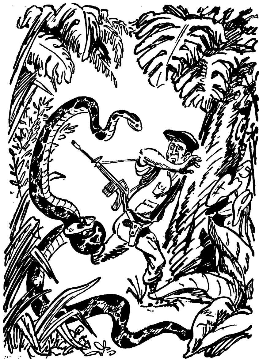
Человек отчаянно боролся с огромной змеей.