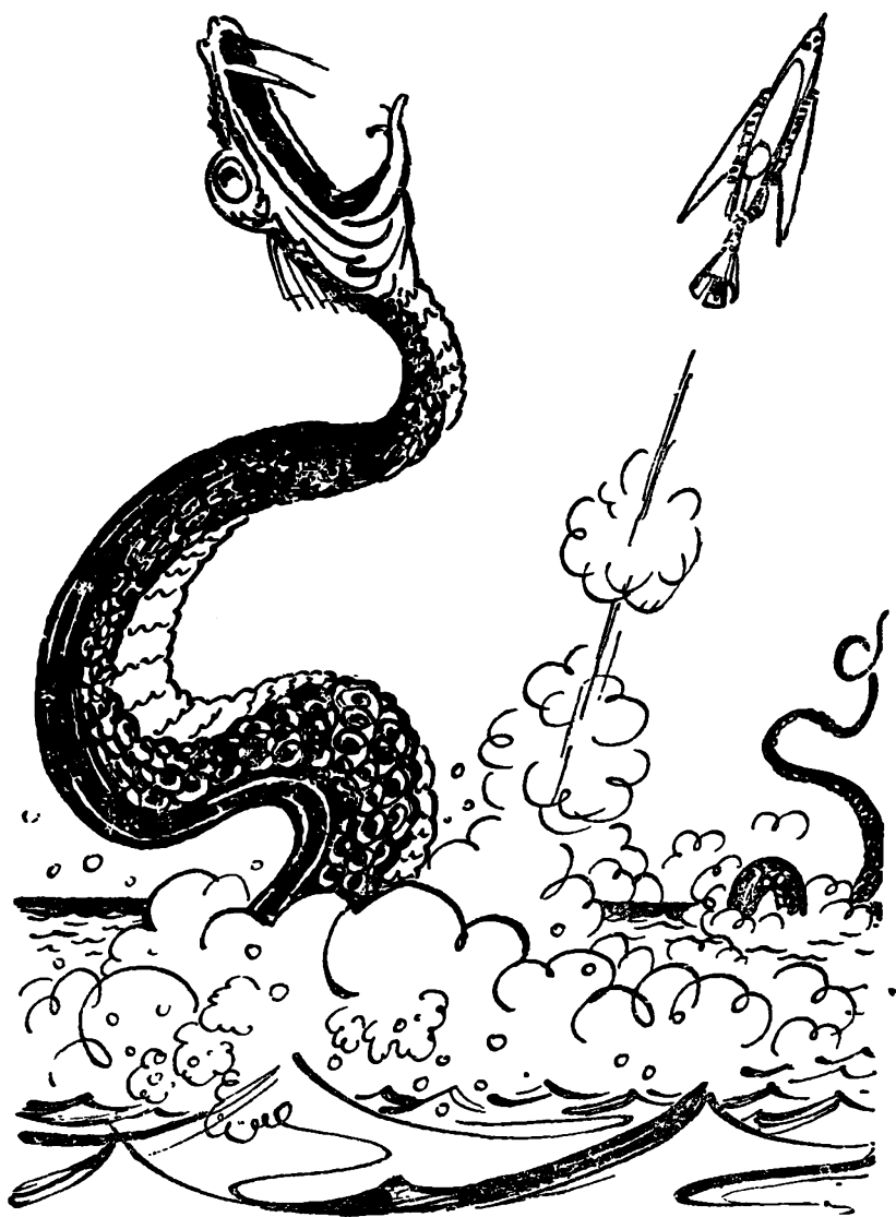
Машина, подхваченная могучим потоком, как пробка, взлетела высоко над Землей.