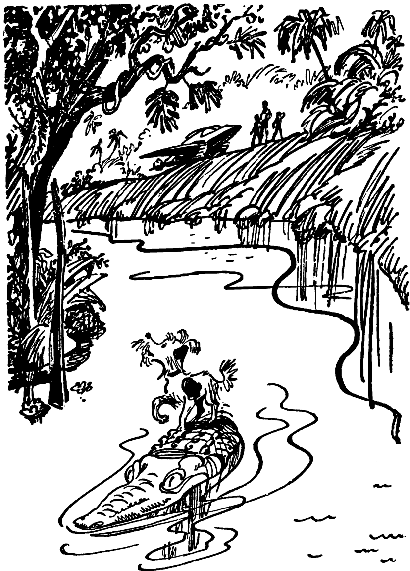
Необыкновенная команда отчалила от берега.