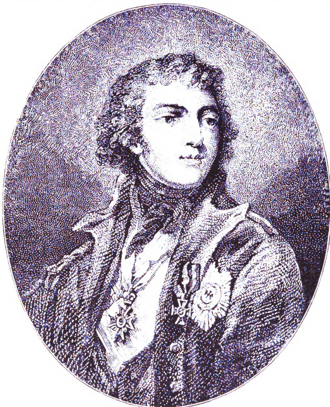
Графъ Валеріанъ Александровичъ ЗУБОВЪ.