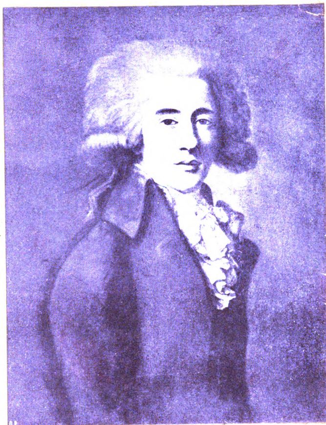
Графъ Никита Петровичъ ПАНИНЪ.