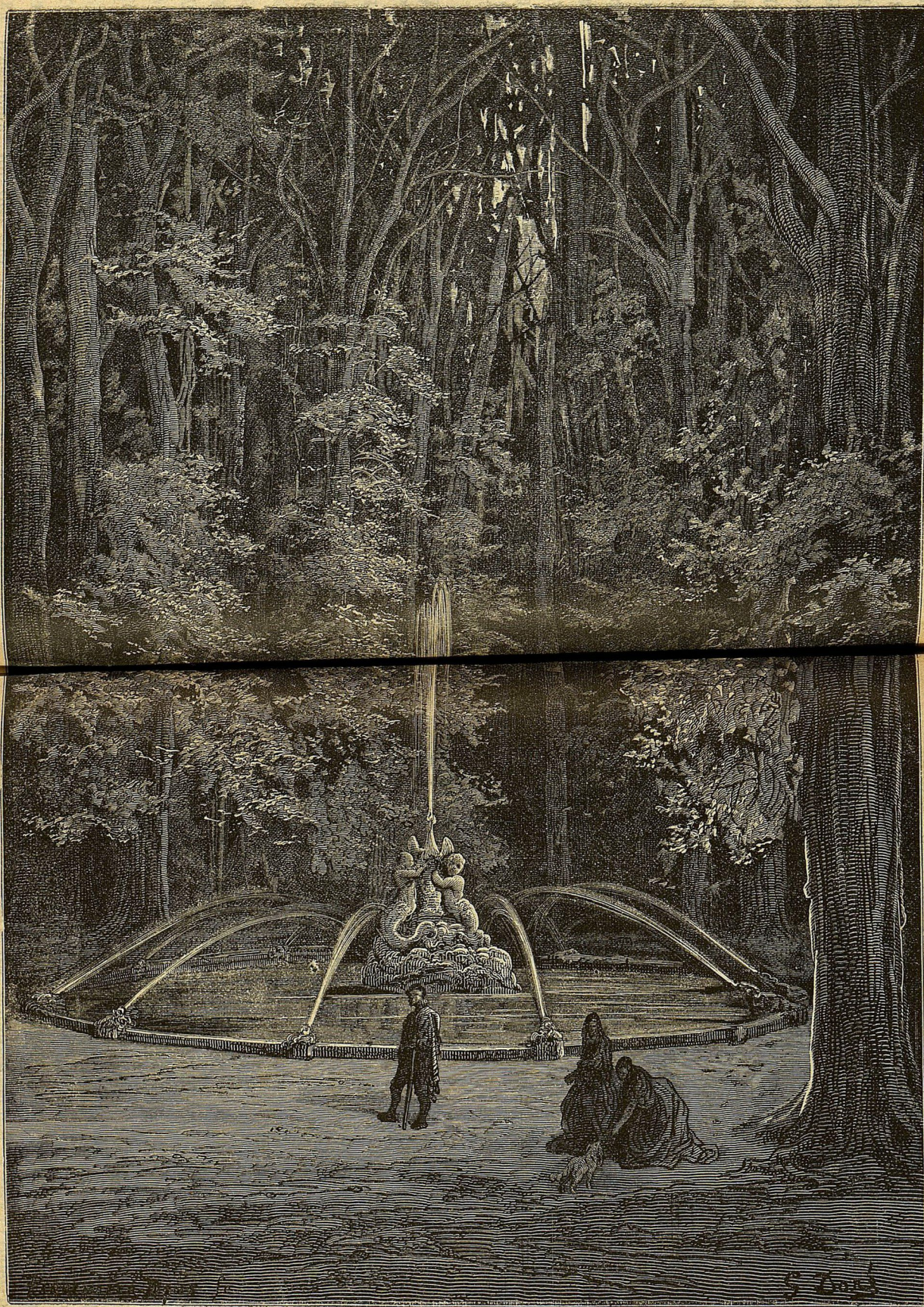
ФОНТАНЪ ВЪ САДУ.