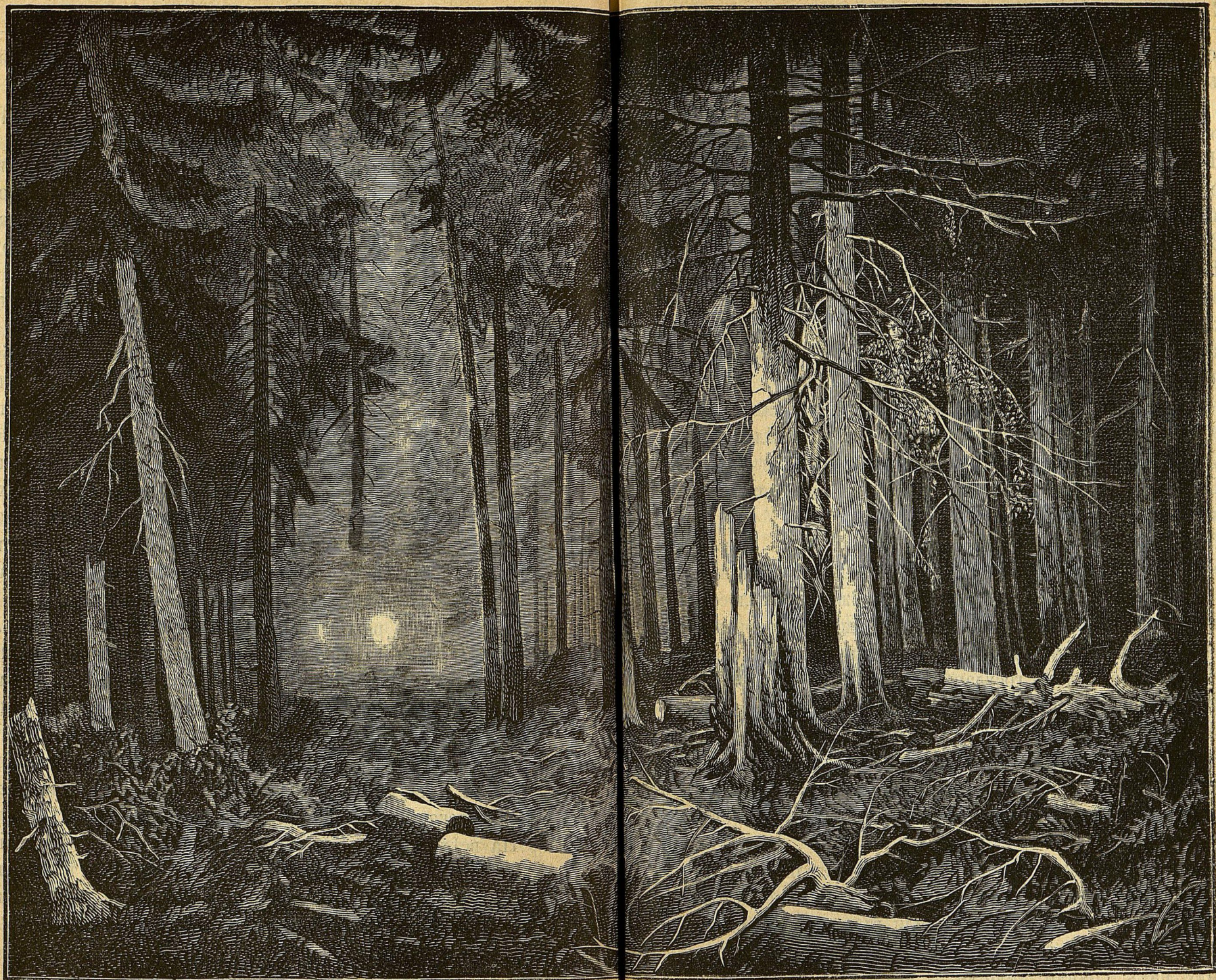
ЛѢСЪ ПРИ ЗАКАТѢ СОЛНЦА. Академика А. И. Мещерскаго.