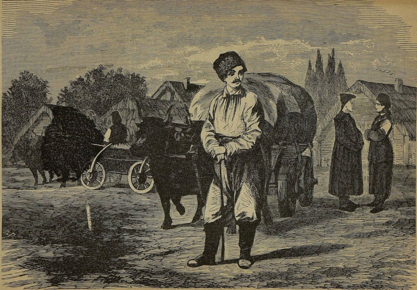
МАЛОРОССЪ ВОРОНЕЖСКОЙ ГУБЕРНИИ.