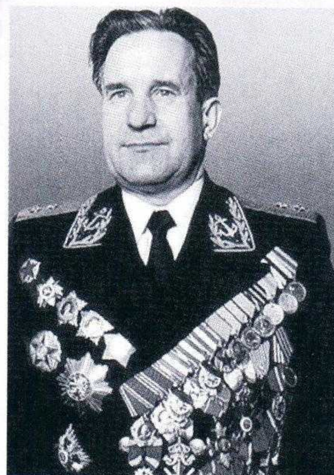
◀ Вице-адмирал Георгий Никитич Холостяков – человек уникальной судьбы. Он был главным организатором и вдохновителем героической обороны Севастополя; высаживал десанты на Малую землю; водил в первый 50-суточный поход уникальную атомную лодку с реактором на жидком металле АПЛ К-27. Смерть Холостякова от рук грабителей стала потрясением для всей страны

Г. Н. Холостяков родился в семье железнодорожного машиниста. По национальности белорус. С августа 1919 года принимал участие в Гражданской войне, воевал в частях ЧОН на Западном фронте. Член РКП(б) с 1920 года. Во время советско-польской войны в 1920 году политрук стрелковой роты Холостяков был ранен и попал в плен, где пробыл почти год. После возвращения из плена работал на различных