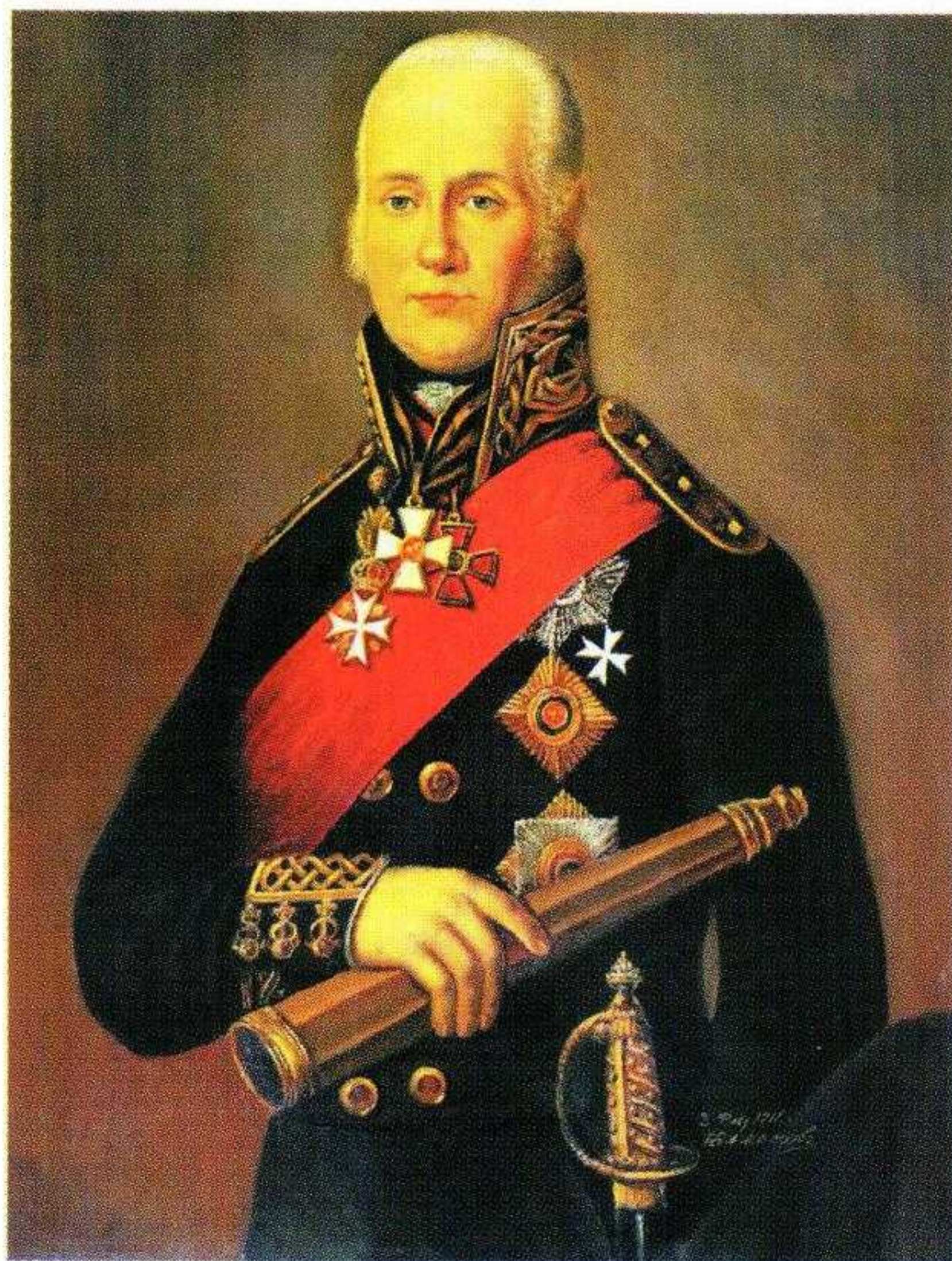
▲ Федор Федорович Ушаков — русский флотоводец, адмирал, командующий Черноморским флотом и герой многих сражений эпохи Русско-турецких войн. В 2001 году Русской православной церковью причислен к лику святых как праведный воин Федор Ушаков

Специальная комиссия во главе с заместителем наркома обороны, начальником Главного политического управления Красной Армии генерал-полковником Щербаковым решила, что ордена Ушакова и Нахимова будут подразделяться на две степени, а высшим флотоводческим орденом должен стать орден Ушакова. Она же предложила учредить медали с именами флотоводцев, в дальнейшем предписывалось медаль Ушакова носить перед медалью Нахимова.