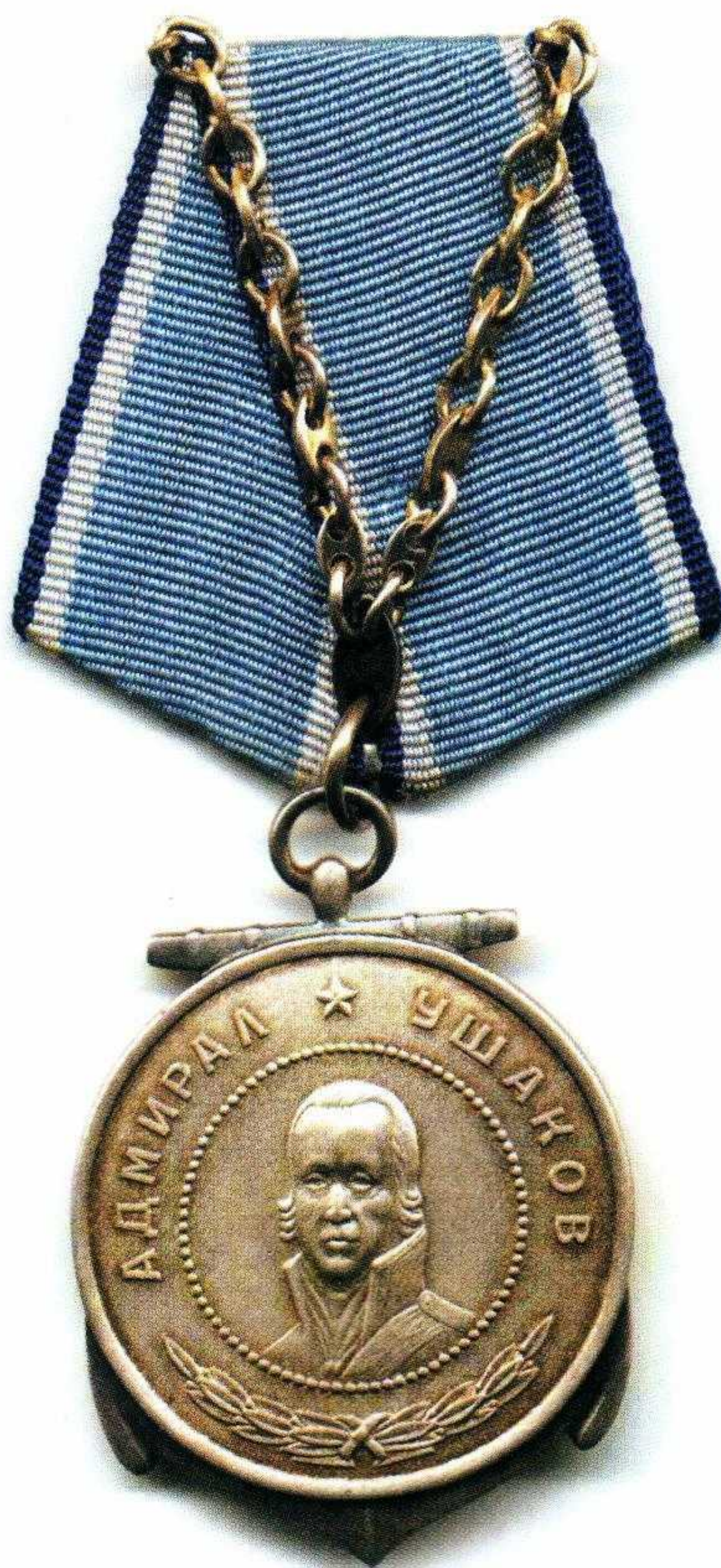
▲ Медаль Ушакова