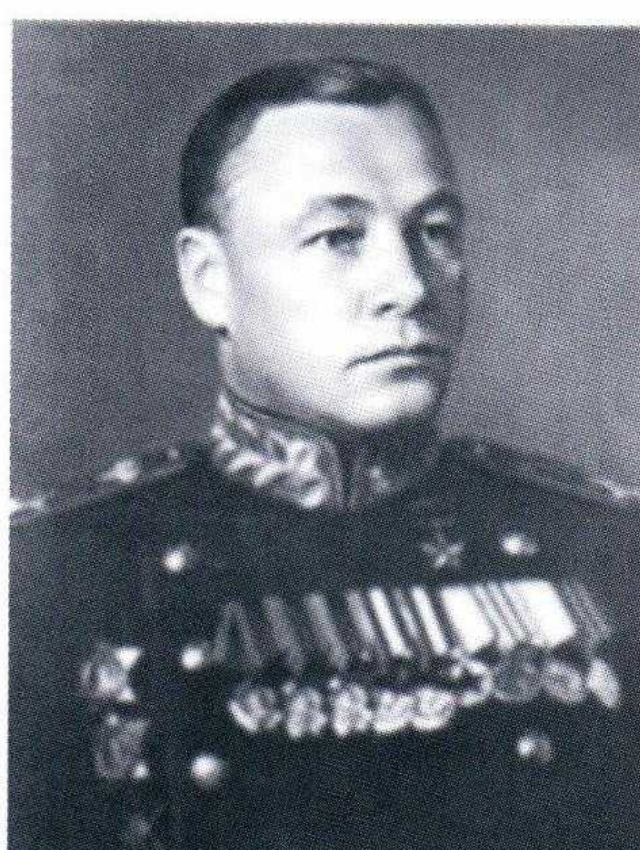
▲ Нарком ВМФ в войну, адмирал Николай Герасимович Кузнецов пережил две опалы: в 1948 году его понизили в звании и отправили на Тихий океан за то, что он якобы передавал секретные военные разработки англичанам и американцам. После смерти Сталина все обвинения сняли. Но в 1955 году враждовавший с Кузнецовым Жуков обвинил адмирала во взрыве линкора «Новороссийск» и – теперь уже до самой смерти – Кузнецов был лишен возможности служить на флоте. Доброе имя адмирала было восстановлено только в 1988 г.