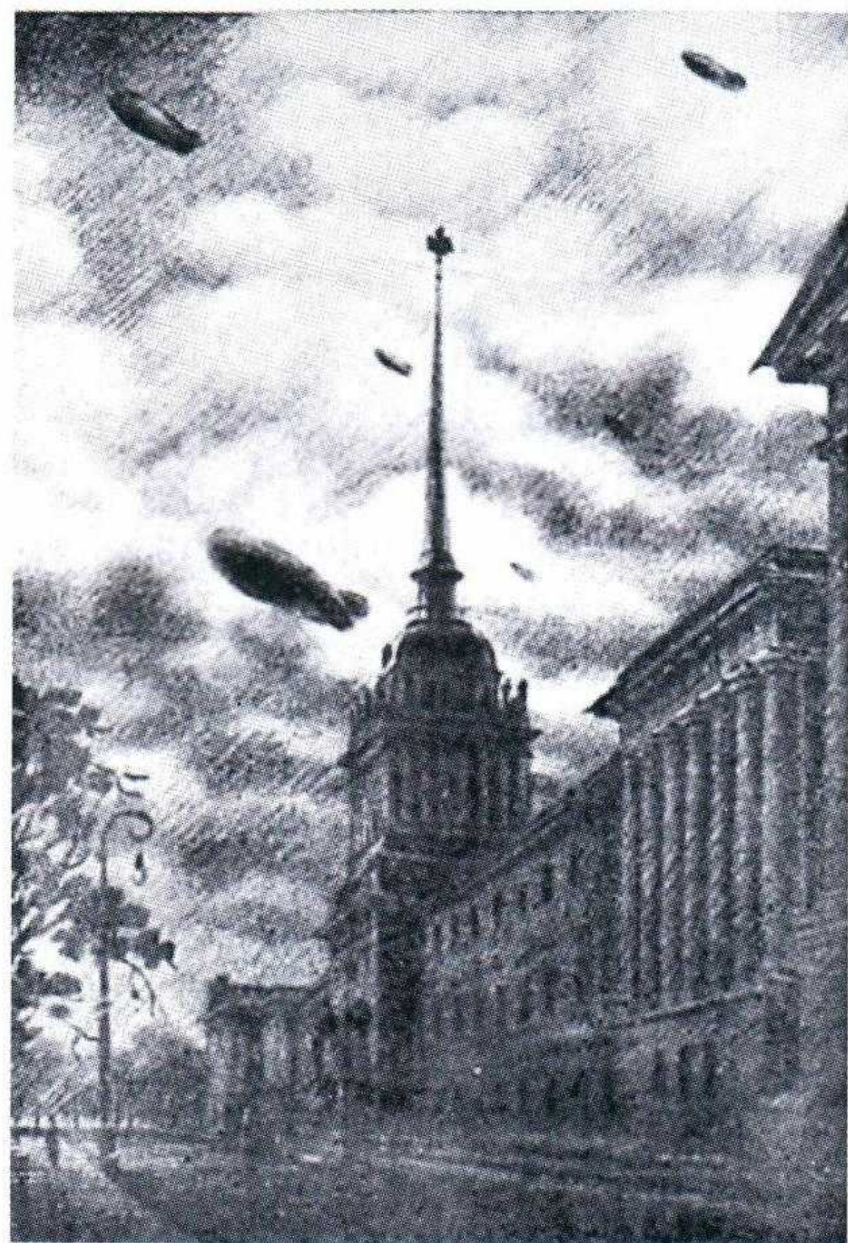
▲ Все военные годы Шепиловский работал над графическим циклом литографий, посвященных героической обороне Ленинграда. В 1943–1944 годах они были отпечатаны на почтовых открытках

Указ Президиума Верховного Совета СССР об учреждении орденов Ушакова и Нахимова, а также медалей их имени вышел 3 марта 1944 года.