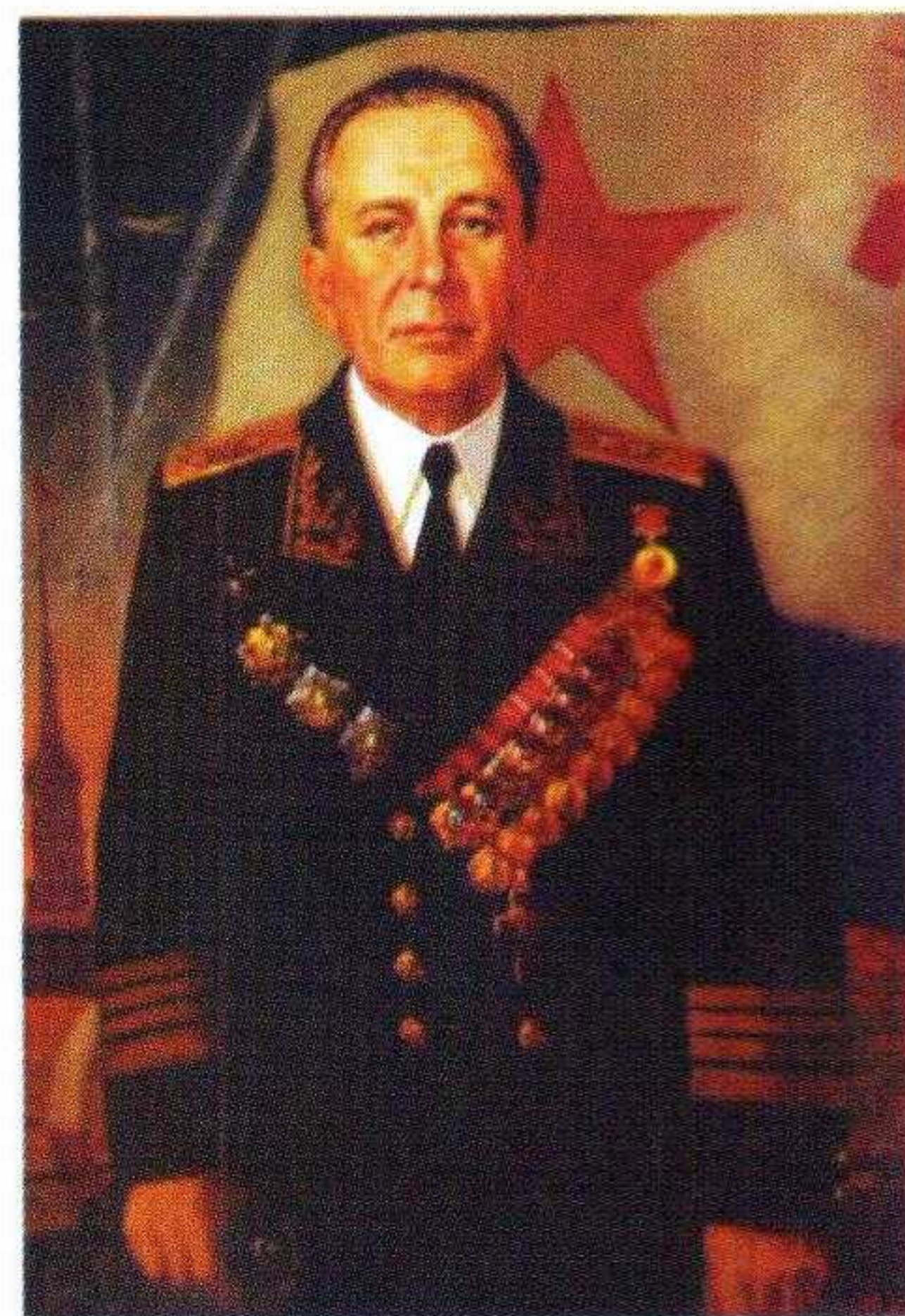
▲ Владимир Филиппович Трибуц – советский военный деятель, адмирал, доктор исторических наук, командующий Балтийским флотом в 1939-1947 годах

Всего за годы войны орденом Ушакова I степени было награждено 22 человека, из них 8 человек дважды: Кузнецов, Исаков, Октябрьский, Трибуц, а также заместители наркома ВМФ адмиралы Галлер и Левченко,