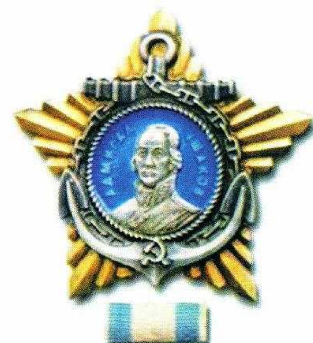
▲ Орден Ушакова II степени