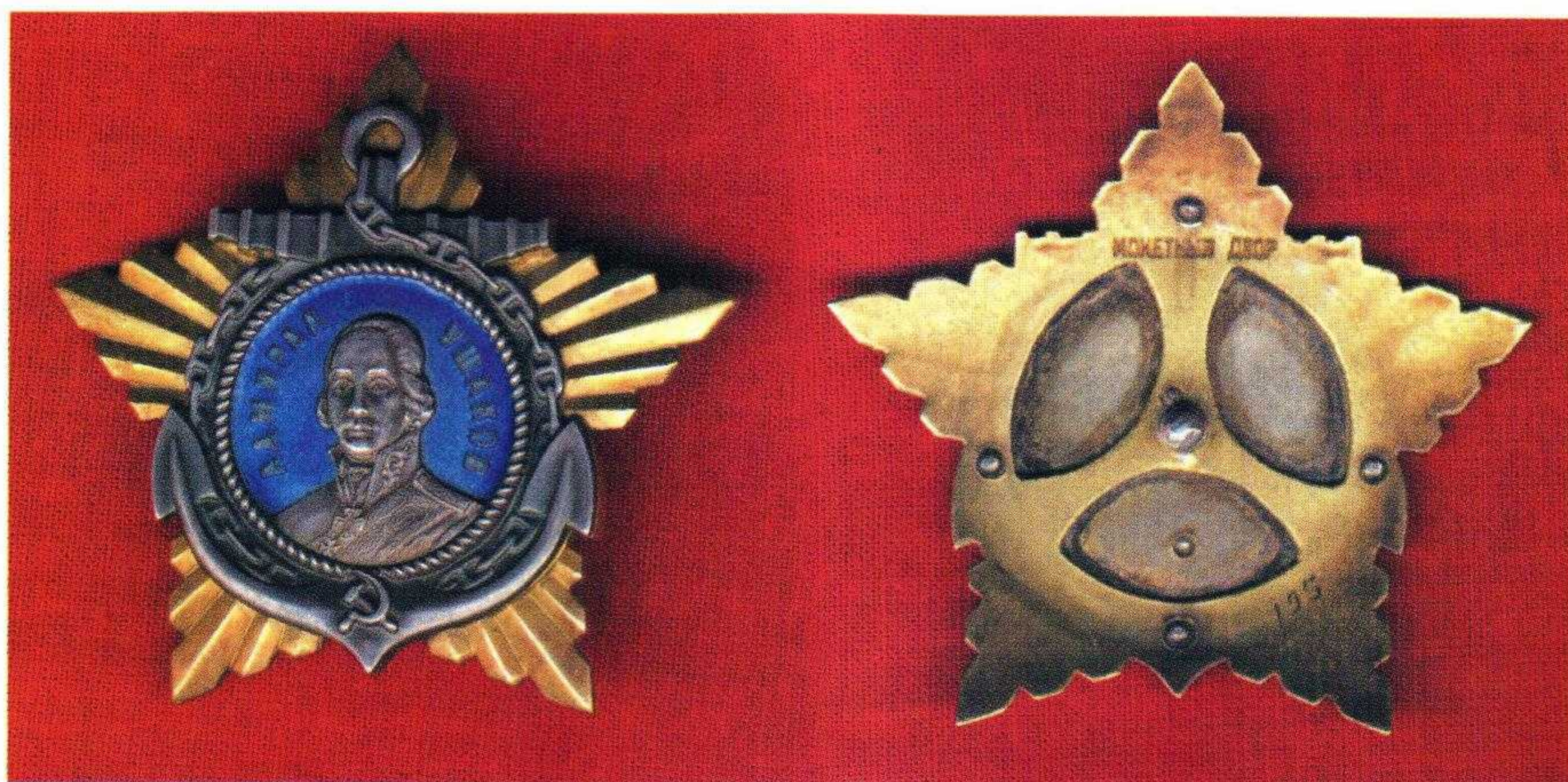
▲ Орден Ушакова II степени, ГИМ

Орден Ушакова I и II степени носится на правой стороне груди после ордена Суворова соответствующих степеней, как и орденские планки.