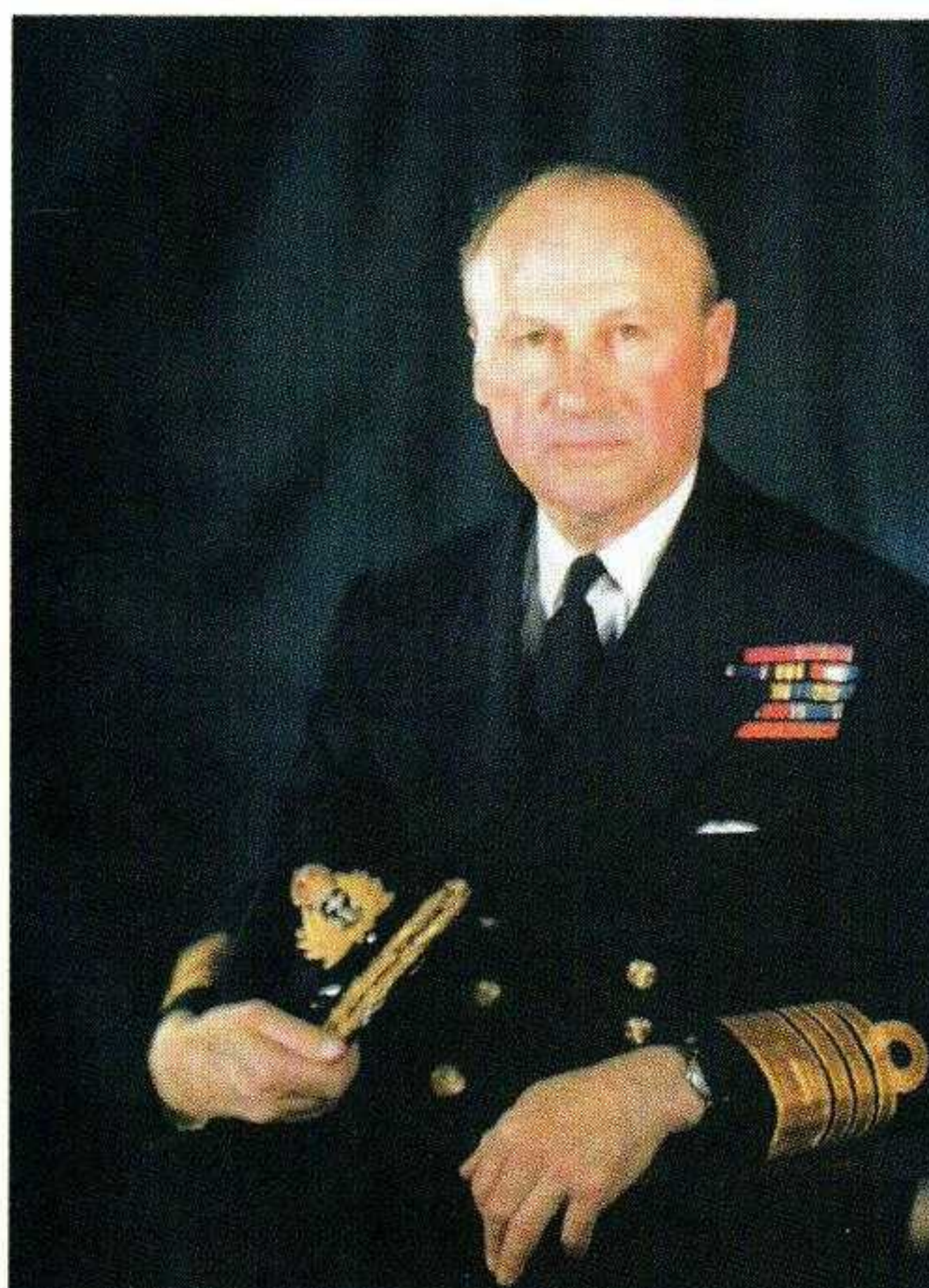
▲ Эйзенхауэр писал о флотоводце: «Рамсей был знающим командиром — мужественным, изобретательным, обладающим неисчерпаемым запасом энергии. Более того, все мы знали его как полезного и общительного человека, хотя иногда смеялись между собой над его педантичностью, с какой он соблюдал традиции английского военно-морского флота как главного вида вооруженных сил»

В январе 1943 года Рамсею досталась непростая задача – скоординировать действия 5 британских соединений, которые выходили из портов Среднего Востока, с Мальты и даже прямо из Англии. Следовало доставить, высадить и обеспечить всем необходимым 115 тысяч английских солдат. В ходе операции «Хаски»