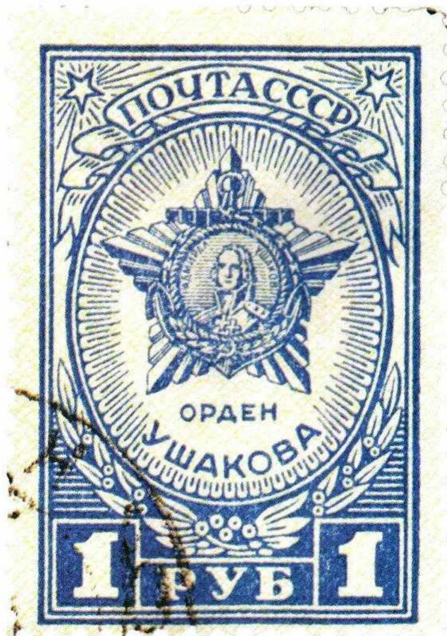
▲ Почтовая марка СССР с изображением ордена Ушакова, 1945 г.