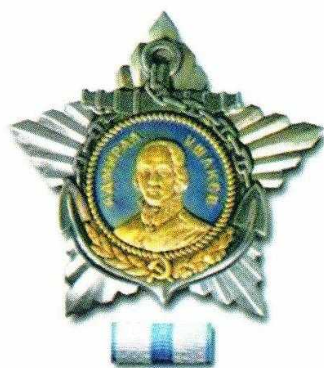
▲ Орден Ушакова I степени