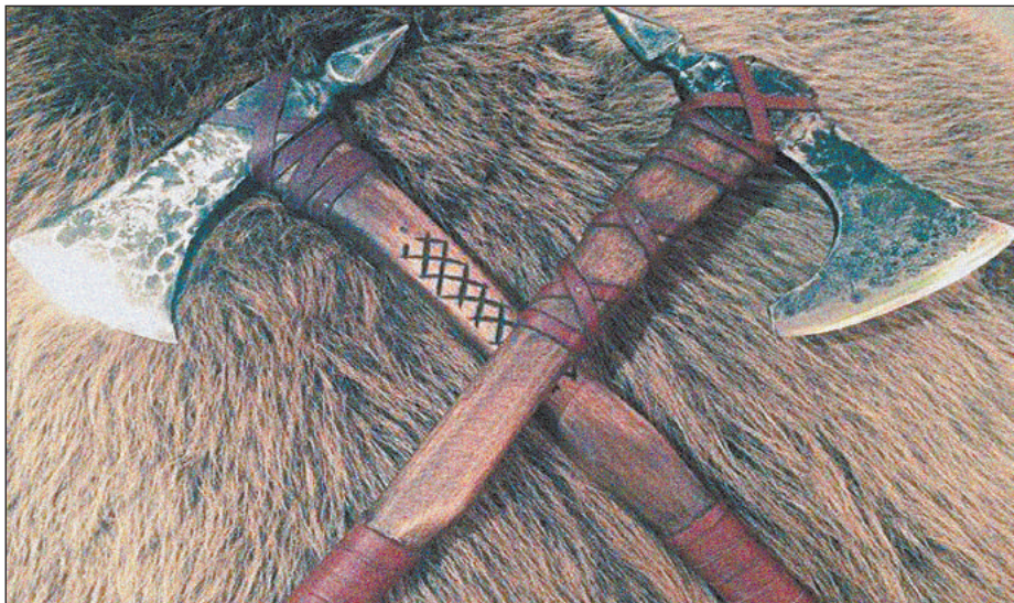
ТОМАГАВКИ ИЗ АБОРДАЖНЫХ ТОПОРОВ

А вот для этого он годился слабо, и потому инструмент начал быстро эволюционировать в сторону