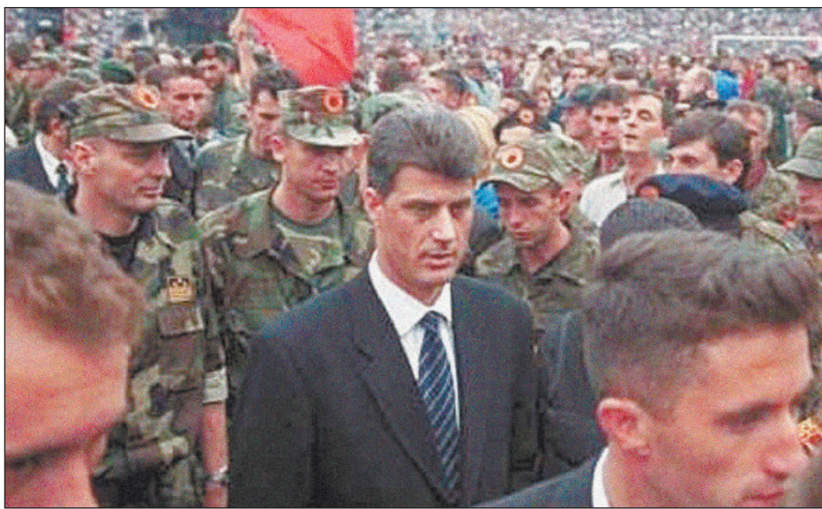
БОЕВИКИ ИСК В ПРИШТИНЕ С ХАШИМОМ ТАЧИ И АГИМОМ ЧЕКУ

Сопутствующие этому процессу проблемы, в том числе Косовская, по большому счету никого на Западе не волнуют. В самом деле, кому в Вашингтоне или Лондоне, в Париже или Берлине интересна судьба каких-то сербов или цыган, пострадавших или продолжающих страдать в результате геноцида со стороны албанских боевиков? Пусть там все само собой как-нибудь побыстрее рассосется и уляжется, – полага-