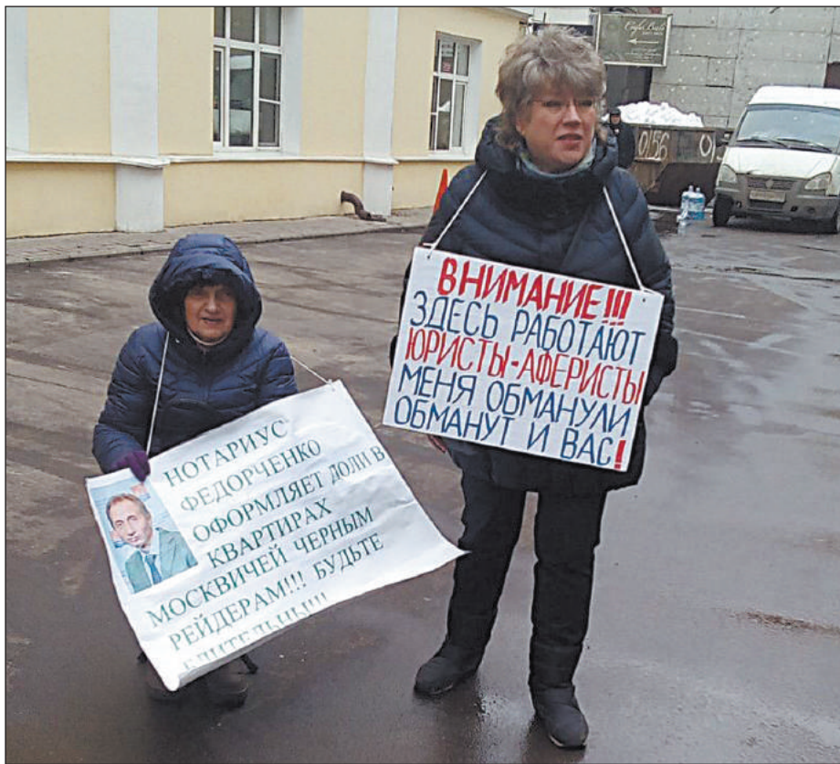
МИТИНГУЮЩИЕ ВЕЛИ СЕБЯ СПОКОЙНО: НЕ ТРЕБОВАЛИ НАЗАД СВОИ ДЕНЬГИ. ЗАТО СОДЕРЖАНИЕ ИХ ПЛАКАТОВ ГОВОРИЛО САМО ЗА СЕБЯ

– Как вы можете прокомментировать свою позицию газете «Совершенно секретно»? (подключается к разговору автор газеты).