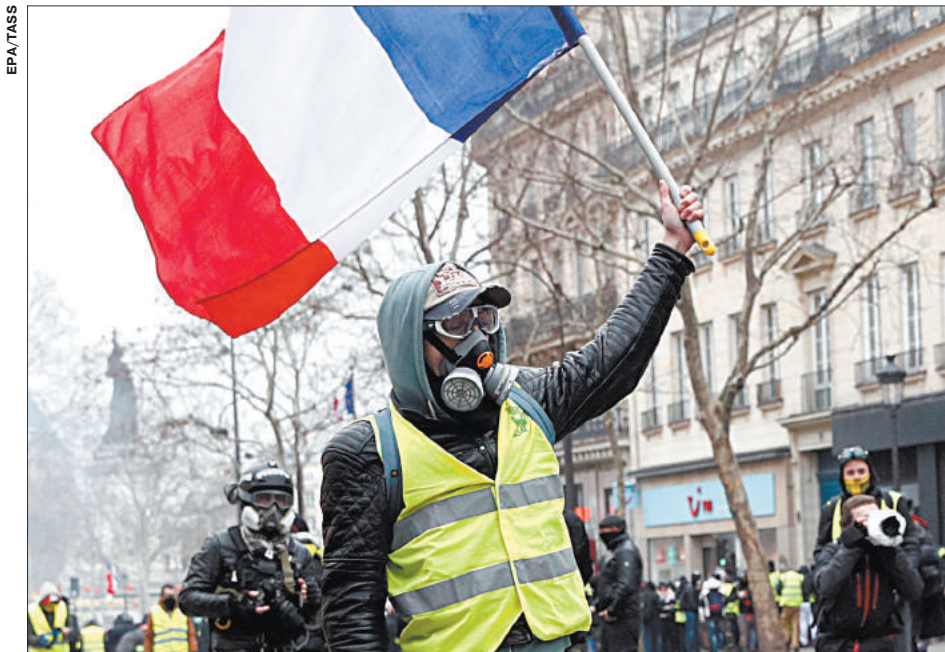
В ПАРИЖЕ БОЛЕЕ 10 ТЫС. ЧЕЛОВЕК ВЫШЛИ НА АКЦИЮ «ЖЕЛТЫХ ЖИЛЕТОВ» ПРОТИВ ПОЛИЦЕЙСКОГО ПРОИЗВОЛА

Итак, вопрос, ехать или не ехать в Париж, закрыт – конечно же, ехать и не бояться ни «желтых жилетов», ни прочих напастей, а просто насладиться городом, прокатиться на кораблике по Сене, потеряться и найтись в дебрях Латинского квартала, пойти в Лувр, наконец, или в Музей д'Орсе – путеводителей и советов, как провести время в Париже, не счесть. Ну а мы провели для вас расследование, чтобы резюмировать – в Париже спокойно и безопасно, так что – Bienvenue à Paris!