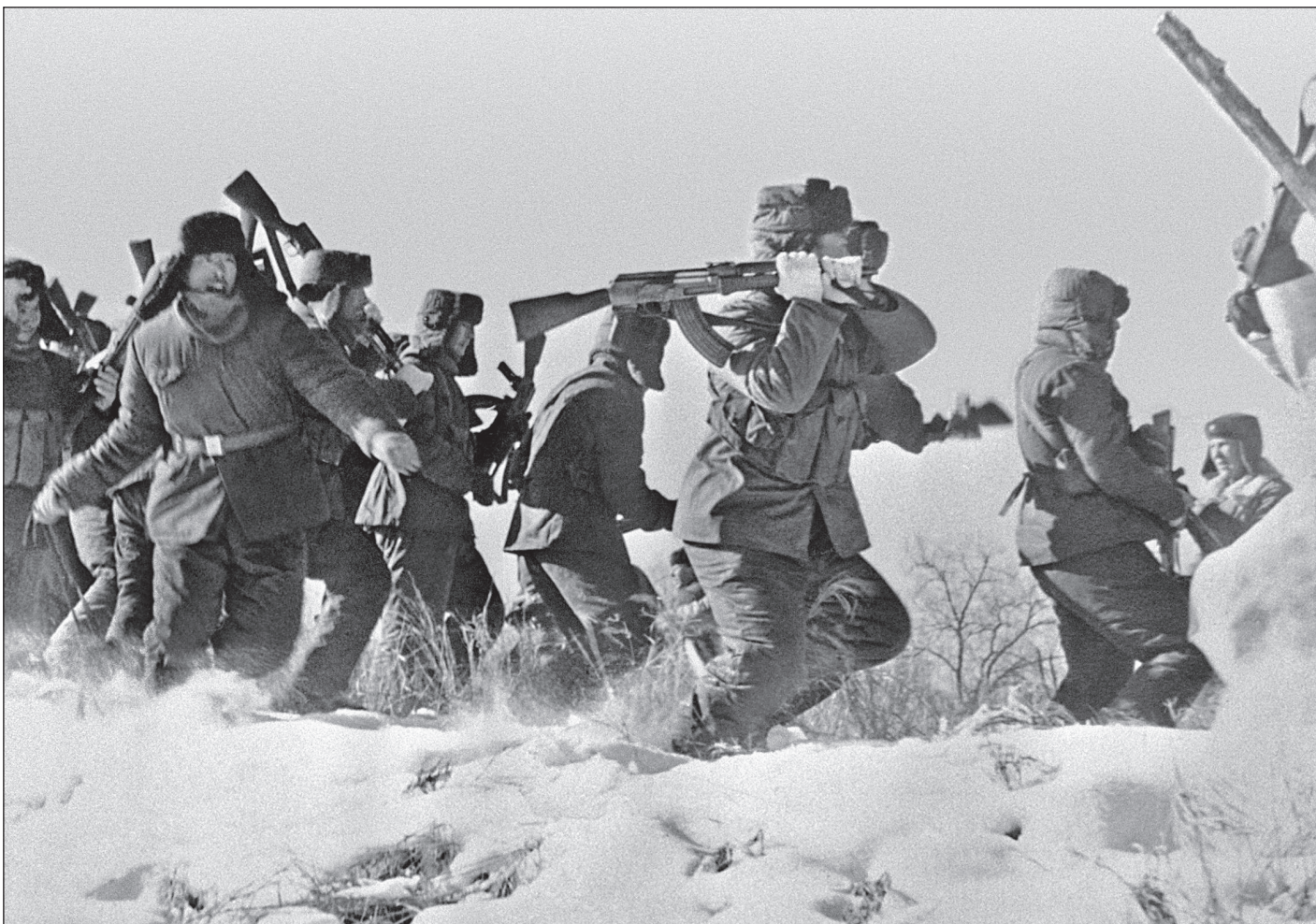
ТАК ОБЫЧНО ВЫГЛЯДЕЛИ РУКОПАШНЫЕ СХВАТКИ СОВЕТСКИХ ПОГРАНИЧНИКОВ С КИТАЙСКИМИ ПРОВОКАТОРАМИ ДО БОЕВ НА ОСТРОВЕ ДАМАНСКОМ