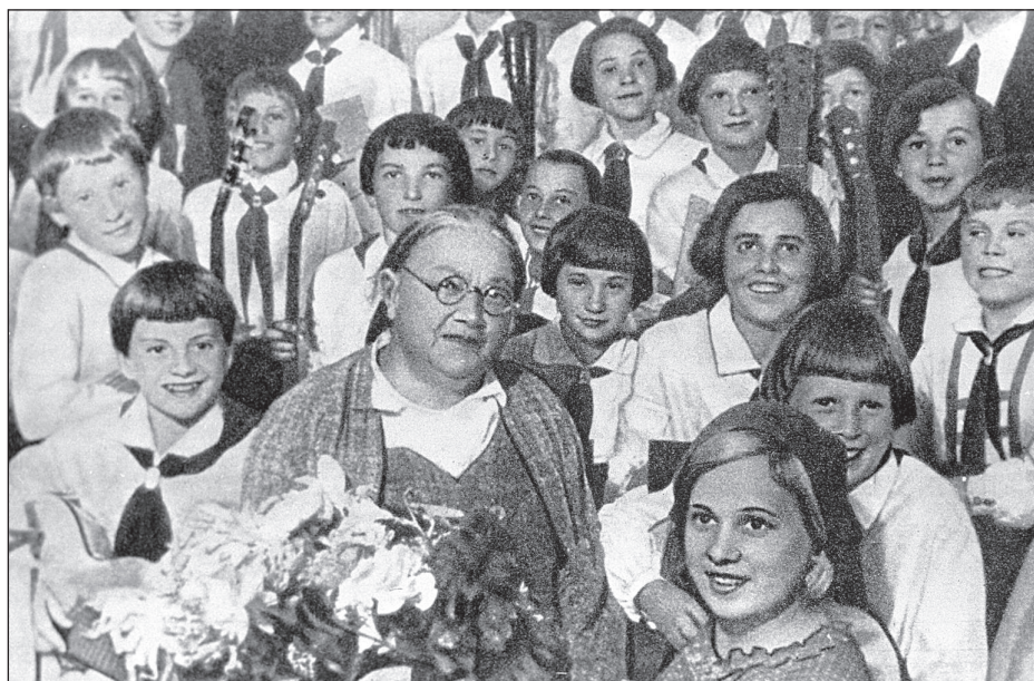
Н.К. КРУПСКАЯ СРЕДИ ПИОНЕРОВ

В заключение подчеркнем, что все ключевые проблемы, находящиеся в фокусе развития педагогики, нашли отражение в педагогическом наследии Крупской. Предлагаемый ею методический инструментарий определялся методологическими принципами, которые она исповедовала и которые формировались в русле лево-марксистского направления общественной мысли. Многие из этих инструментов, но уже во взаимосвязи с иными общественными платформами, вновь позиционируются сегодня в качестве передовых. Не обратившись в данном случае к не такому уж и далекому прошлому, показав, что эти методы в известной степени уже апробировались на практике с разной степенью успешности, означало бы растраниживание исторического опыта страны.