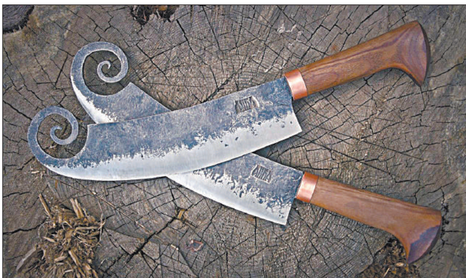
ПАРНЫЕ ГАБАЛИНСКИЕ НОЖИ-ТОПОРИКИ ГЕЙМЯКЕШ

Оружие, которое всегда под рукой, должно было иметь сравнительно небольшие размеры или же попросту не казаться оружием. При этом оно должно быть достаточно эффективным во внезапном ближнем бою. На большой дороге трубить в рог и подавать сигналы к атаке было не приня-