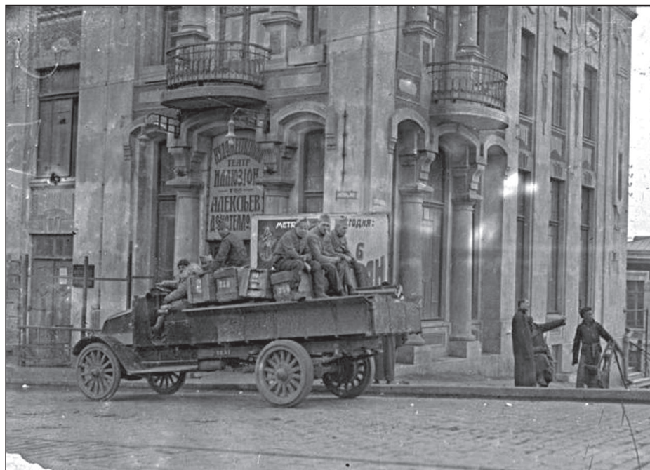
ФРАНЦУЗСКИЕ СОЛДАТЫ ВО ВЛАДИВОСТОКЕ, МАРТ 1919