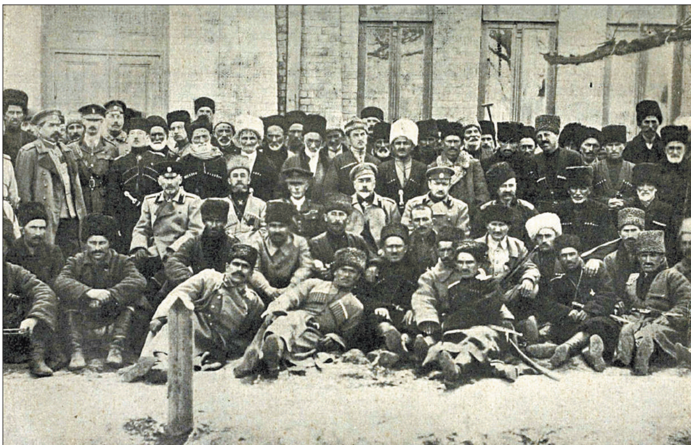
ГЕНЕРАЛ ДЕНИКИН С ВОЕННОНАЧАЛЬНИКАМИ В ЧЕЧНЕ. МАРТ 1919

За добро часто немедленно получают наказание, а награда настоящая, верная награда обещается в той жизни. Злое дело вознаграждает немедленно, а наказа-