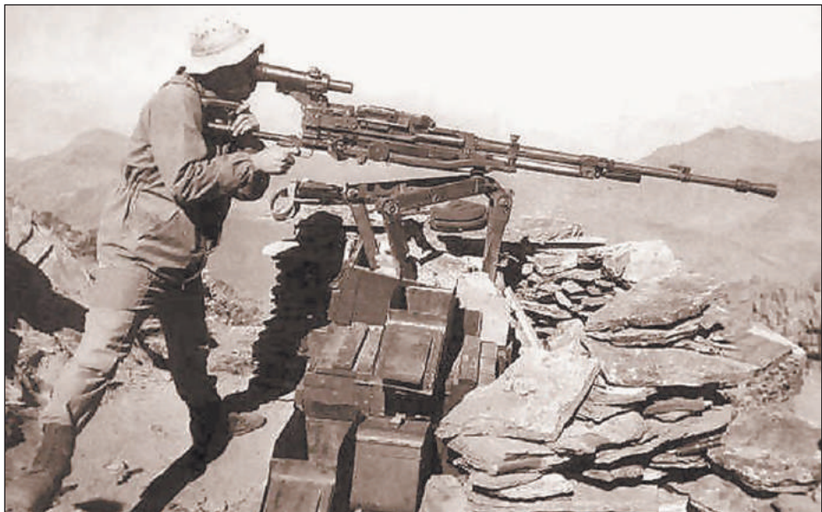
ПУЛЕМЕТЧИК С КРУПНОКАЛИБЕРНЫМ ПУЛЕМОТОМ «УТЕС» НА Боевом дежурстве