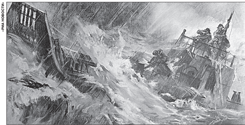
РЕПРОДУКЦИЯ РИСУНКА «В ШТОРМОВОМ ОКЕАНЕ» РАБОТЫ ХУДОЖНИКОВ ГОРПЕНКО И ДЕНИСОВА (ИЗ АЛЬБОМА ЛИТОГРАФИЙ, ПОСВЯЩЕННОГО ПОДВИГУ ЧЕТЫРЕХ СОВЕТСКИХ ВОИНОВ)

Первым делом провели «инвентаризацию»: в наличии оказались буханка хлеба, немного гороха и пшена, две банки тушенки, банка с жиром и ведро или два перемазанной мазутом картошки. Еще пара пачек «Беломора» и три коробка спичек. Пятилитровый бачок с питьевой водой во время шторма разбился, пришлось пить ржавую техническую – для охлаждения дизелей. Поначалу каждый получал по кружке супа, который варили