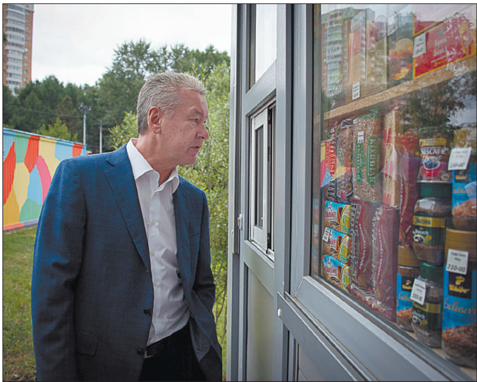
МЭР МОСКВЫ С.СОБЯНИН ОСМАТРИВАЕТ ВИТРИНУ ПРОДУКТОВОГО ЛАРЬКА

Тем не менее, считает он, если бы удалось легализовать мобильные павильоны значимой площади, например, от 40 кв. м, и добавить к ним торговлю «на колесах», то это бы значительно помогло покупателям. «Площадь от 40 кв. м даст хоть какую-то экономику процесса, такие точки можно подключать к городским ма-