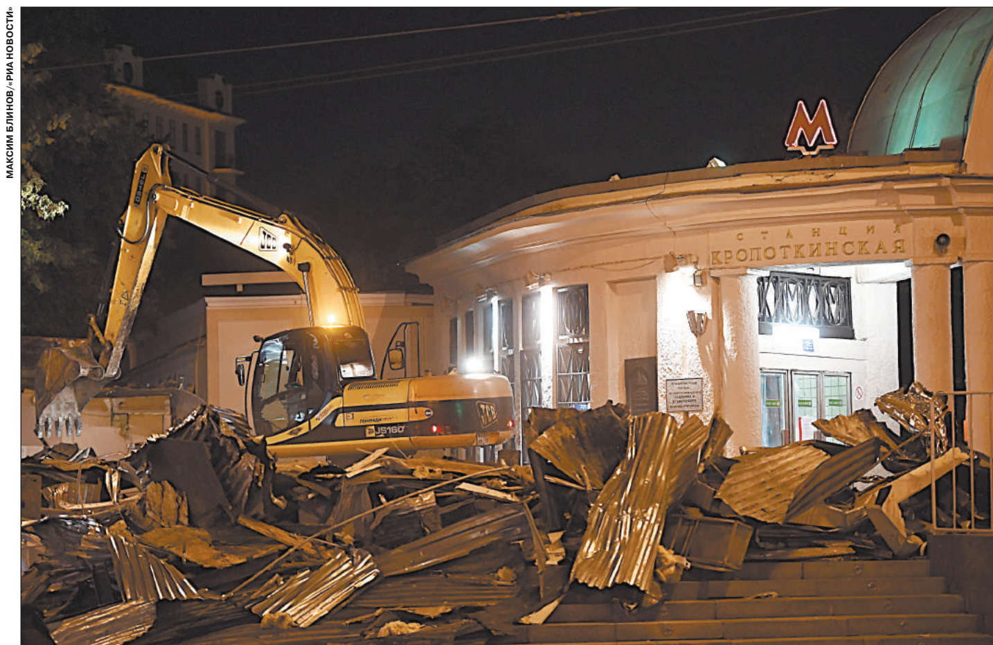
«НОЧЬ ДЛИННЫХ КОВШЕЙ» В МОСКВЕ. 2016

Впоследствии замена ларьков и павильонов на «более лучшие» стала обычной – ларьки сносились и ставились новые, их убрали из подземных переходов, отодвигали от входов на станции метро «на безопасное расстояние», придумывали другие новации. Иногда удачные – к примеру, когда обязали ставить пункт охраны, иногда не очень – так, совмещение автобусных остановок с ларьками привело к тому, что на скамейках зачастую «отдыхали» не ожидающие автобуса, а перебравшие покупатели ларьков.