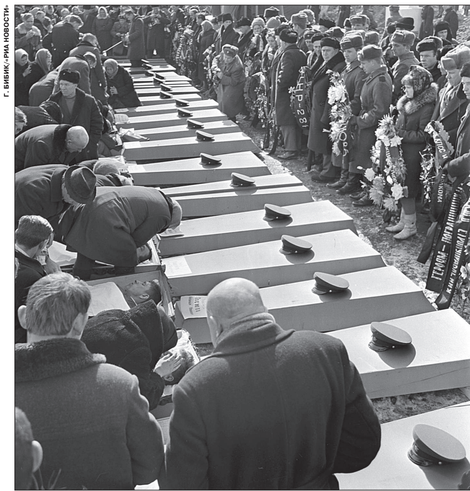
ПОХОРОНЫ ПОГРАНИЧНИКОВ, ПОГИБШИХ ВО ВРЕМЯ БОЕВ НА О. ДАМАНСКИЙ

Нередко полагают, что в основе того конфликта лежали территориальные претензии КНР: Пе-