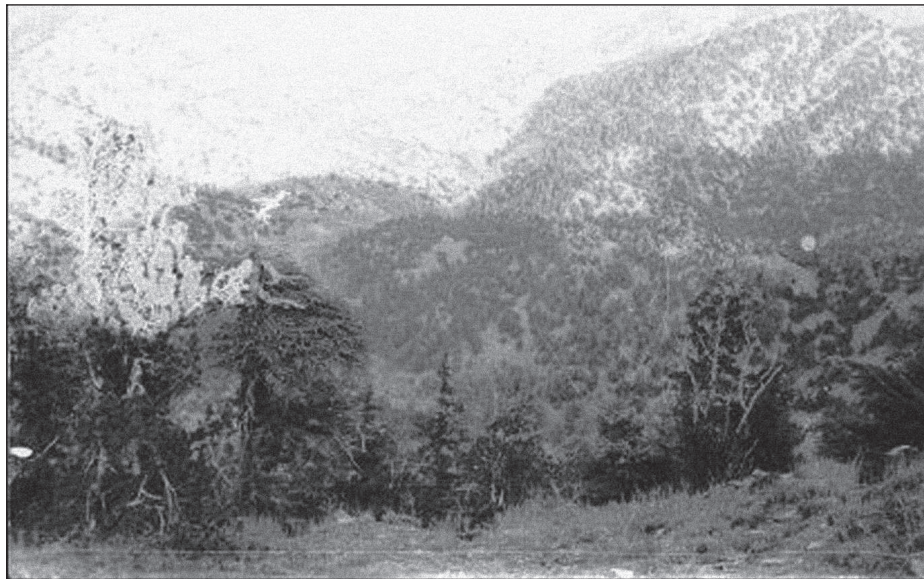
ВЫСОТА 3234 (ВИД НА СЕВЕР)

В 19.10 душманы полезли снова. Кроме обычных моджахедов на высоту карабкались бойцы элитного подразделения моджахедов «Черные аисты» и пакистанские коммандос из полка «Чехатвал». В состав «аистов» набирались физические крепкие, получившие отличную боевую подготовку, радикальные исламские фундаменталисты со всего мира. Свое название они получили за характерную черную форму, делавшую их практически невидимыми в ночном бою. В спецподразделении «Чехатвал» тоже входили отнюдь не новички в своем деле. Оно специализировалось на глубоких рейдах на территорию противника и использовании там, где официальное применение войсковых подразделений «нецелесообразно». Против них стояли бойцы-срочники, но они были настоящими десантниками.