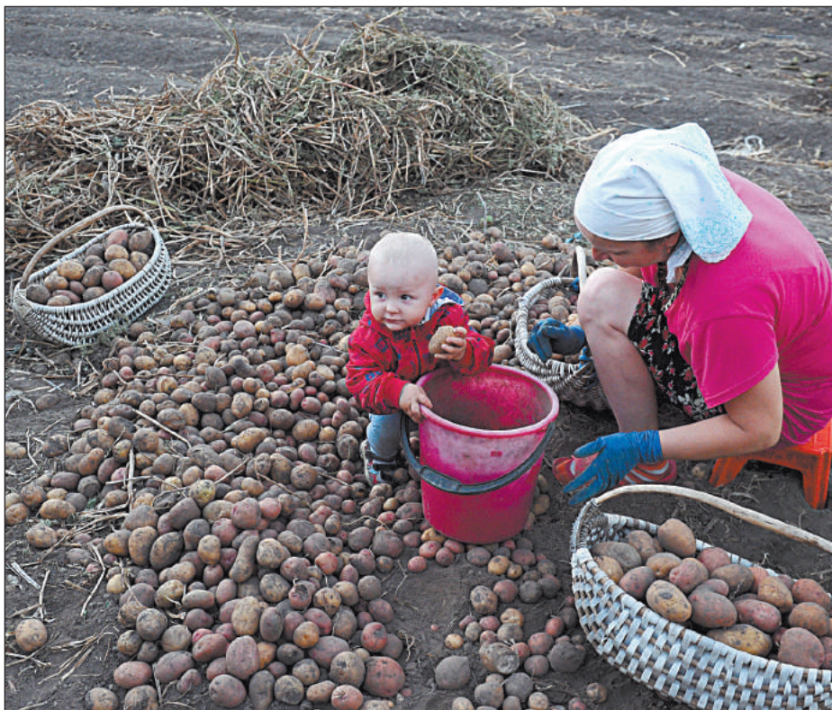
СУТЬ ПОБОРОВ С ОГОРОДА СВОДИТСЯ К ТОМУ, ЧТОБЫ ОБЯЗАТЬ ДАЧНИКА ИЛИ СЕЛЬСКОГО ЖИТЕЛЯ, КОТОРЫЙ ЗАХОЧЕТ НЕМНОГО ПОДЗАРАБОТАТЬ К ПЕНСИИ, ПРОДАВ ПАРУ ВЕДЕР КАРТОШКИ, ПРИОБРЕСТИ ПАТЕНТ НА ТОРГОВЛЮ ПЛОДАМИ СВОЕГО ТРУДА

Новый закон уничтожает институт уполномоченных представителей, что, по мнению не только нашей собеседницы, но и ее многочисленных коллег, блокирует любое реше-