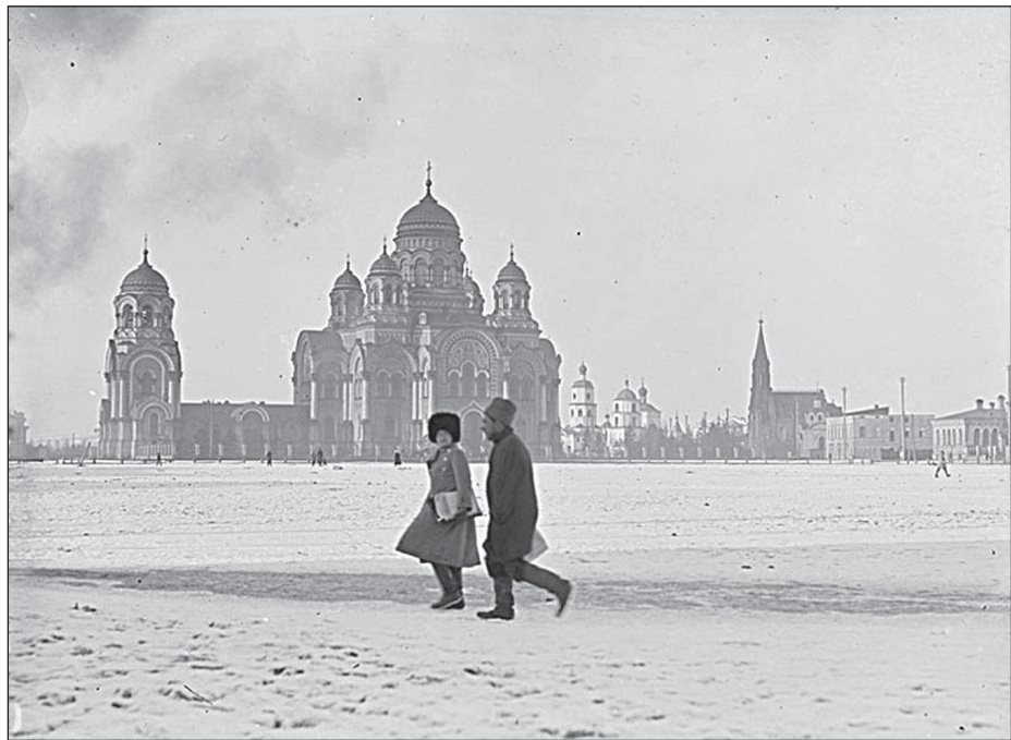
ИРКУТСК. ТИХВИНСКАЯ ПЛОЩАДЬ И КАФЕДРАЛЬНЫЙ СОБОР. МАРТ 1919