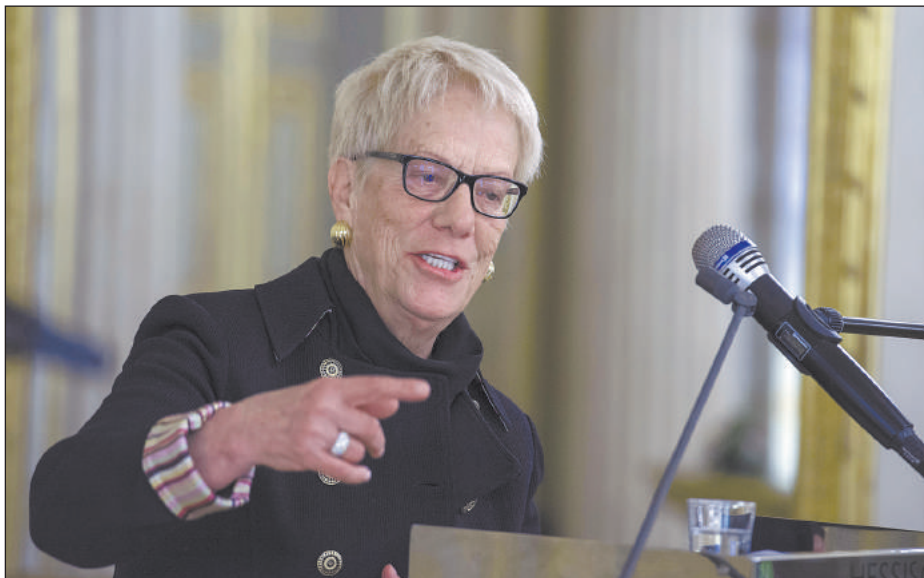
ПРОКУРОР МЕЖДУНАРОДНОГО ТРИБУНАЛА ПО ЮГОСЛАВИИ КАРЛА ДЕЛЬ ПОНТЕ

– Вам доводилось лично встречаться с Хашимом Тачи?