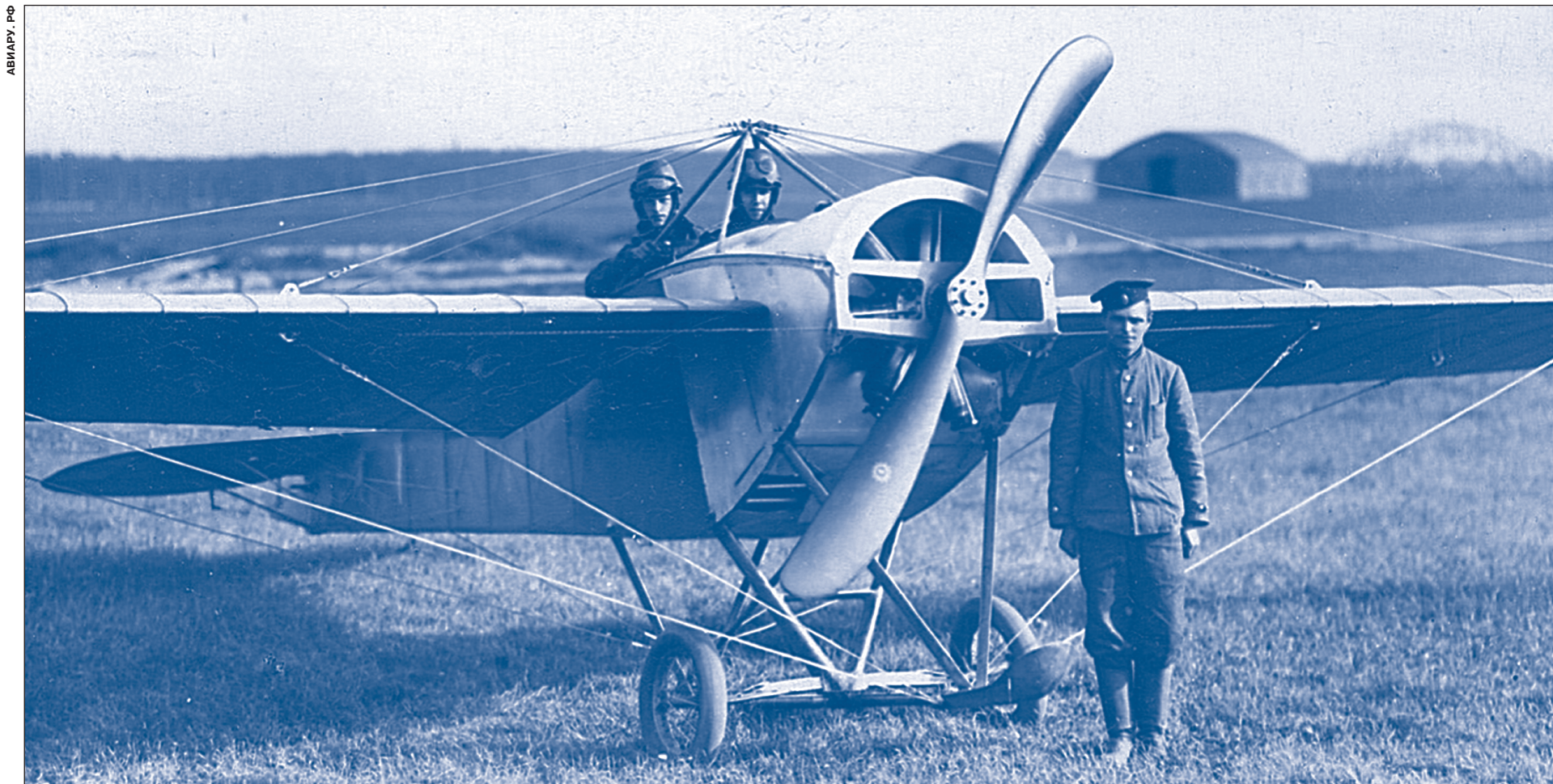
НА САМОЛЕТЕ «НЬЮПОР» БЫЛА ВПЕРВЫЕ СОВЕРШЕНА «МЕРТВАЯ ПЕТЛЯ» ПЕТРОМ НЕСТЕРОВЫМ

Когда речь заходит о российской боевой авиации, всякому понятно – эти парни в поддавки не играют. За долгие годы ее существования российские летчики снискали заслуженную славу настоящих асов. То, что демонстрируют пилотажные группы на авиасалонах, вроде недавнего МАКС-2019 превосходит всякое человеческое воображение и могло бы зваться чудом, если б ни было реальностью. С той поры, когда первый аэроплан с русским пилотом на борту оторвался от земли прошло уже более ста лет и, глядя на высочайшее мастерство современных пилотов и совершенство их боевых машин, хочется вспомнить самое начало долгого и славного пути.