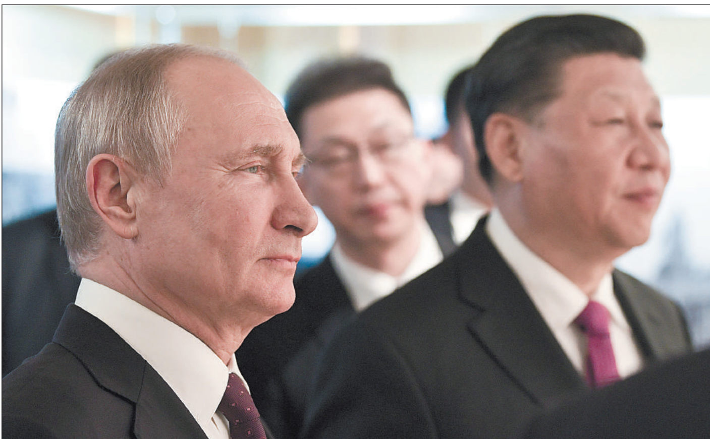
ВЛАДИМИР ПУТИН И ГЛАВА КНР СИ ЦЗИНЬПИН

сопряжении было подписано еще в 2015 году, но тогда это рассматривалось как вежливый отказ участия России в этом проекте в качестве полноценного партнера Китая. И вдруг этот изящный маневр уклонения от слишком тесных объятий Поднебесной превратился этой весной чуть ли не в обещание принять Китай в ЕАЭС.