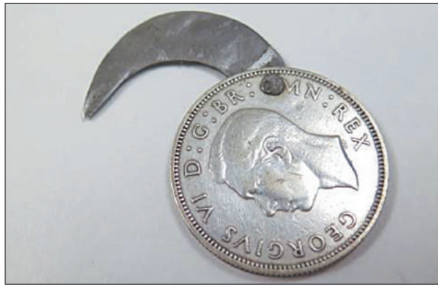
нож в монете

веряет содержимое добытого у вас кошелька, есть возможность незаметно положить руку на пряжку и в следующий миг ловко выхватить клинок довольно крупных размеров. Тут уже, при известном навыке и готовности пустить оружие в ход, роли охотника и добычи могут стремительно поменяться. Не менее эффективна такая конструкция может быть и в диверсионной работе, скажем быстро снять патруль, на свою голову решивший проверить ваши документы. Но при всей скрытности ношения и быстроте извлечения нож-пряжка имеет существенный недостаток – из-за изогнутой формы она неудобна в удержании. Хотя работы по преодолению этой проблемы данного оружия «последнего шанса» ведутся и по сей день.