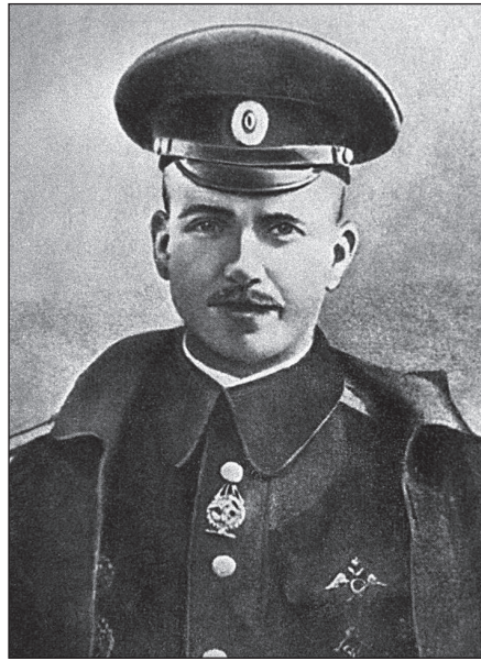
ШТАБС-КАПИТАН П.Н. НЕСТЕРОВ

в небо. При некомплекте пилотов все поставленные боевые задачи авиаотряд выполнял. Однако после одного из вылетов (третьего в тот день) усталость дала о себе знать и без того не слишком физически здоровый молодой офицер рухнул без чувств рядом со своим «воздушным боевым конем».