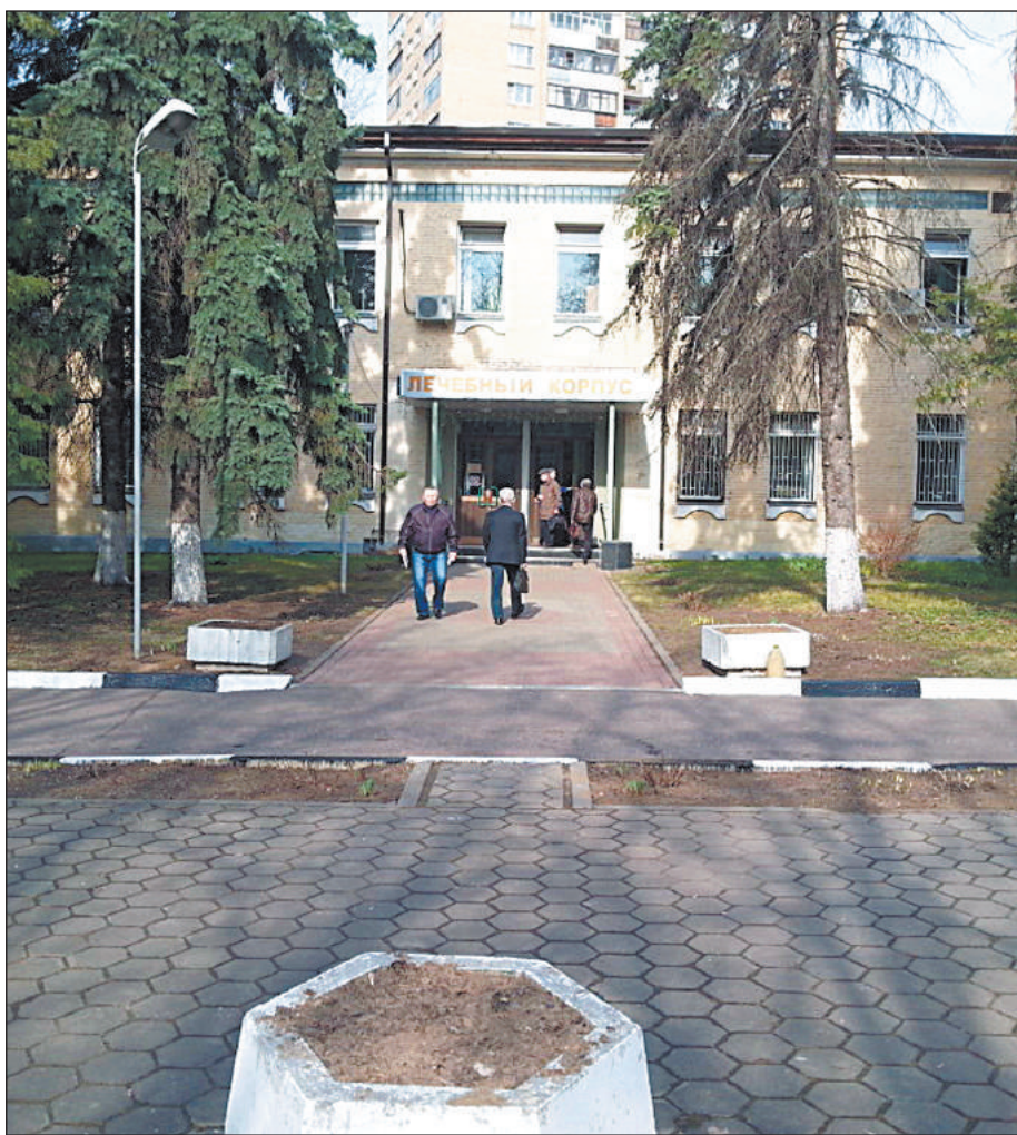
ФИЛИАЛ № 6 ГОСПИТАЛЯ ИМЕНИ БУРДЕНКО

Зеленую часть территории госпиталя ветеранов войн решили пустить под коммерческое строительство еще при