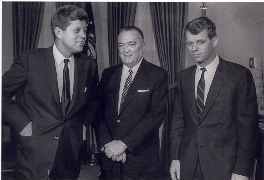
ПРЕЗИДЕНТ ДЖОН КЕННЕДИ С ЭДГАРОМ ГУВЕРом И СВОИМ БРАТОМ РОБЕРТОМ КЕННЕДИ (ФОТО 1960-х ГОДОВ)

Федеральное бюро расследований (Federal Bureau of Investigation, FBI) — это государственное ведомство при Министерстве юстиции США, находящееся в подчинении генерального прокурора Соединенных Штатов Америки. Бюро было создано в 1908 году. Его отцом-основателем стал генеральный прокурор США Чарльз Джозеф Бонапарт. Поначалу организация называлась Бюро расследований, но в 1932 году ее переименовали в Бюро расследований Соединенных Штатов, затем в Отдел расследований, и только в 1935 году ФБР получило свое нынешнее название.