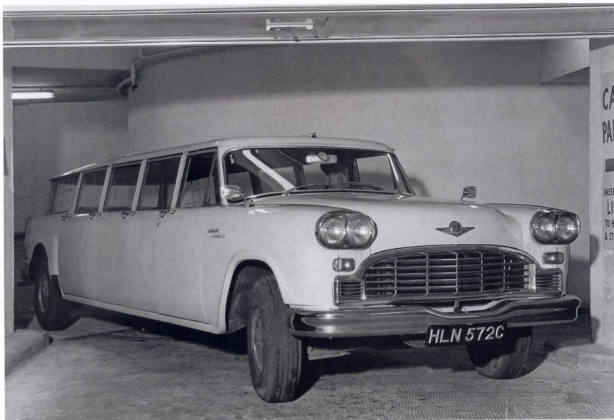
Длиннобазный 12-местный CHECKER AEROCAR на стоянке у отеля NEW ROYAL GARDEN (1966 ГОД)

Не стало исключением и городское полицейское управление города Каламазу (штат Мичиган), время от времени закупавшее продукцию своего «домашнего» производителя. Его примеру последовала и полиция других американских городов. Громоздкие и относительно тихходные Marathon, благодаря рамной конструкции, отлично подходили для «жестких контактов» с автомобилями правонарушителей. Это и понятно: менять несколько кузовных панелей, помятых при таком контакте, гораздо дешевле, чем менять поврежденный кузов целиком, будь он несущим. Компания выпускала и машины с кузовом «универсал», которые часто использовались для доставки пассажиров из аэропортов в гостиницы, а также длиннобазные версии с кузовом «лимузин». Основную часть такси в конце 50-х — начале 60-х годов Checker Motors продавала в Нью-Йорк.