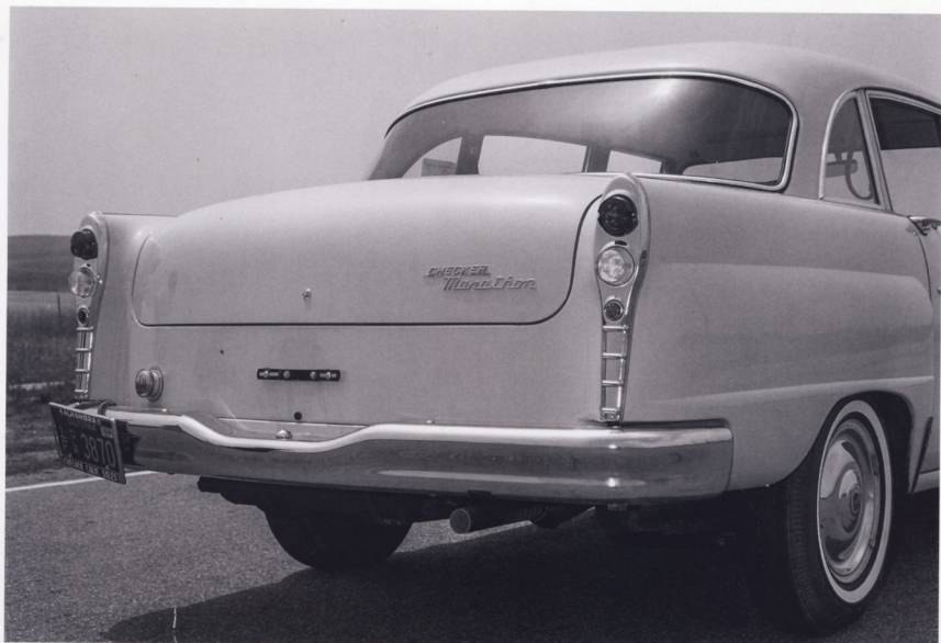
НЕСМОТЯ НА КОНСЕРВАТИВНЫЙ ДИЗАЙН, «СТАРИНА ЧЕКЕР» ОДНИМ СВОИМ ВИДОМ СПОСОБЕН ВЫЗЫВАТЬ ПОЛОЖИТЕЛЬНЫЕ ЭМОЦИИ

Время от времени компания пыталась обновить модельный ряд, но безуспешно — всегда не хватало денег. Так, в 1970 году фирма решила воспользоваться услугами сторонних дизайнеров и заказала разработку автомобиля известному итальянскому кузовному ателье Ghia. Но и эта попытка ожидаемого результата не принесла. Между тем продукция Checker морально устаревала, на экспорт не поставлялась и смотрелась на улицах американских городов явным анахронизмом. Кроме того, устаревшие моторы не отвечали требованиям по защите окружающей среды и экономии топлива, расходуя до 15 л бензина на 100 км.