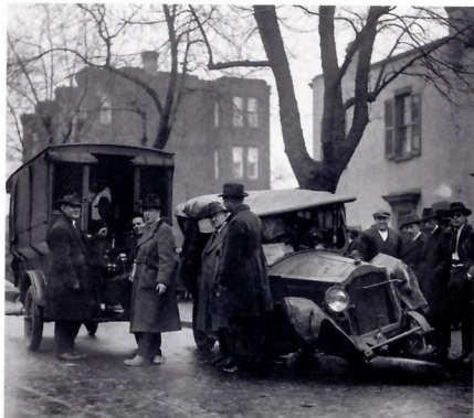
БУТЛЕГЕРОВ, ВЗЯТЫХ С ПОЛИЧНЫМ В ХОДЕ ПОЛИЦЕЙСКОЙ ОПЕРАЦИИ, ОТПРАВЛЯЮТ В ТЮРЬМУ