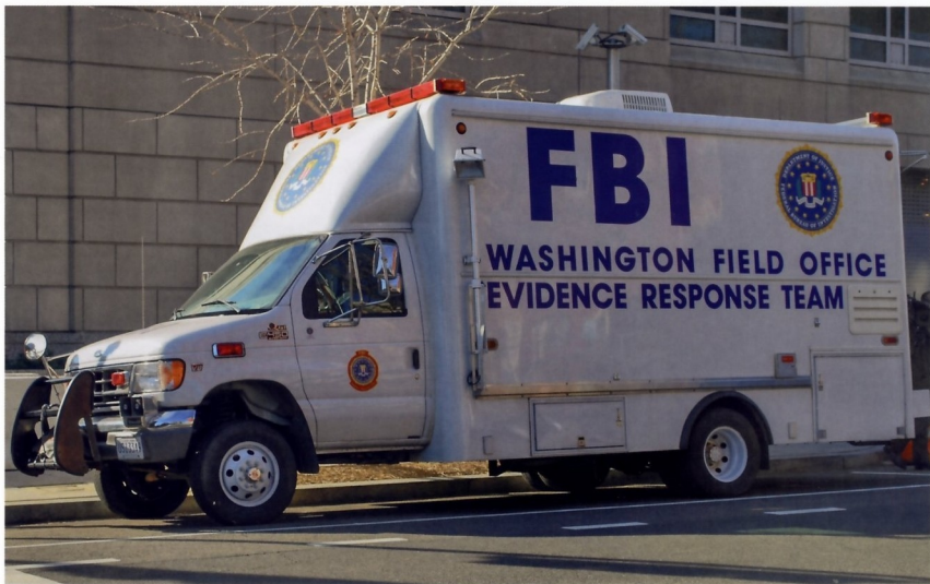
ПЕРЕДВИЖНАЯ КРИМИНАЛИСТИЧЕСКАЯ ЛАБОРАТОРИЯ ФБР ГОТОВА В ЛЮБУЮ МИНУТУ ВЫЕХАТЬ НА МЕСТО ПРЕСТУПЛЕНИЯ

Штаб-квартира ФБР расположена в столичном Вашингтоне, но по всей стране разбросаны 56 полевых офисов и около 400 отделений. Офис ФБР расположен и на территории Пуэрто-Рико. В 24 городах Соединенных Штатов действуют отделения по борьбе с терроризмом.