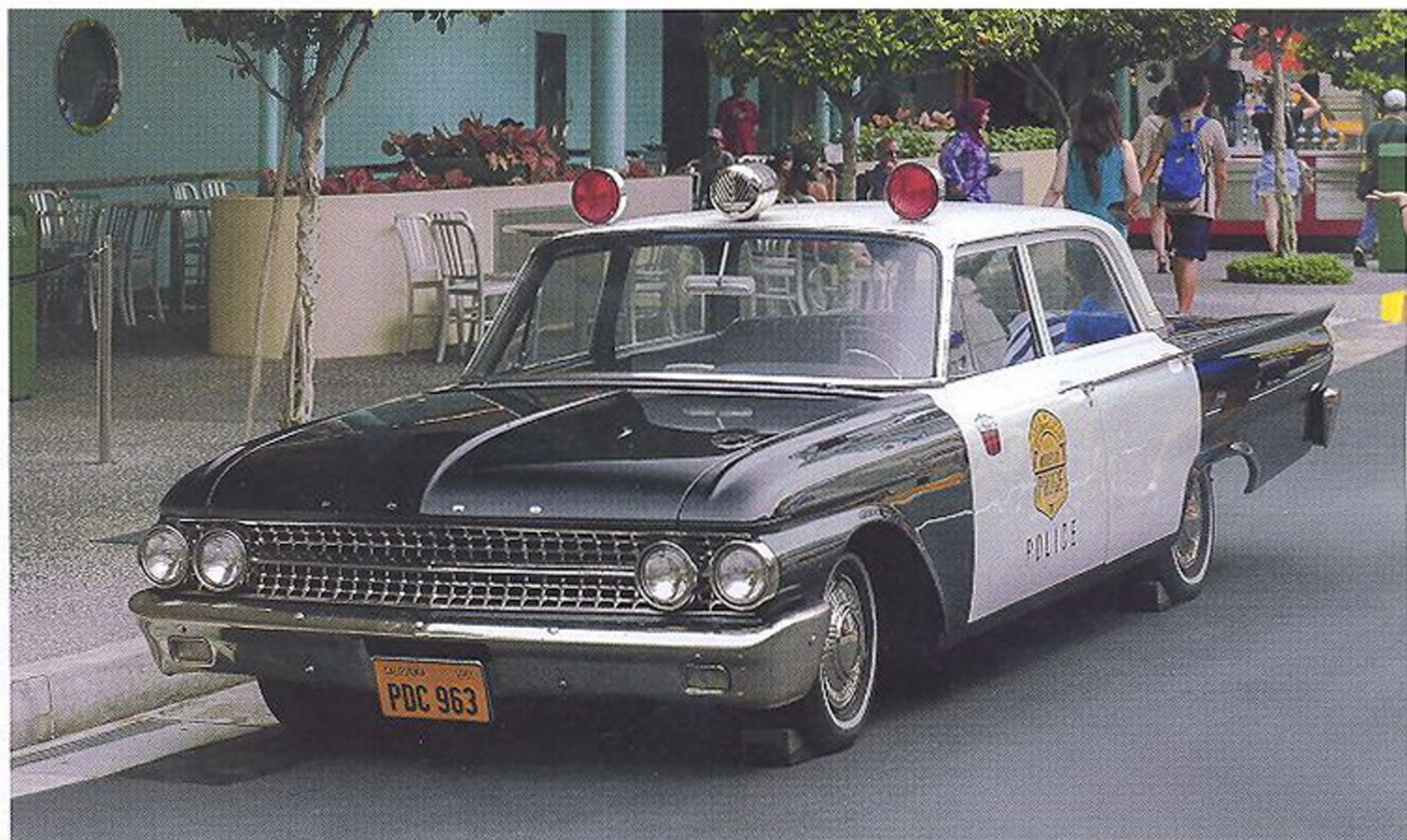
ПОЛИЦЕЙСКИЙ FORD GALAXIE (1961 ГОД)

Впечатляла и линейка моторов — в нее входили 6- и 8-цилиндровые фордовские двигатели мощностью от 150 до 425 л. с. Коробок передач тоже было несколько: 3- и 4-ступенчатые механические и автоматическая Cruise-O-Matic. Разнообразие вариантов комплектации позволяло компании привлекать внимание разных категорий покупателей.