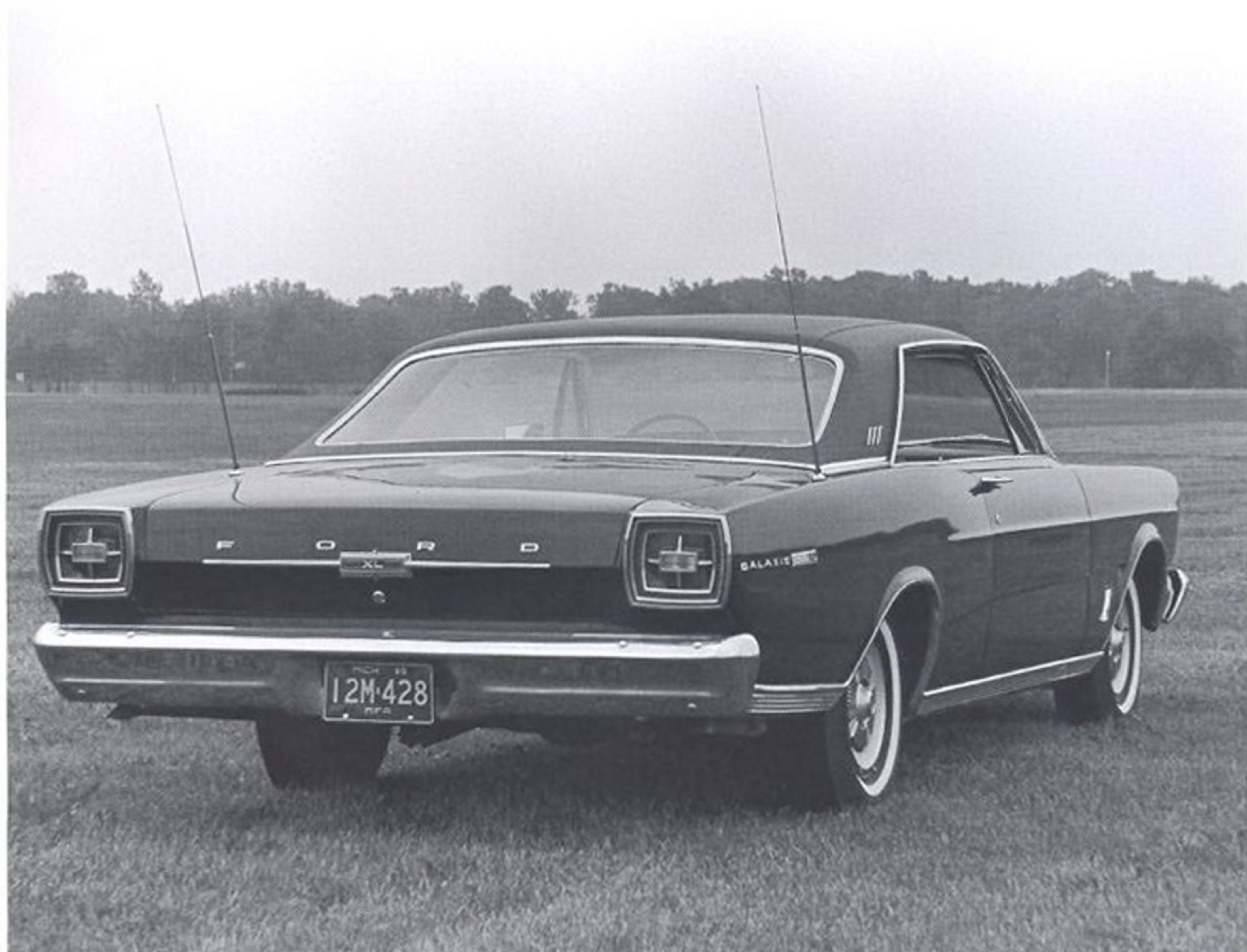
ВЕРСИЯ FORD GALAXIE 500 С 7-ЛИТРОВЫМ МОТОРОМ МОГЛА КОМПЛЕКТОВАТЬСЯ СИСТЕМОЙ УСИЛЕНИЯ ТОРМОЗОВ, 3-СТУПЕНЧАТОЙ КОРобочной-АВТОМАТОМ И КОНДИЦИОНЕРОМ

Существовали и более дорогие версии — Ford Galaxie 500 XL и Ford Galaxie 500 LTD.