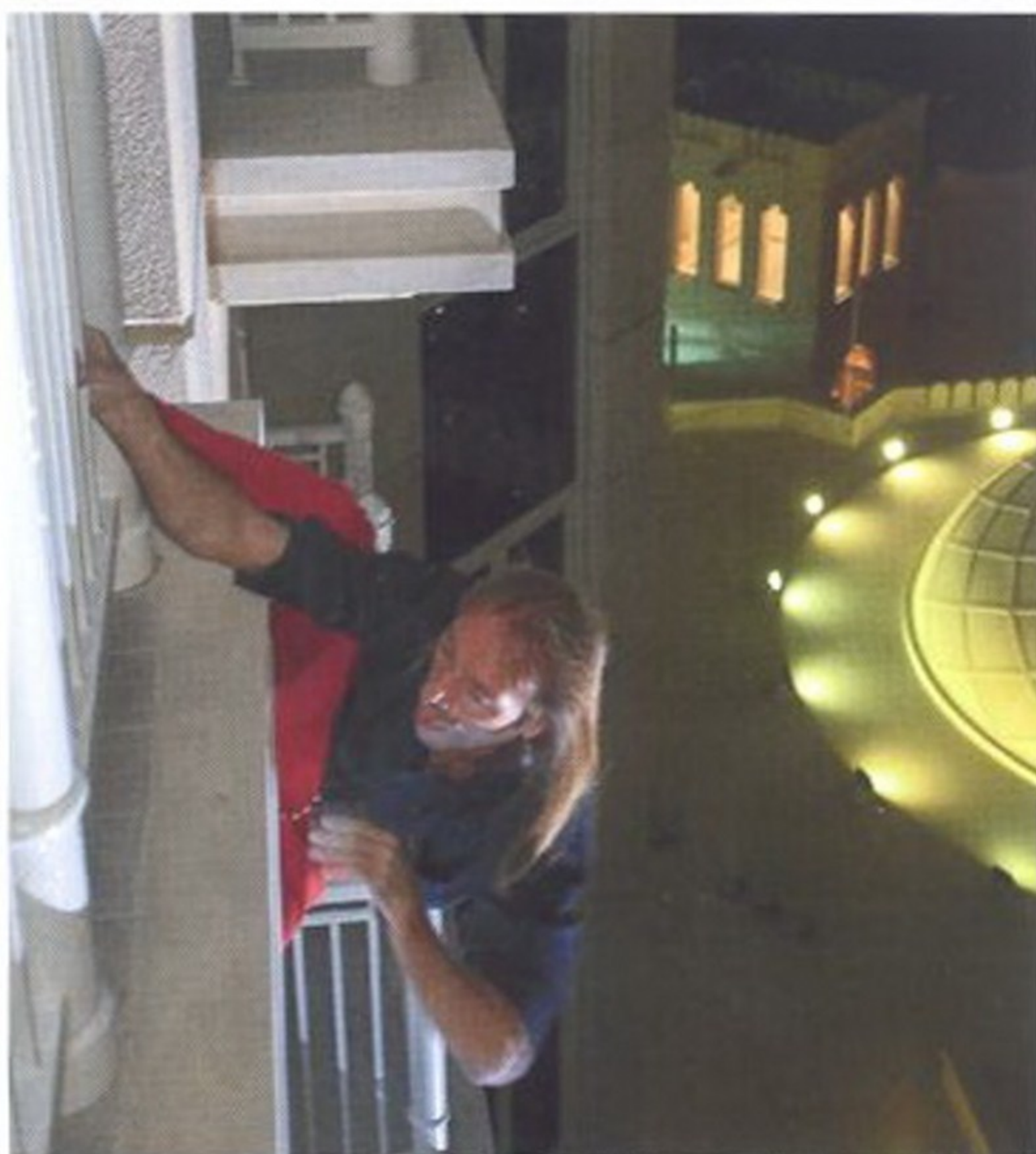
АЛЕН РОБЕР ПОКОРЯЕТ НЕБОСКРЕБЫ В ОДИНОЧКУ И БЕЗ СТРАХОВКИ

В Хьюстон Ален Робер приехал специально для того, чтобы взобраться на местную высотку. Его появление в городе не стало неожиданностью для поклонников и прессы.