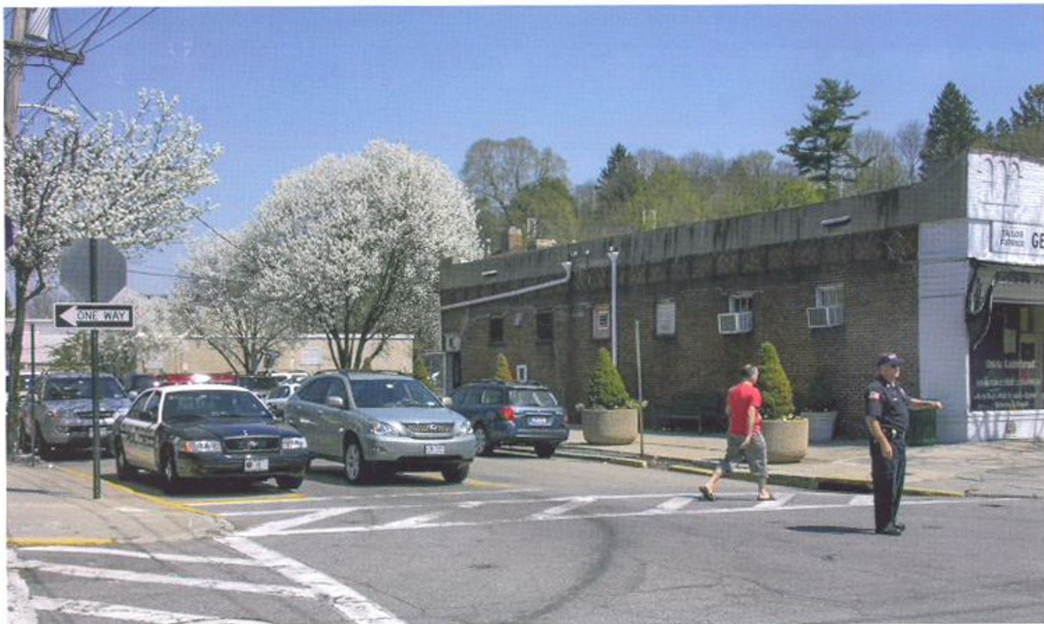
ДАЖЕ В НЕБОЛЬШИХ АМЕРИКАНСКИХ ГОРОДАХ ДВИЖЕНИЕ НА САМЫХ ОЖИВЛЕННЫХ ПЕРЕКРЕСТКАХ РЕГУЛИРУЕТСЯ ПОЛИЦИЕЙ

Зато здесь много дорожно-транспортных происшествий — за год произошло 417 ДТП. Это настораживает городскую общественность, особенно если учесть, что в 2011 году случилось всего 367 ДТП.