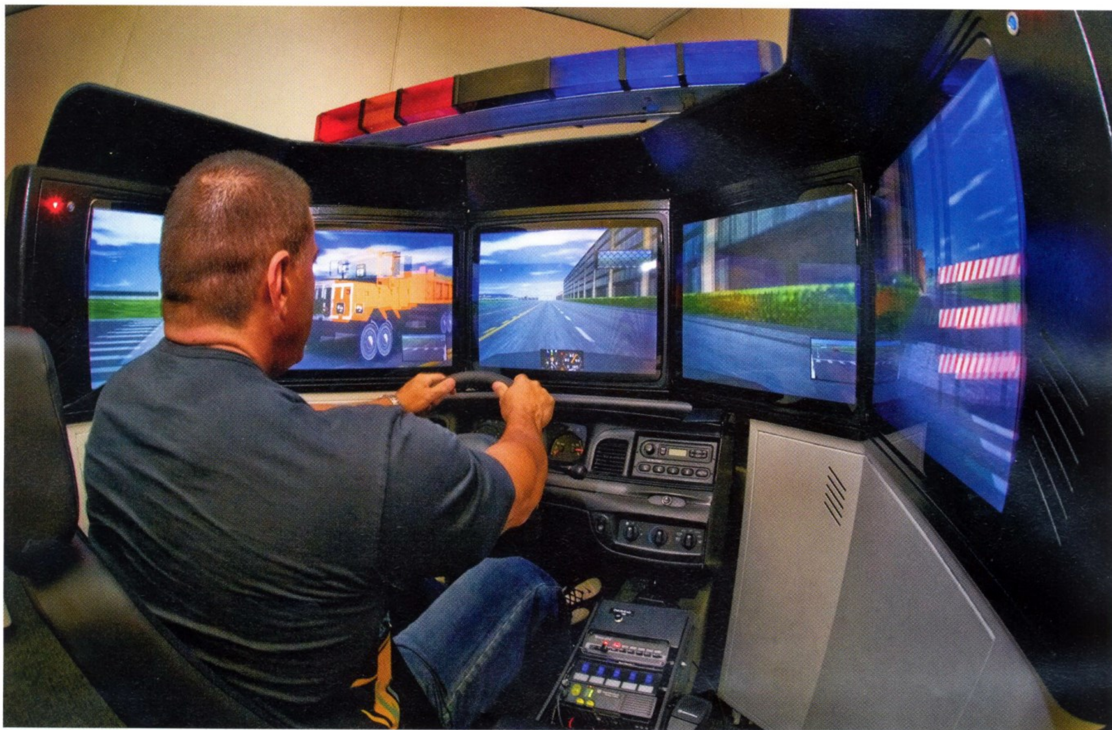
ОФИЦЕР ПОЛИЦИИ ОТРАБАТЫВАЕТ НАВЫКИ ВОЖДЕНИЯ ПАТРУЛЬНОГО АВТОМОБИЛЯ НА СИМУЛЯТОРЕ

В жизни нидерландской полиции прочно обосновались и другие современные технологии.