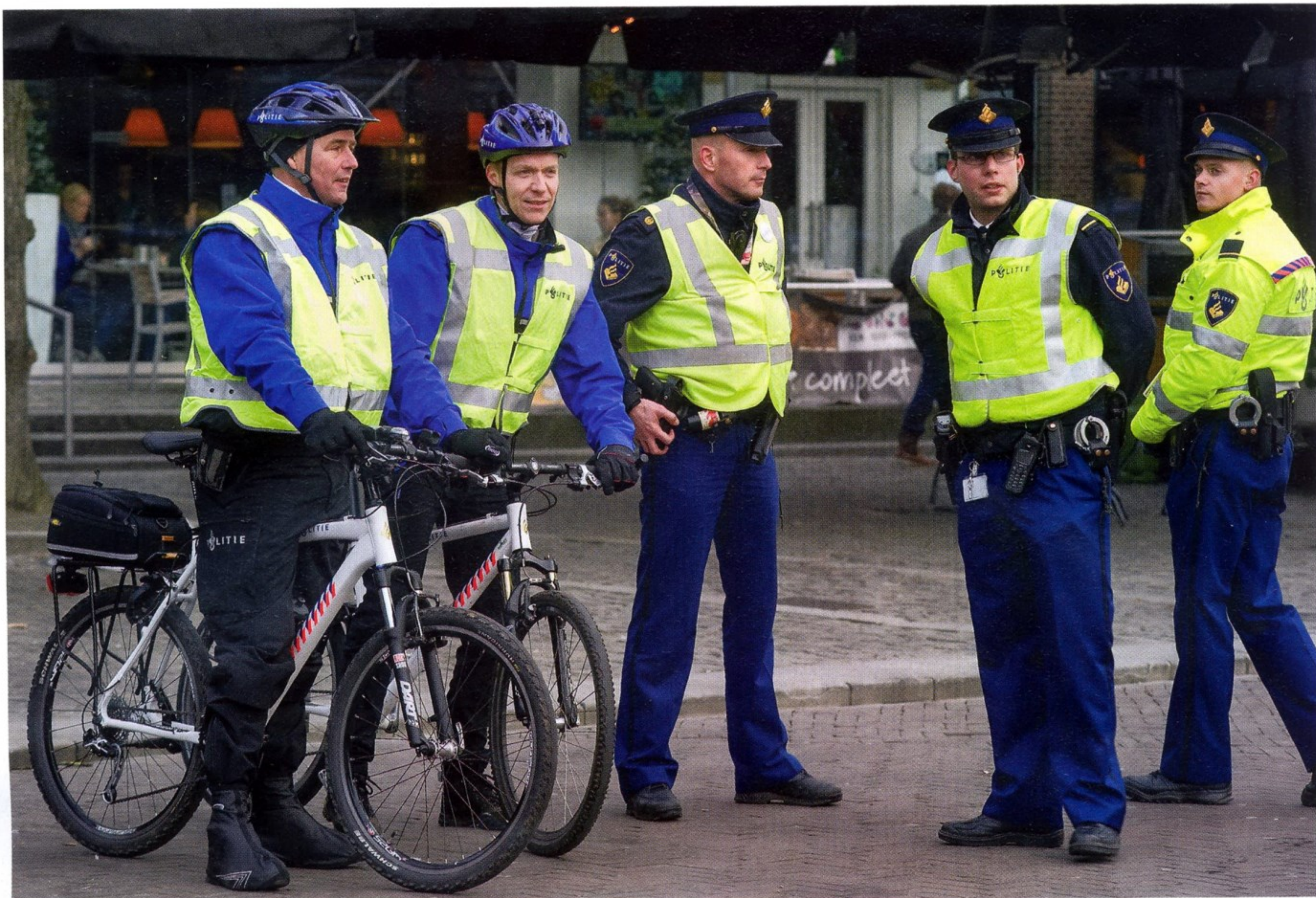
для нидерландских полицейских велосипед стал таким же привычным средством передвижения, как и автомобиль

Нидерланды — небольшое королевство в Западной Европе площадью 41 530 км 2 с населением около 17 млн человек. В его состав входят 12 провинций. Правопорядок в стране обеспечивают Национальная полиция и Королевская жандармерия. Как и в других европейских странах,