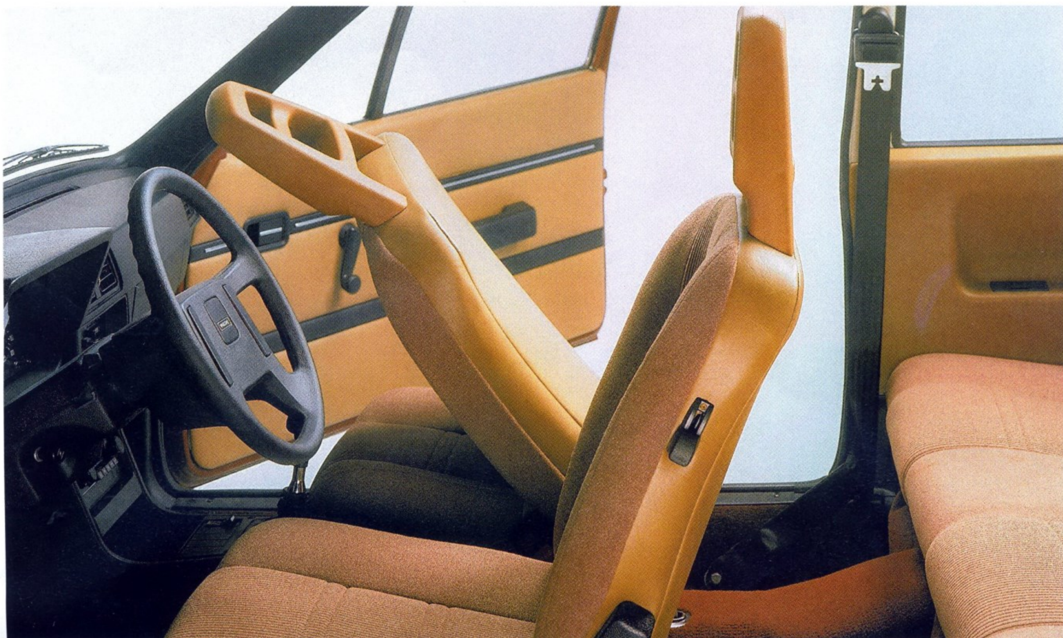
ПО МНЕНИЮ ПСИХОЛОГОВ, НА СТИЛЬ ВОЖДЕНИЯ ВЛИЯЕТ ДАЖЕ ЦВЕТ ОБИВКИ САЛОНА. МЯГКИЕ, НЕЙТРАЛЬНЫЕ ТОНА УСПОКАИВАЮТ И НАСТРАИВАЮТ ВОДИТЕЛЯ НА НЕТОРОПЛИВУЮ И КОРРЕКТНУЮ ЕЗДУ

желании нельзя считать недостатком, поскольку машина создавалась как семейная, а не как спортивная.