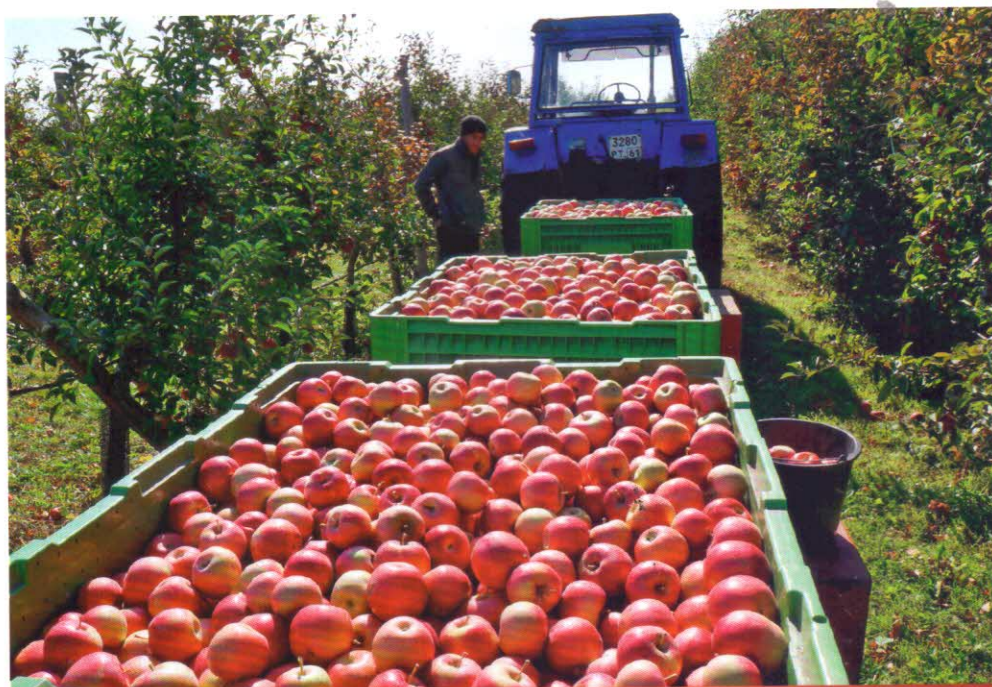
Транспортировка урожая яблок.

Существуют механизмы для полной механизации сбора садового урожая. Так, агрегаты с плодуборочными комбайнами КПУ-2А, работающие в паре, за час снимают урожай косточковых, семечковых и прочих культур с 75 деревьев, диаметр крон которых не превышает 7 м. Элементы комбайна монтируют на два самоходных шасси Т-16М. Машины подъезжают к дереву с двух сторон, одна выдвигает вибратор до упора в штамб, подушки захвата зажимают ствол, улавливатели сдвигаются до смыкания. Один тракторист включает вибратор и он начинает колебать дерево с частотой 15–20 Гц и амплитудой 16–22 мм. Другой тракторист приводит в действие транспортеры. Плоды опадают на улавливатели и по транспортерам движутся на горку. Отсюда они скатываются