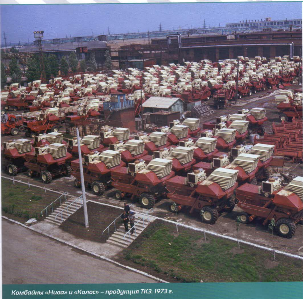
Комбайны «Нива» и «Колос» – продукция ТКЗ. 1973 г.

После возвращения из эвакуации предприятие сразу начало переходить на мирную продукцию: стало выпускать культиваторы, жатки-лобогрейки, паросиловые установки, детали для тракторов. В 1947 году оно освоило производство первого в СССР самоходного комбайна С-4 и мосты ведущих колес комбайнов, а в 1948-м получило название «Таганрогский комбайновый завод». К апрелю 1952 года ТКЗ производил 40 % самоходных комбайнов страны.