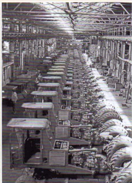
Самоходные шасси СШ-75 на заводе. 1970 г.

СШ-75 «Таганрожец» состоит из двух основных частей: ходовой системы с несущей рамой, имеющей переменную (регулируемую) колею ведущих и управляемых колес, и силового агрегата с площадкой управления и кабиной. Положение силового агрегата относительно ходовой системы может изменяться таким образом, что шасси становится Г-образным или симметричным.