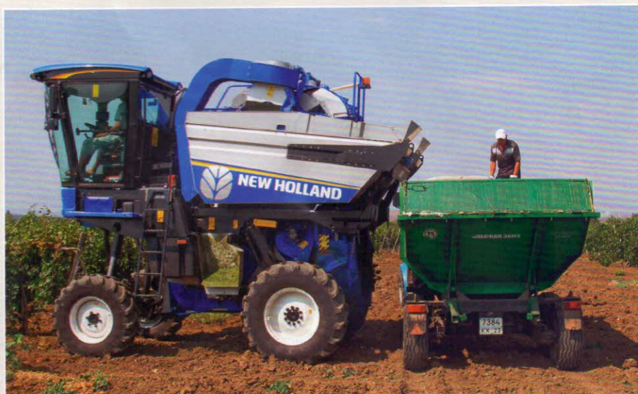
Комбайн на уборке винограда.

Существуют и устройства для сбора опавших плодов. Механические подборщики представляют собой пальцевые транспортеры, игольчатые барабаны или барабанно-валцовые устройства. Их недостаток в том, что они захватывают много примесей и повреждают плоды. Пневматические подборщики действуют с помощью вакуумных присосов или воздушного потока. Эти машины гораздо более энергоемкие и также забирают примеси. Комбинированные подборщики используют и всасывающий поток воздуха, и пальцевый барабан. Они подбирают плоды с меньшими примесями и меньшими повреждениями, однако эти машины громоздки и тратят много энергии.