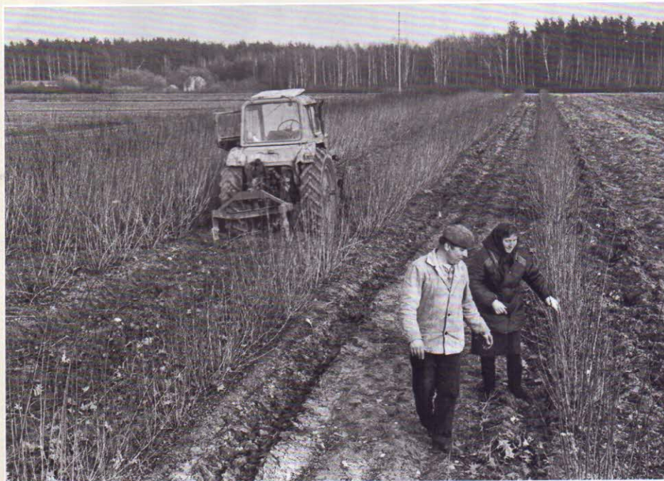
Отбор саженцев в питомник Листопадовичского лесничества. Минская область. 1988 г.