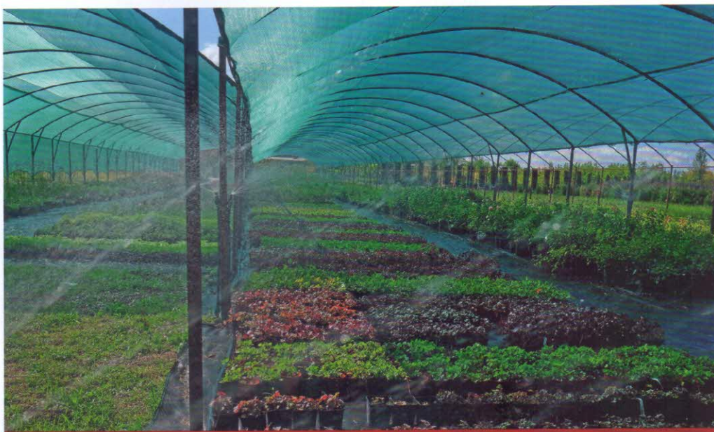
Автоматический полив растений в питомнике декоративных растений «Экосад Восточный». Краснодарский край. 2017 г.

Машина МДВ извлекает деревья вместе с земляным комом и устанавливает в контейнеры. Для выкопки сеянцев хвойных и лиственных пород также подходят навесная выкопочная скоба НВС-1,2 и копач сеянцев КСШ-0,35. Скоба НВС-1,2 на легких почвах работает с тракторами Т-40А, «Беларус», на тяжелых – с Т-74, ДТ-75, ДТ-75М. Ширина захвата – 1,05 м, глубина подковки – 30 см. Копач КСШ-0,35 монтируют на самоходное шасси Т-16М. Ширина захвата – 0,35 м, глубина подковки – 15–25 см.