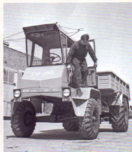
Самоходное шасси СШ-150, разработанное и изготовленное на Таганрогском комбайновом заводе. 1972 г.

Производитель СШ-75 «Таганрожец» Таганрогский Комбайновый завод имеет длинную и богатую историю. Не всегда он был в Таганроге и не сразу стал производить комбайны. Жизнь завода на таганрогской земле началась в Первую мировую войну. Собственно, благодаря ей предприятие и появилось. Акционеры Русско-Балтийского судостроительного механического общества, находившегося в Ревеле (Таллин), не дожидаясь прихода немцев, выкупили у города Таганрога 177 десятин земли и перевезли завод сюда. Кроме оборудования из Прибалтики, прибыли специалисты из Москвы и Петрограда.