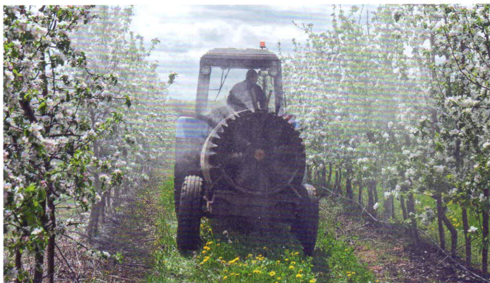
Обработка от вредителей цветущих яблонь в Корочанском плодопитомнике. Белгородская область. 2017 г.

В плодопитомниках используют механизмы для заполнения кассет и горшков для рассады почвой, специальные пересадочные машины, культиваторы, которые не повреждают даже самые молодые и уязвимые растения. Вот еще одна узкоспециализированная машина (фирмы HEULING) – обрезчик побегов клубники.