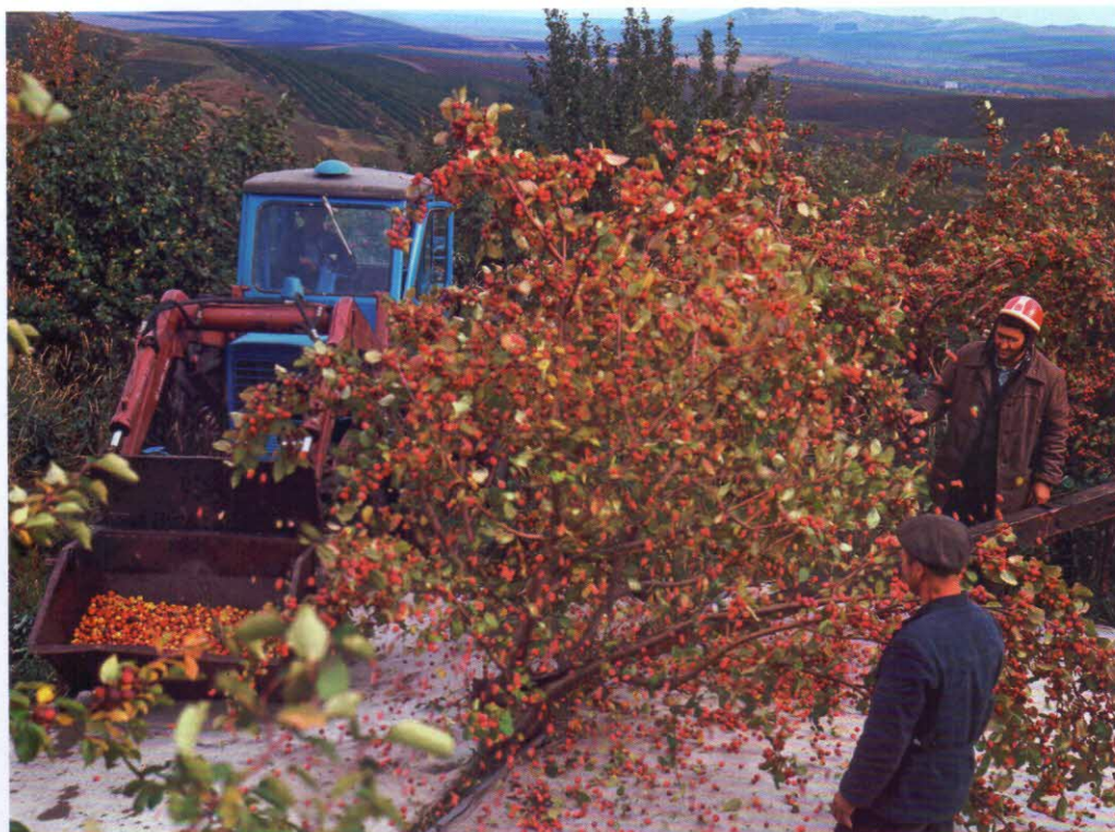
Сбор урожая в садах совхоза «Мичуринец». 1976 г.

установлен поливной бачок с язычком для опрокидывания и уравнивающим грузом. Когда сажальщик опускает саженец в борозду на месте пересечения посадочной и маркерной борозд, корень саженца нажимает на язычок и бачок опрокидывается, поливая саженец. Затем специальные детали – загортаци – засыпают почвой корневую систему. Производительность МПС-1 – 450 саженцев в час.