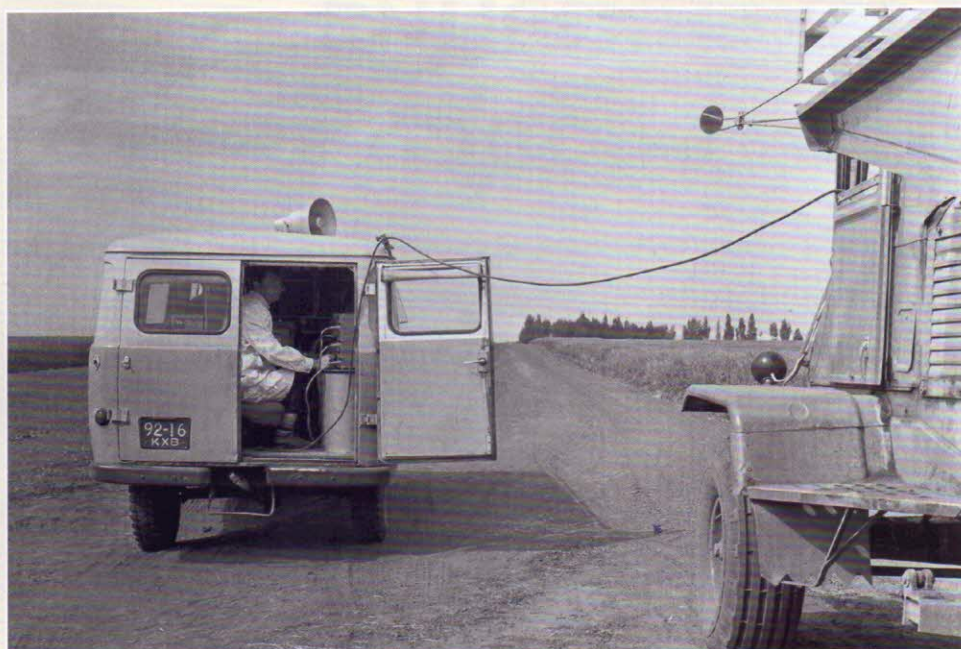
Проверка условий в кабине тракториста на СШ-75. 1968 г.