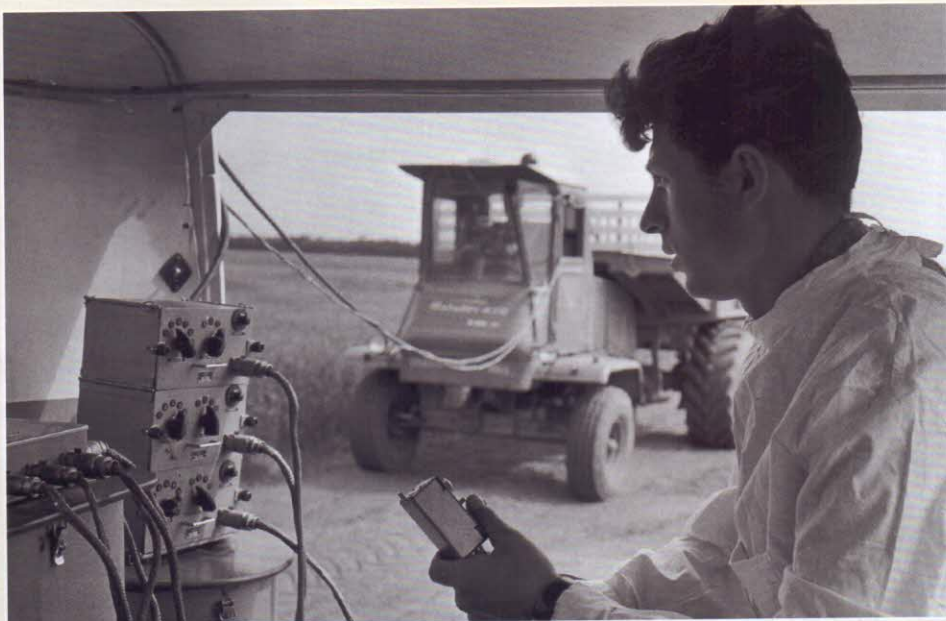
Испытания самоходного шасси СШ-75 с помощью передвижной тензометрической лаборатории на силу вибрации в кабине водителя. 1968 г.