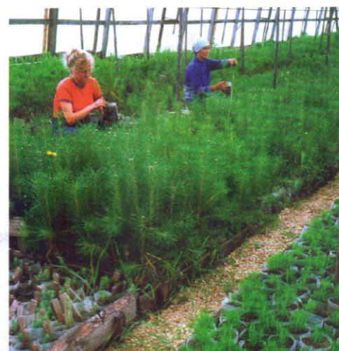
В теплице Сыктывкарского лесопитомника. 1983 г.

В зависимости от числа рядков на грядке, подключают 2–4 фрезы. За один проход обрезчик обрабатывает несколько грядок: с трактором шарнирно соединена основная рама, а с ней в свою очередь несколько режущих модулей, каждый из которых работает на отдельной грядке. В состав режущего элемента входит ротор, резиновый палец и лезвие. Пальцы приподнимают побеги и подносят их к режущим дискам. В комплект могут быть включены щетки, которые очищают грядки и междурядья от обрезков.