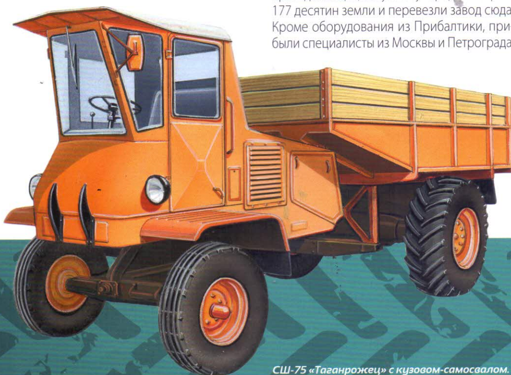
СШ-75 «Таганрожец» с кузовом-самосвалом.

С семьями, на пустое место. Как это не раз бывало и позже, во Вторую мировую войну, параллельно строили цеха, жилье и выпускали продукцию – артиллерийские снаряды и ружейные патроны. К началу 1917 года Русско-Балтийский снарядный завод был уже одним из крупнейших предприятий Юга России, на нем работало около 8000 человек. Несколько раз предприятие меняло специализацию, название и даже «место жительства». Таганрогский механический, затем Таганрогский инструментальный, Тюменский (в эвакуации) мотоциклетный завод выпускал инструменты (тиски, труборезы, микрометры, штангенциркули, поверочные плиты и др.), запчасти для тракторов, двигатели для лодок, мотоциклы ТИЗ АМ-600 для Красной армии.