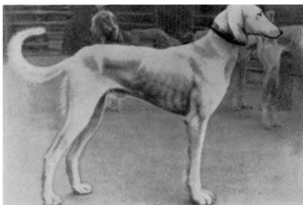
Рис. 15. Таза казахская. Из собрания автора