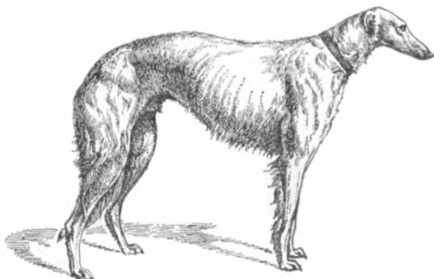
Рис. 2. Чистопсовый кобель Подар В. А. Шереметева на Московской выставке собак 1978 г.

псовыми, отличались от них меньшим ростом и более легким костяком и ногами, также менее были богаты сообразно костью и мускулатурой. Головы псовых собак были узки и длинны, имели даже наклонность к острощипости (чрезмерной тонкости в конце щипца), с черными или темно-ореховыми глазами и