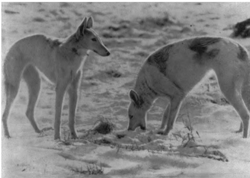
Рис. 3. Русские псовые борзые в возрасте 10 месяцев. Из собрания автора