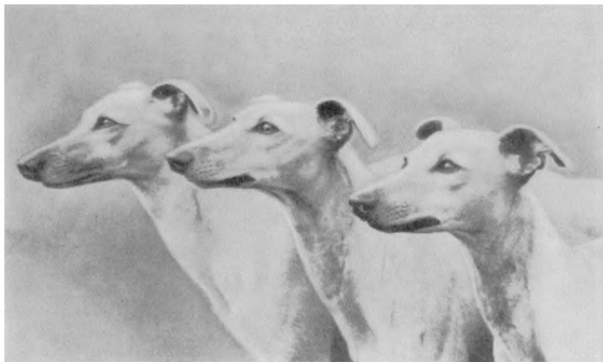
Рис. 7. Виппет — англий- ская порода.