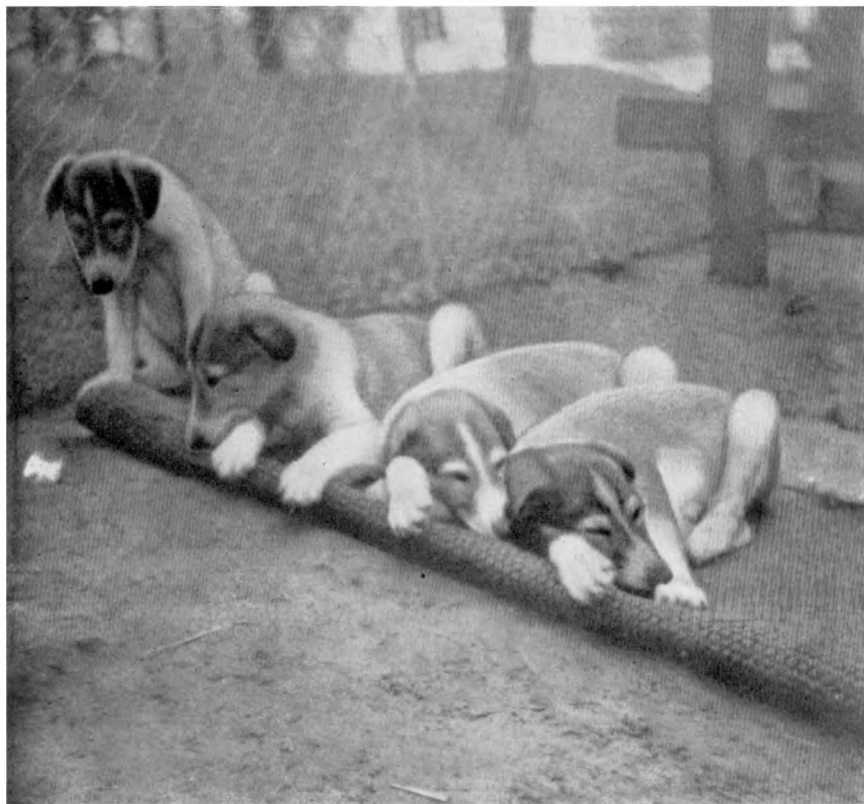
Рис. 4. Двухмесячные щенки русской псовой породы. Владелец Урсула В. Трюб (Швейцария)