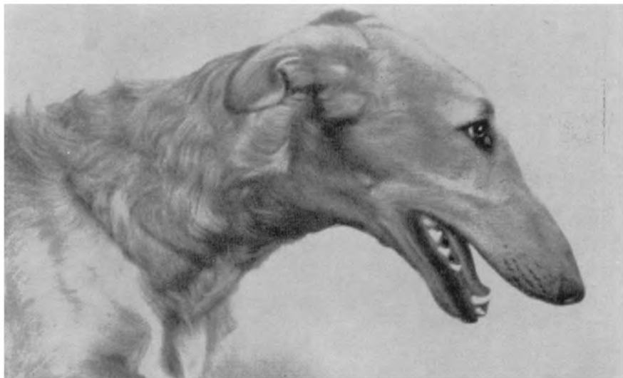
Рис. 9. Русская псовая борзая Сайга. Владелец Урсула В. Трюб (Швейцария)