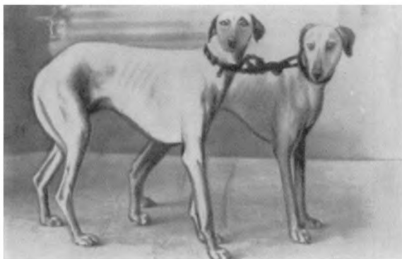
Рис. 11. Слюгги — древнейшая порода борзых Азии (по мнению некоторых ученых, более древняя, чем тезем).