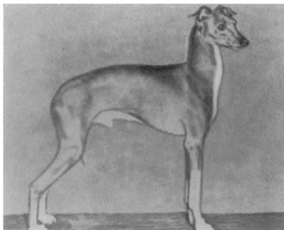
Рис. 16. Итальянская маленькая борзая.