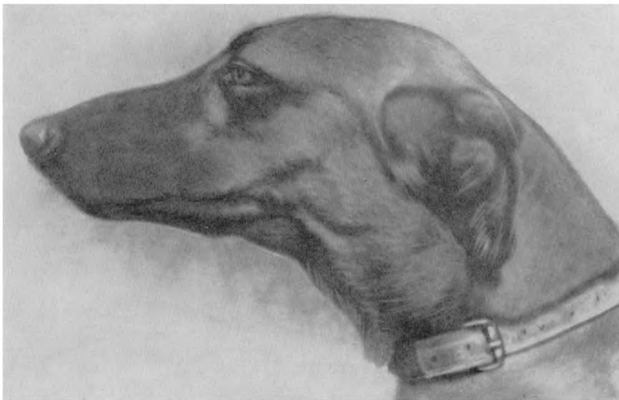
Рис. 5. Голова хортой суки Пальмы. Владелец К. М. Эсмонт.