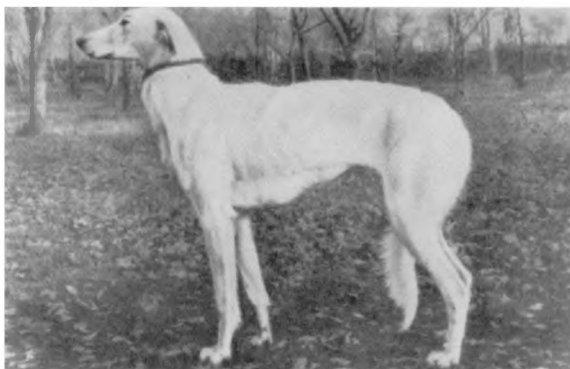
Рис. 10. Промысловая борзая из Тамбовской области (помесь псовой с хортой).