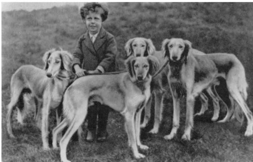
Рис. 12. Салюки — группа, по экстерьеру очень близкая к тазе казахской (тип конца XIX — начала XX веков). Из собрания автора