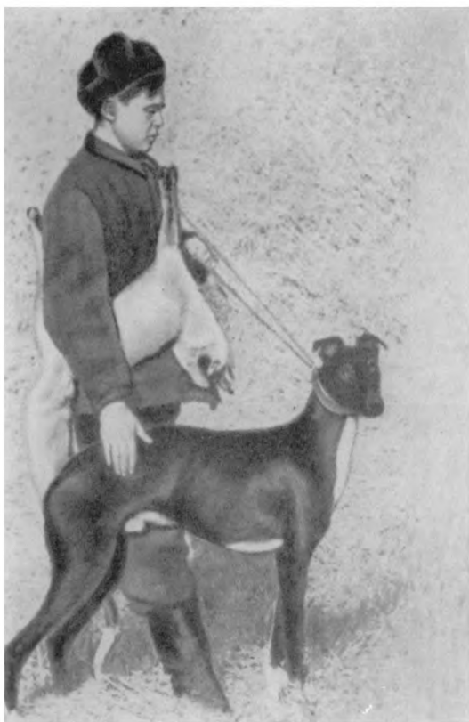
Рис. 8. Хортая.