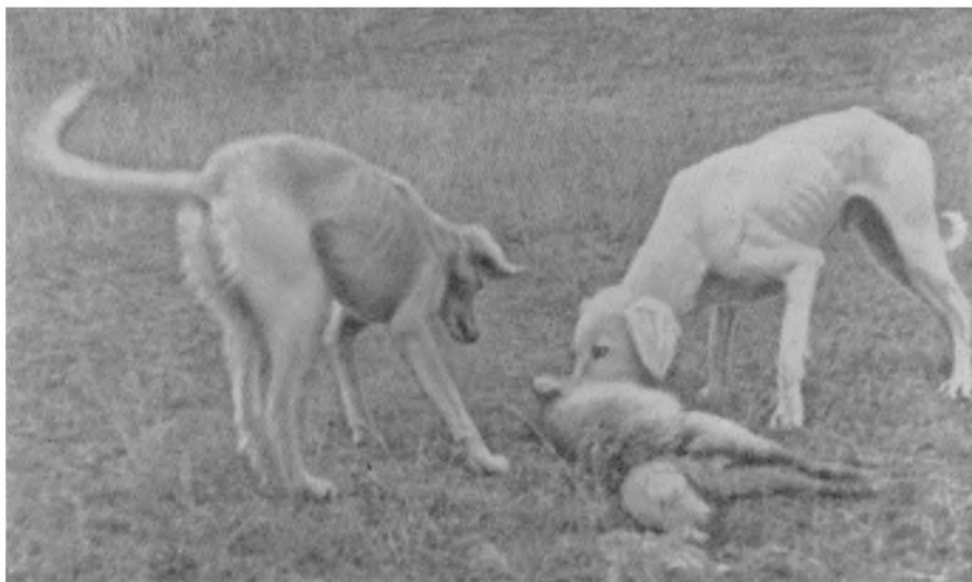
Рис. 6. Казахские тазы на охоте. Из собрания автора