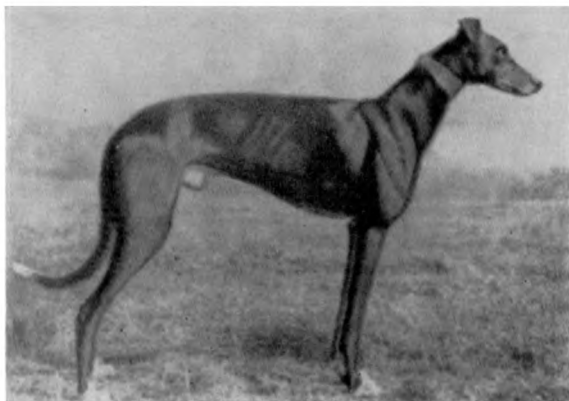
Рис. 14. Английская борзая грейхаунд.