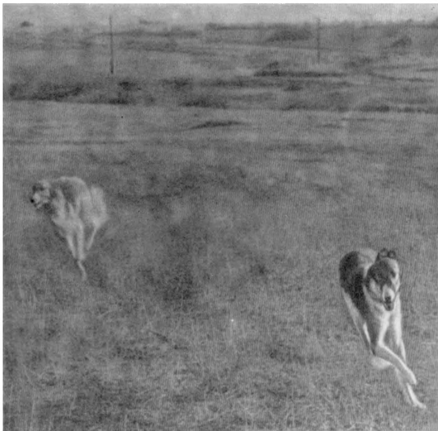
Рис. 1. Русские псовые борзые на охоте.