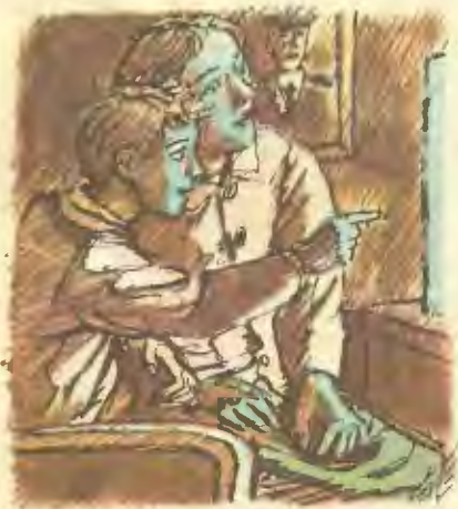
Рис. Б. ДИОДОРОВА