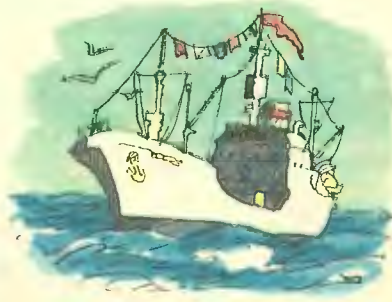
Рис. Б. ДИОДОРОВА