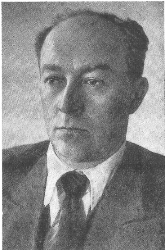
Секретар ЦК КП(б)У Д. С. Коротченко. 1940 рік