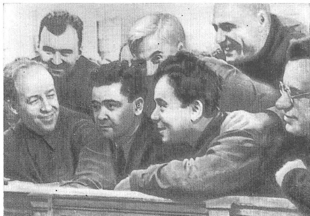
Д. С. Коротченко на VIII позачерговому Всесоюзному з'їзді Рад. Москва. 1936 рік