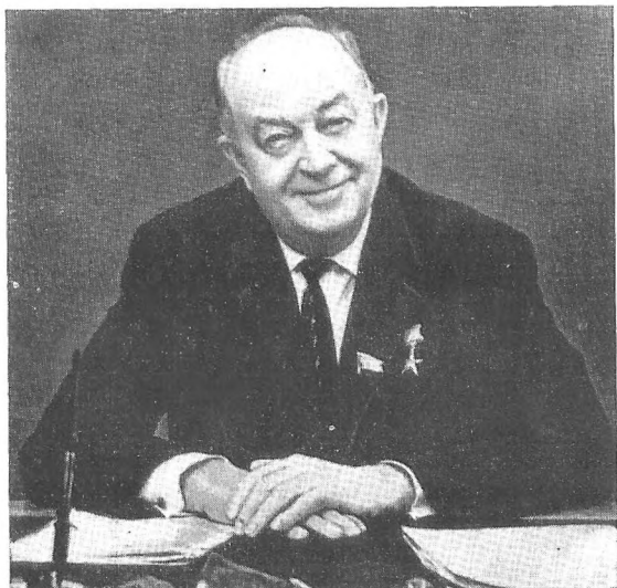
Голова Президії Верховної Ради УРСР Дем'ян Сергійович Коротченко у своєму робочому кабінеті. 1965 рік