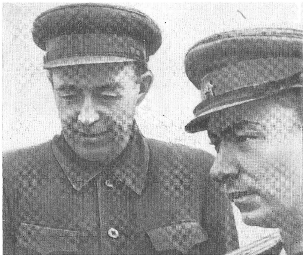
Д. С. Коротченко і А. С. Малишко під час боїв на Курській дузі