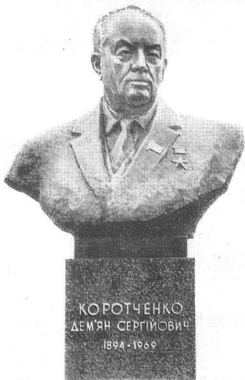
Пам'ятник Д. С. Коротченку на його батьківщині в с. Коротченковому на Сумщині