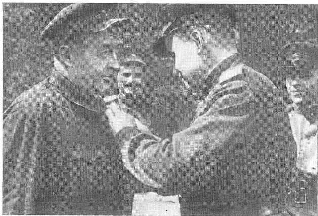
Начальник Українського штабу партизанського руху Т. А. Строкач вручає Д. С. Коротченку медаль «Партизану Вітчизняної війни» І ступеня. Червень 1943 року