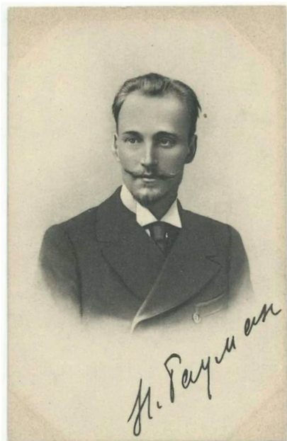
Бауман Николай Эрнестович (Сарафский, Сорокин) (1873–1905)

Профессиональный революционер, выдающийся деятель большевистской партии. Революционную деятельность начал в первой половине 90-х годов в Казани; в 1896 году активно участвовал в работе петербургского «Союза борьбы за освобождение рабочего класса», вёл пропаганду среди рабочих в Нарвском районе. В 1897 году был арестован и после 22-месячного заключения в Петропавловской крепости сослан в Вятскую губернию; в октябре 1899 года эмигрировал в Швейцарию, вошёл в «Союз русских социал-демократов за границей», принял активное участие в борьбе с «экономизмом». В 1900 году был одним из основателей организации «Искры», как её агент в 1901–1902 годах работал в Москве; в феврале 1902 года был арестован, 18 (31) авгу-