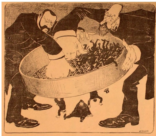
Карикатура на Государственную Думу

Ленин пишет о Думе в статье «Ко всем рабочим и работницам города Петербурга и окрестностей» так: «Это — не народная, а полицейская и помещичья Дума. Выборы назначены не поровну от всех, а подстроены так, чтобы помещики и крупные капиталисты имели полный перевес над рабочими и крестьянами. Из всего рабочего класса три четверти совсем лишены права выборов, а остальную четверть приглашают выбирать с просевкой депутатов через три сита, чтобы сначала выбирали уполномоченных, а уполномоченные выборщиков, а выборщики (числом всего 24) должны вместе с помещиками и капиталистами (числом более ста) выбирать членов Думы... Для чего устроена эта просевка через три и четыре сита? Для того, чтобы рабочие и крестьяне не могли провести в Думу своих настоящих выборных. Для того, чтобы не могли попасть в Думу люди, стоящие за рабочих и крестьян. Для того, чтобы народными представителями могла назвать себя кучка черносотенных помещиков и капиталистов, грабящих при помощи полиции весь рабочий народ.»