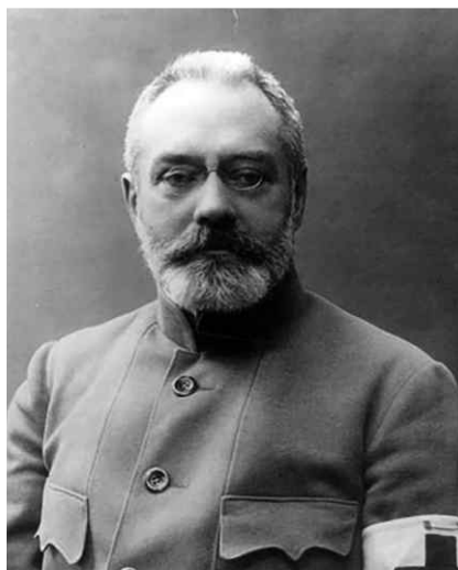
Гучков Александр Иванович (1862–1936)

Крупный русский капиталист, организатор и лидер буржуазно-помещичьей партии октябристов. В период революции 1905–1907 годов резко выступал против революционного движения, солидаризируясь с правительственной политикой беспощадных репрессий по отношению к рабочему классу и крестьянству. В годы реакции — председатель Комиссии государственной обороны и председатель III Государственной думы. Во время первой мировой войны был председателем Центрального Военно-промышленного комитета и членом Особого совещания по обороне. После Февральской революции 1917 года — военный и морской министр первого состава Временного правительства, выступал за продолжение войны до победного конца. В августе 1917 года лично участвовал в организации корниловского мятежа, был арестован на фронте, но освобождён Временным правительством. После Октябрьской социалистической революции активно боролся против Советской власти, белоэмигрант. Упоминается в статье «Победа кадетов и задачи Рабочей партии».