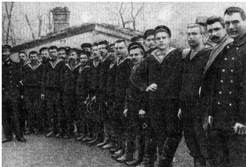
Матросы крейсера «Очаков»