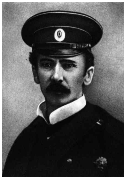
Пётр Петрович Шмидт (1867–1906)

Лейтенант Черноморского флота, революционер-демократ, один из руководителей севастопольского восстания 1905 года. Своими выступлениями против самодержавия на митингах и демонстрациях в октябре 1905 года завоевал большую популярность среди матросов и рабочих; был избран рабочими пожизненным депутатом Севастопольского Совета рабочих депутатов. Вскоре был арестован. После непродолжительного заключения освобождён по требованию масс, но уволен из флота. Во время севастопольского восстания в ноябре 1905 года принял командование крейсером «Очаков», а затем объявил себя командующим флотом. После поражения восстания по приговору царского суда был расстрелян. О нем идёт речь в статье «Войско и революция».