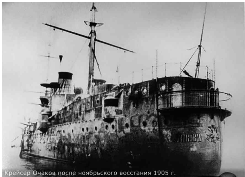
Крейсер Очаков после ноябрьского восстания 1905 г.