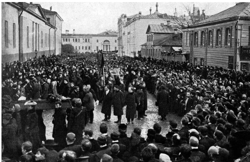
Похороны Н. Е. Баумана 20 окт. 1905 г.