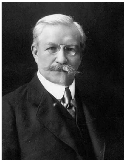
Милюков Павел Николаевич (1859–1943)

«Речь». Член III и IV Государственной думы. После Февральской революции 1917 года — министр иностранных дел в первом составе буржуазного Временного правительства, проводил империалистическую политику войны «до победного конца»; в августе 1917 года принимал активное участие в подготовке контрреволюционного корниловского мятежа. После Октябрьской социалистической революции стал одним из организаторов иностранной военной интервенции против Советской России и активным деятелем белой эмиграции. С 1921 года издавал в Париже газету «Последние Новости». Упоминается в статье «Победа кадетов и задачи Рабочей партии».