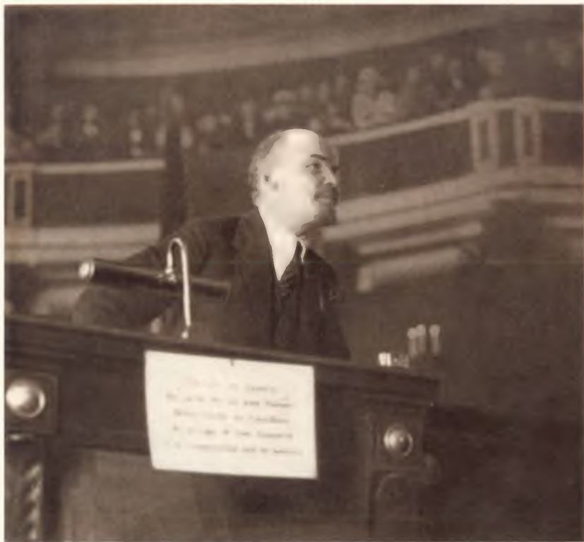
В. И. Ленин выступает на II конгрессе Коминтерна с докладом о международном положении, июль 1920 года