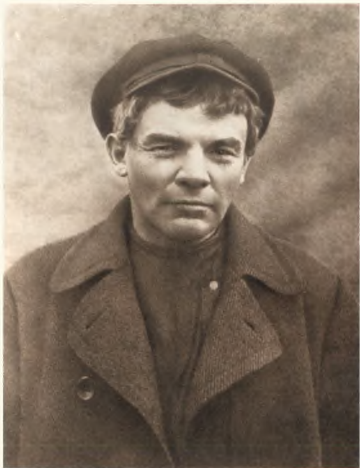
В. И. Ленин в гриме и парике, август 1917 года