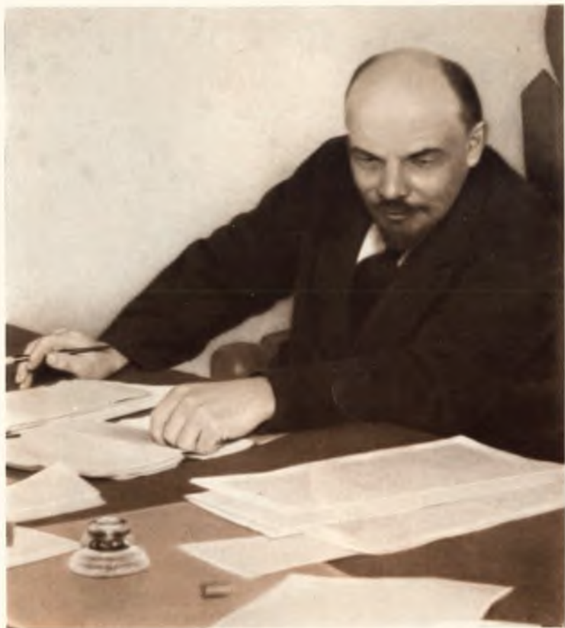
В. И. Ленин в президиуме I конгресса Коминтерна, март 1919 года