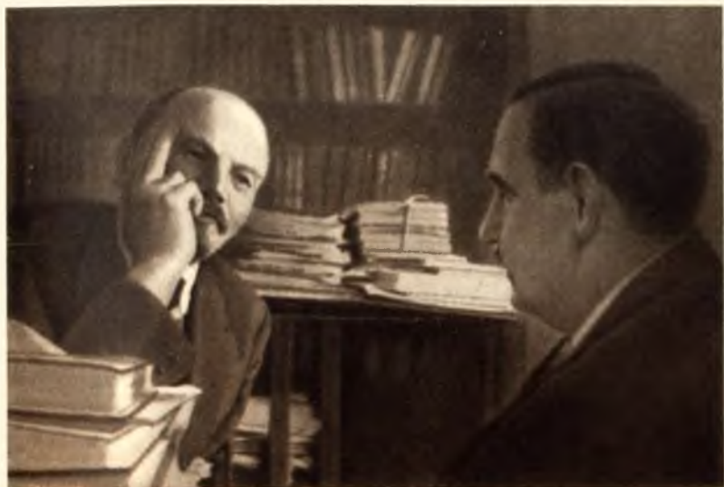
В. И. Ленин беседует с английским писателем Гербертом Уэллсом, 1920 год