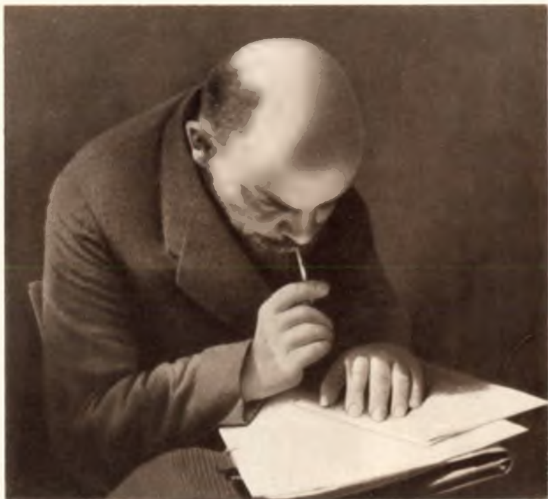
В. И. Ленин во время заседания III конгресса Коминтерна, сидя на ступеньках трибуны президиума, записывает выступления ораторов, июнь 1921 года