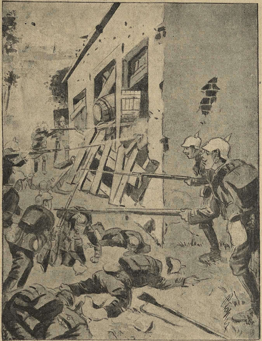
Подвигъ русскаго офицера, забаррикадовавшагося въ крестьянскомъ домѣ и отстрѣливавшагося въ теченіе трехъ часовъ отъ двадцати пруссаковъ.