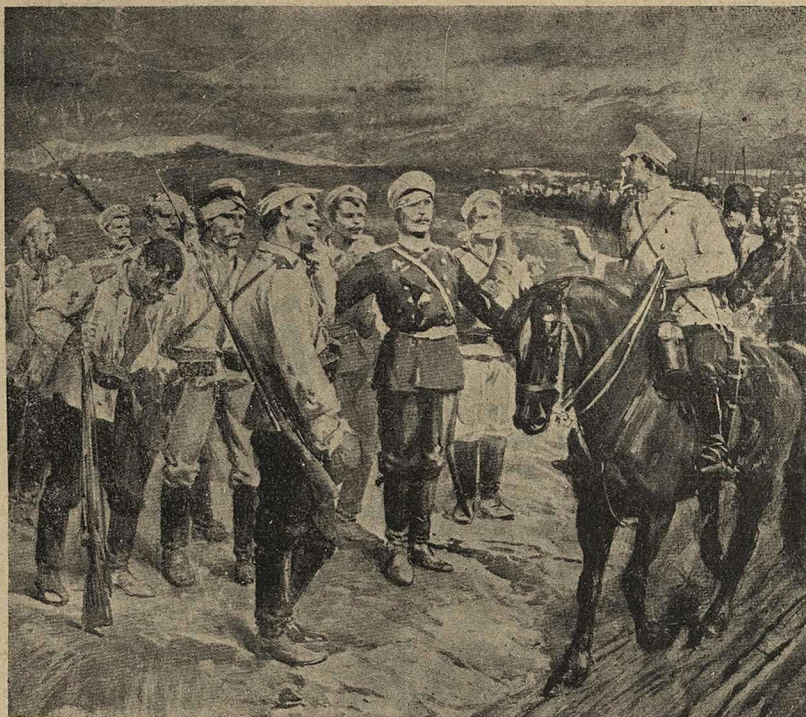
Герой — офицеръ въ прошлую войну рассказываетъ главнокомандующему о боѣ, въ которомъ потерялъ почти всю роту.

Неожиданная стрѣльба пулемета чуть ли не въ центръ непріятельскаго расположенія такъ смутила нѣмцевъ, что они быстро очистили позицію, оставивъ оба орудія и, разумѣется, потерявъ много людей подъ пулеметнымъ огнемъ.