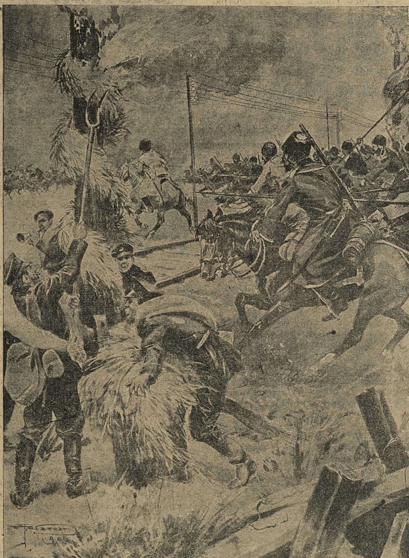
Атака казаковъ подъ предводительствомъ храбреца-офицера, чудомъ уцѣлѣвшаго послѣ ста рукопашныхъ схватокъ съ непріятельской кавалеріей.

Было это верстахъ въ пяти и первая впечатлѣнія, точно это не война, а маневры. Видно было отлично, особенно ночью. Дастъ молнію пушечный выстрѣлъ, а потомъ видишь, какъ вспыхнетъ рвущаяся шрапнель. Въ угро боя насъ рано разбудили. Спали мы на соломѣ. Соломы было много. Закутаешь