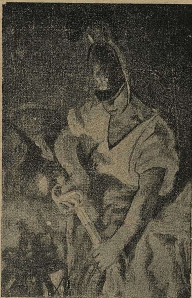
Кира сиръ. Картина П. Смуровича.

Нѣмецкая пушка надо мной стала стрѣлять какъ-то рѣже. Повернулся я