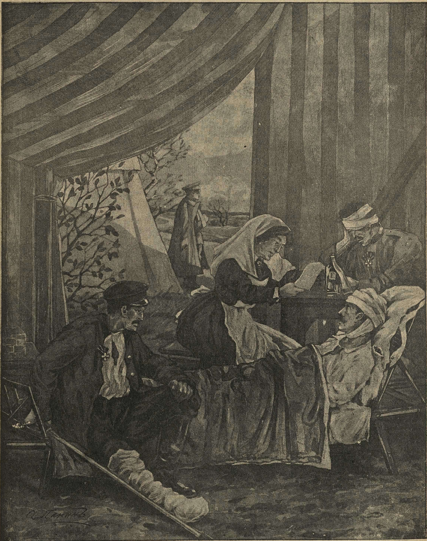
Сестра милосердія читаєть тяжело-раненому офицеру письмо отъ родныхъ.