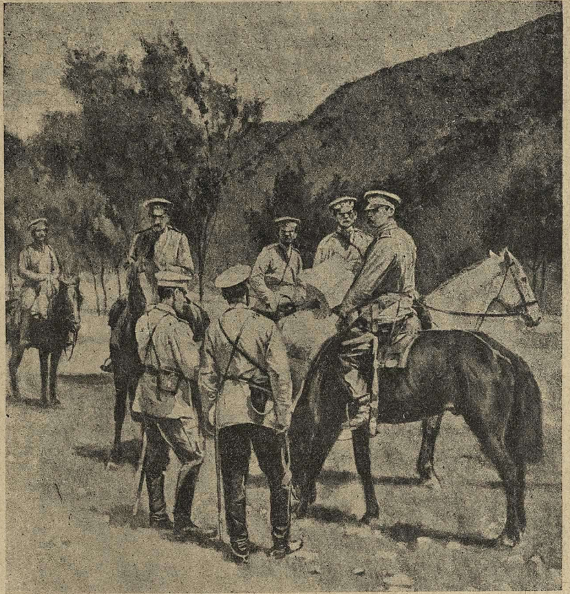
Военный совѣтъ офицеровъ въ Галиціи.

Я успѣлъ соскочить и пошелъ къ своимъ пѣшкомъ. Я слѣлалъ, однако, не больше десяти шаговъ, какъ былъ раненъ въ колѣно и упалъ.