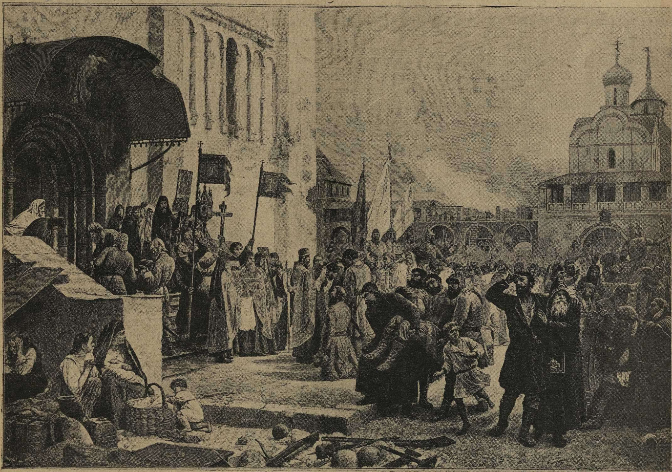
Защитники Свято-Троицкой Сергиевой Лавры въ 1608 г. Картина проф. В. П. Верещагина.

Осада Лавры тушинцами началась 23 сентября 1608 года. Въ этотъ день къ ней подошелъ со своимъ 30.000 войскомъ польскій воевода Сапѣга.