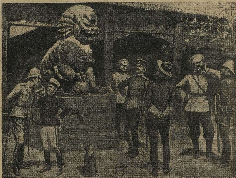
Группа европейскихъ офицеровъ на улицѣ Пекина.