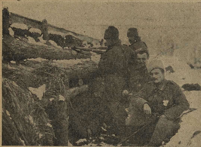
Въ окопѣ у бойницъ.