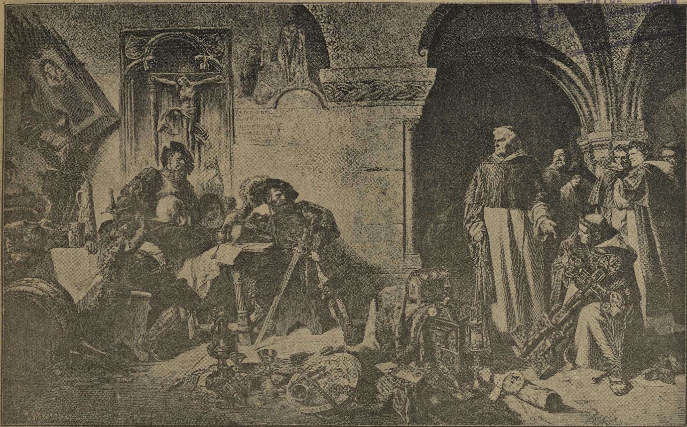
Завоеватели въ монастырь. (Изъ войнъ средневѣковья). Картина Г. Гаупъ.

дили тысячи взвизгнувшихъ пулъ тутъ наступающимъ нѣмцамъ. Сквозь дымъ и воздухъ, трепетно струившійся отъ содрогавшихъ его выстрѣловъ, чуть видны были колонны врага, какъ-то странно первыми рядами своими припадавшія къ землѣ и уже не встававшія. Маленькими игрушечными фигурками казались эти падающіе люди передъ какой-то невидимой чертой, перекатывавшіеся густыми рядами черезъ упавшіе ряды.