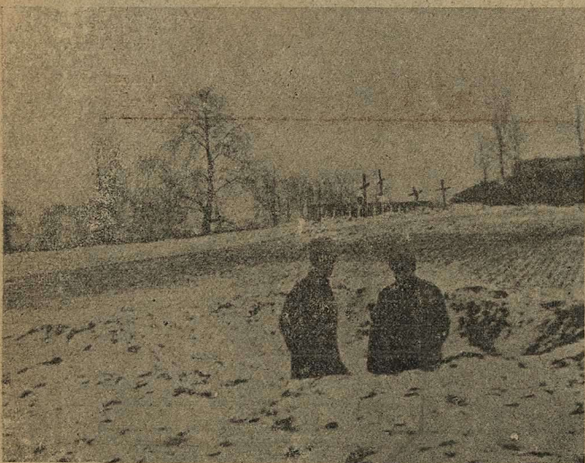
Въ воронкѣ отъ германскаго снаряда.

Рота нѣмцевъ, найдя, что туманъ и мгла слишкомъ затрудняютъ передвиженіе, образовала пустое карѣ, внутри котораго помѣстила безоружныхъ плѣнныхъ французовъ. Затѣмъ, нѣмцы сложили ружья въ козлы и стали ждать, пока туманъ разсѣется, коротая время въ издѣвательствахъ надъ беззащитными плѣнными. Эти долго молчали. Но вдругъ, пользуясь минутой, французскій сержантъ вскочилъ на ноги и крикнулъ: «Хватай ружья, ребята!» Въ одно мгновеніе французы прорвали карѣ и схватили ружья. Капитанъ нѣмецкаго отряда и десятокъ солдатъ, пытавшихся оказать противодѣйствіе легли подъ ударами штыковъ. Остальные сдались. Тогда уже французы — плѣнные пять минутъ назадъ — образовали пустое карѣ, а внутри расположились безоружные нѣмцы.