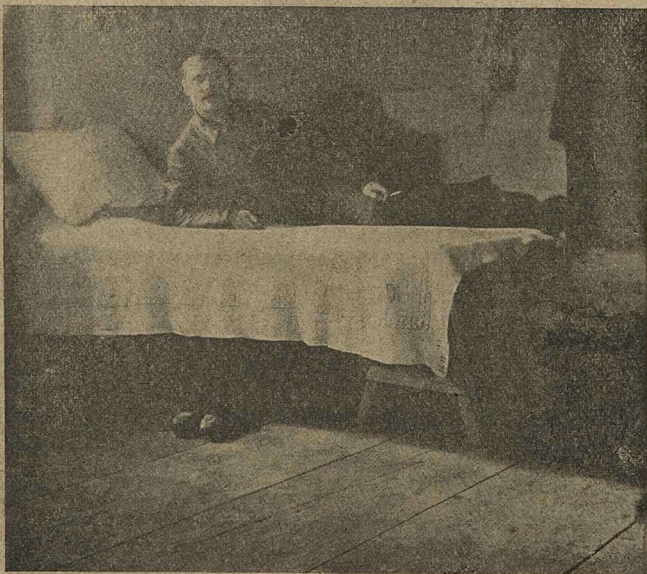
Въ резервѣ. Фотографія.

Но тутъ же онъ понялъ. Когда на разстояніи прицѣла, взятаго окопами, очутились враги, послышалась команда стрѣлять. Точно неприступной стѣной перегра-