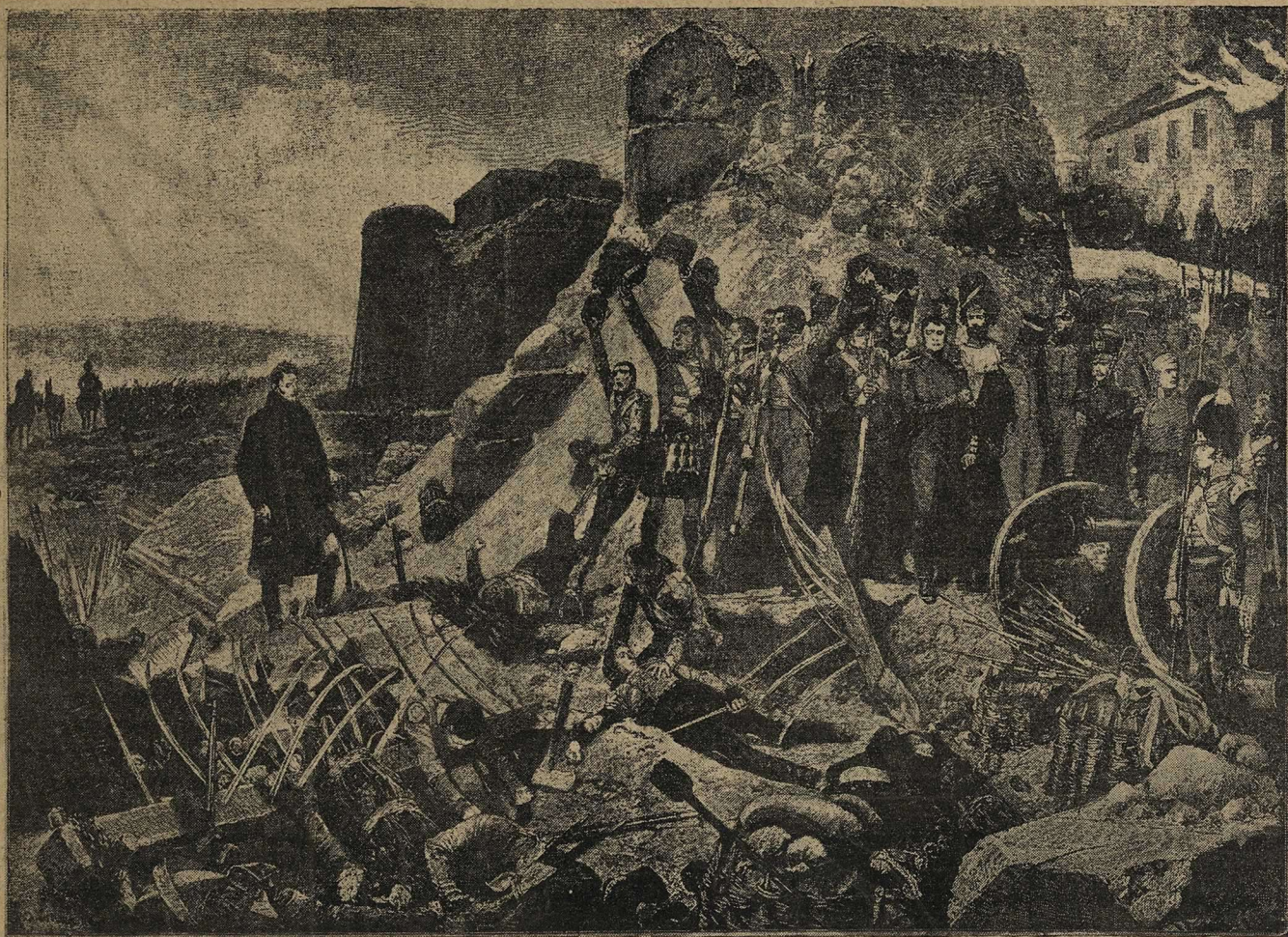
Вступленіе Веллингтона въ крѣпость Бадахось. — Картина Р. Катонъ Вудвилля.

Веллингтонъ — знаменитѣйшій англійскій полководецъ — былъ поистинѣ злымъ гениемъ Наполеона. Можно сказать, что именно съ первыхъ побѣдъ Веллингтона надъ французскими войсками въ Португаліи — начались пораженія непобѣдимыхъ до сихъ поръ армій великаго корсиканца. Какъ извѣстно, въ іюль 1808 г. Англія послала въ Португалію вспомогательное войско, подъ начальствомъ генерала Веллеса (впослѣдствіи графа, а затѣмъ герцога Веллингтона) — для вытѣсненія изъ Португаліи французскихъ войскъ. Съ этихъ поръ, вплоть до 1819 г., слѣдуетъ рядъ блестящихъ побѣдъ Веллингтона надъ французскими войсками, — несмотря на то, что послѣдніе находились подъ начальствомъ такихъ опытныхъ и знаменитыхъ полководцевъ, какъ Делабордъ, Сультъ, Массена, Мармонъ, Дюбретонъ. Слѣдствіемъ этихъ побѣдъ было совершенное очищеніе Пиренейскаго полу-