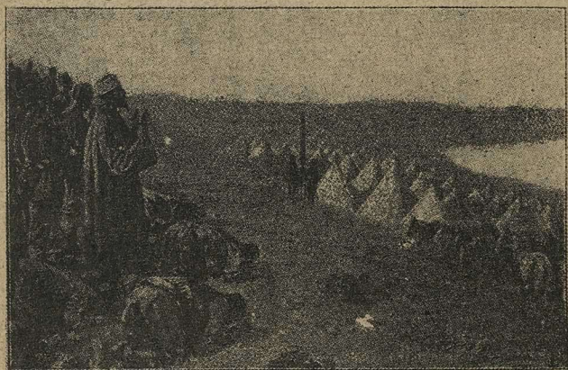
Молитва турецкихъ войскъ на Кавказскомъ фронтѣ.

Вдругъ тяжелая занавѣсъ, скрывавшая дверь, поднялась, и на порогъ показался Али-паша..