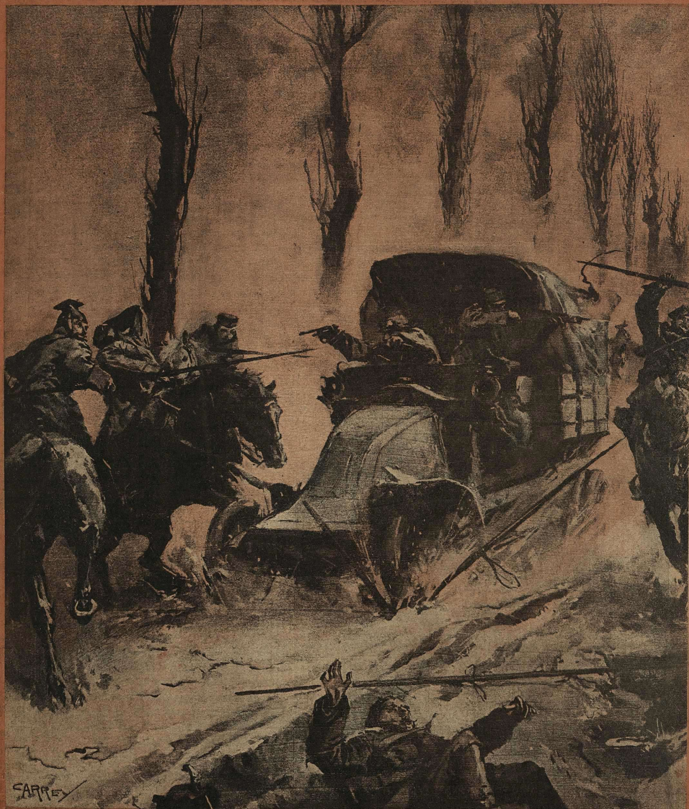
Стычка французскихъ военныхъ автомобилистовъ съ отрядомъ нѣмецкихъ улановъ.