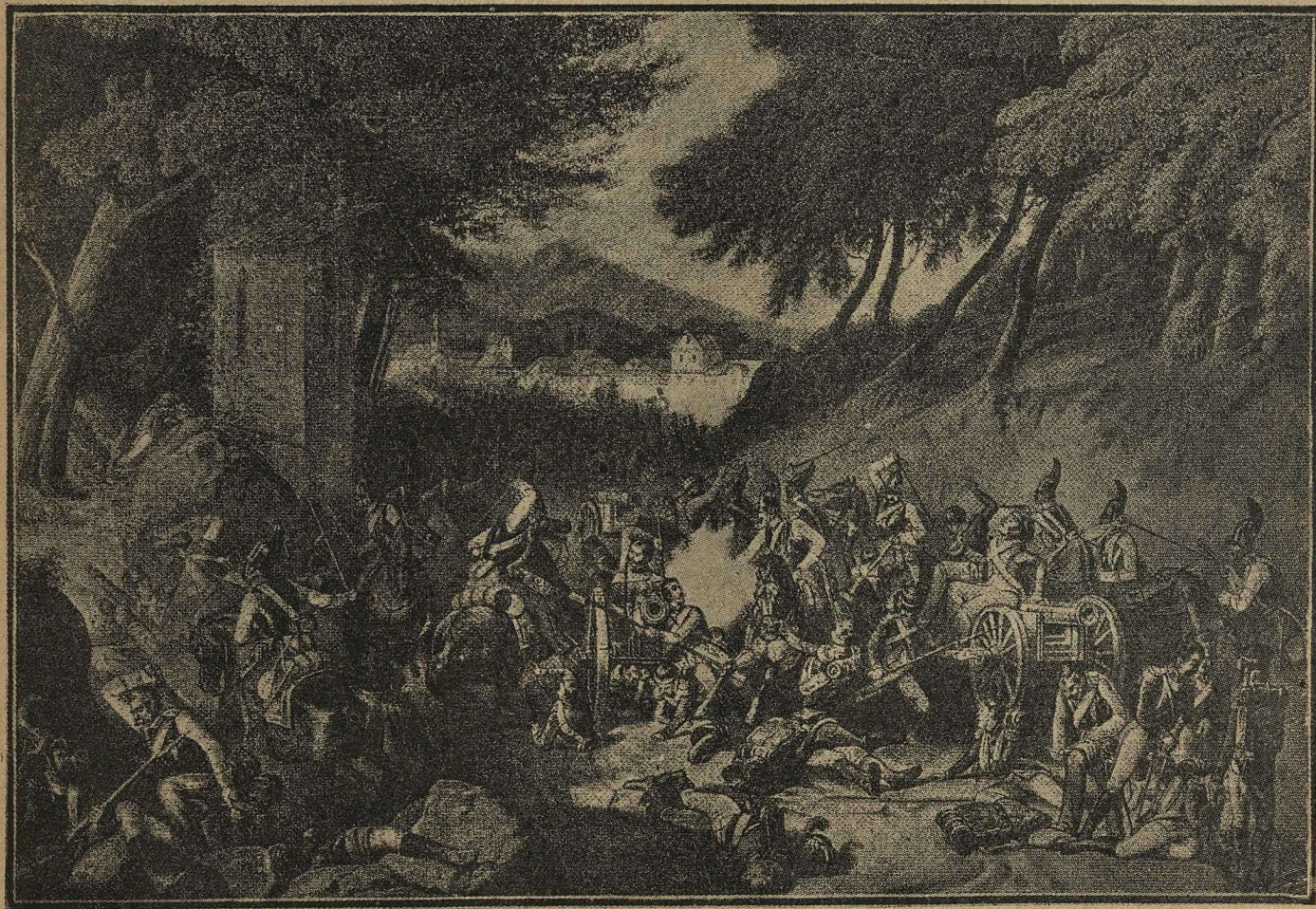
Сраженіе подъ Кульмою. Картина проф. Тимма.

Когда, наконецъ, его потребовали къ султану, паша, не сморгнувъ, а главное, не возражая ни слова, выслушалъ потокъ брани и упрековъ; затѣмъ, онъ началъ защищаться храбро и откровенно: