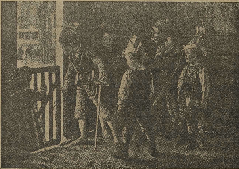
ВОЙНА. Съ картины Ф. Клегаса.

лая ночи напролетъ слушать, какъ онъ ораторствуетъ, принимая наполеоновскія позы.