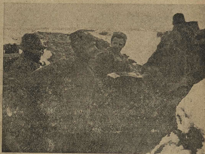
Пляска подъ гармошку.