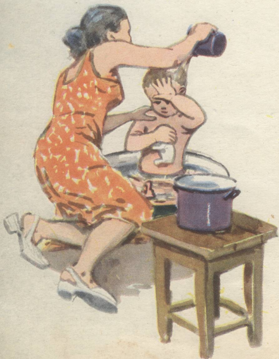
Рис. А. ДАНИЛЕНКО

Железная кружка у нас водолаз, И дело её — не простое. Она ежедневно по нескольку раз Ныряет в ведро с водою. И мы её просим: «Поддай-ка водицы Напиться, Умыться, Облиться, Побриться». Потом говорим ей: «Спасибо, дружок!» — И ставим её на дубовый кружок.