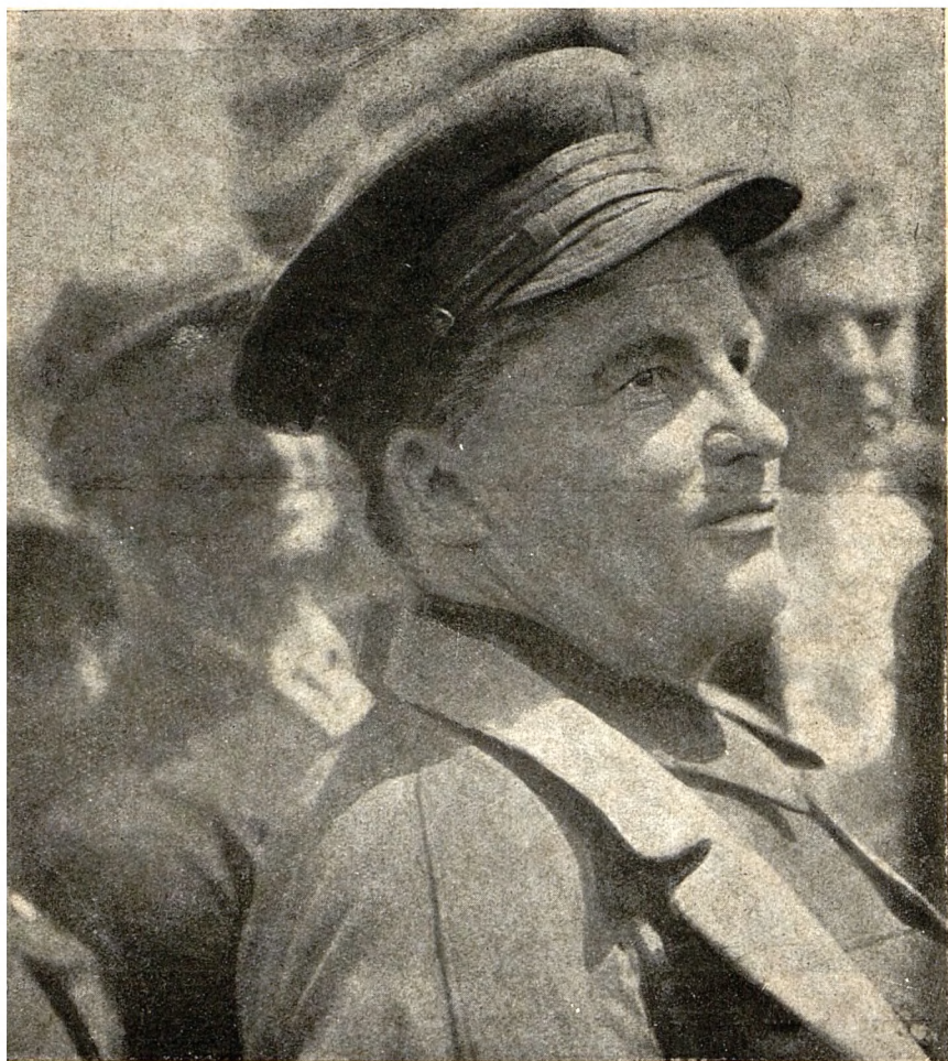
Товарищ Киров в Ленинградском парке культуры и отдыха 6 июня 1934 г.