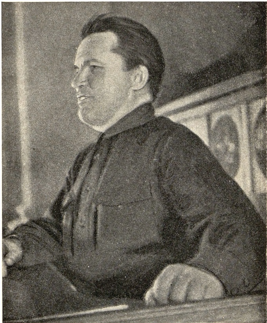
Товарищ Киров на трибуне XVII съезда ВКП(б)