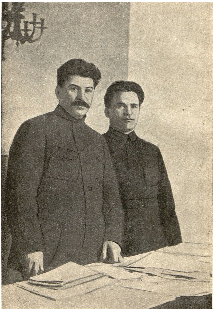
Товарищ Сталин и тов. Киров