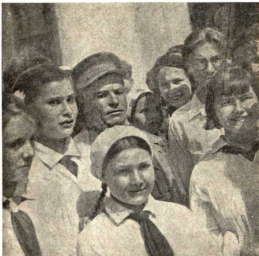
С. М. Киров на школьном празднике 6 июня 1934 г.