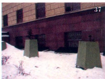
Озеленение. Как у взрослых.