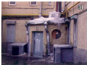
Кошмар топтунов - черный ход в галковское логово.