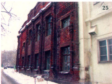
Шов сращения здания-трансформера.