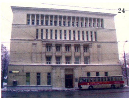
Со стороны фасада Союзмультфильм похож на гипершколу.