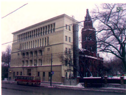
Наш советский Диснейленд.