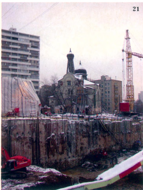
Дорога, которая ведет к храму (рядом с улицей Энгельса строят третье кольцо).