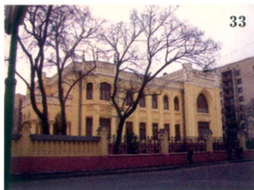
Дворец Морозовых- Рябушинских.

На первом этаже этого дома - оруэлловский ресторан, одно из излюбленных мест рекреации утят высшей категории.