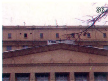
Поверх фронтона дембельский вопль: Тула!