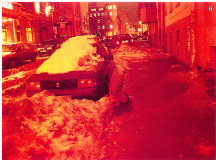
Культурка. В центре - местное насекомое.