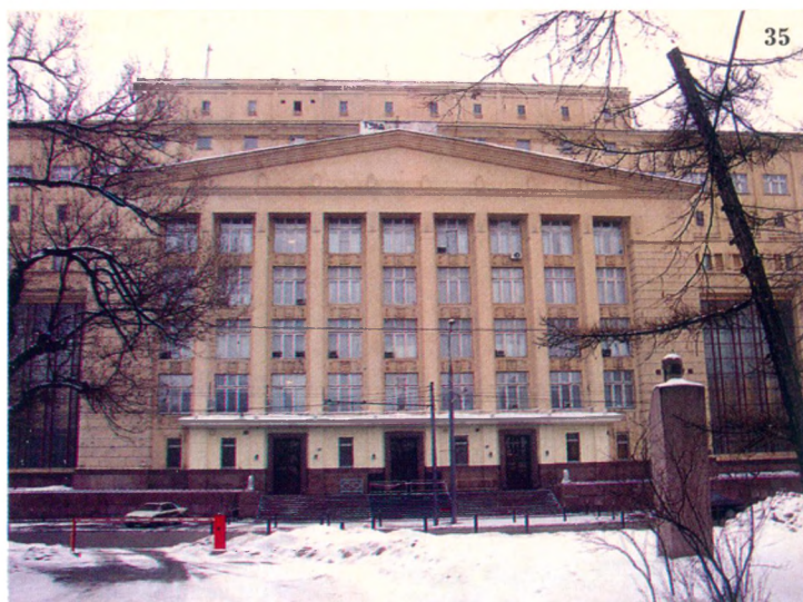
Типичный образчик советской военной архитектуры. Огромный фронтон, три высоченных входа, парадная лестница. Белые столбики по бокам - львы.