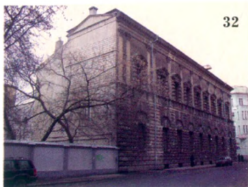
«Дом Тарасова» - копия дворца Палладио в Виченце.