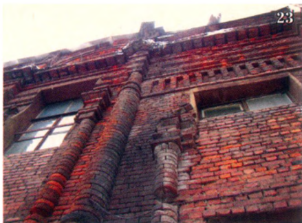
Кое-где стены опалены адским пламенем.